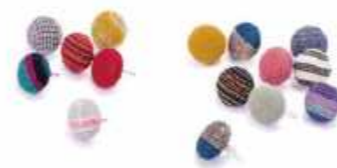
会津木綿 coronピアス・イヤリング 1,870円(税込)

ころんとした形のくるみボタンのピアスとイヤリング。会津木綿の美しい模様と色が豊富に揃っていて、どれにしようか迷ってしまうほどです。