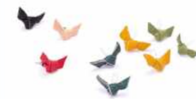
oze deer 結ピアス・イヤリング 1,870円(税込)

尾瀬で駆除される鹿の命を活用した革。その鹿皮を結んだ形のピアスとイヤリングです。フォーマルにも活用できるアイテムです。