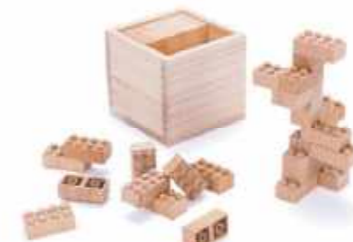
もくロック ※会津産のブナの木を使用しております。 5,500円(税込)

木製のブロック、もくロック。やさしい木の感触りと自然の色、心地いい音が子どもの心を育みます。贈り物にも喜ばれるおもちゃです。