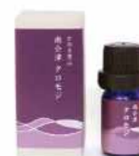
和精油 南会津産 クロモジ 3ml 3,850円(税込)