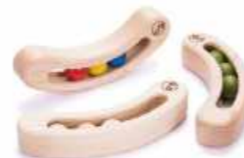
FAVA ファーヴァ ※2012年グッドデザイン賞受賞 ナチュラル 2,640円(税込) カラー 2,970円(税込)

favaはイタリア語で「豆」。木の感触が優しく、房の中に入った3個の豆が動いて音を出す楽しいガラガラです。