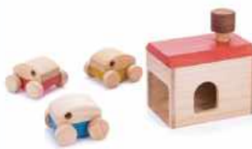
GARAGE ガレージ ※2013年グッドデザイン賞受賞 車(青)・車庫セット 5,060円(税込) 車のみ(青/赤/黄) 1,100円(税込)

煙突を叩くと車が飛び出す車と車庫のおもちゃ。飛び出した車の距離を競ったり、積木と組み合わせても楽しめます。