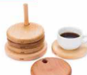
ベーグルコースター 5枚入り1セット 3,240円(税込)

ベーグルのような形のコースターを作りました。塗装はえごま+みつろうで安全。一枚一枚違う木なので、色や感触のお気に入りを見つけてみては?