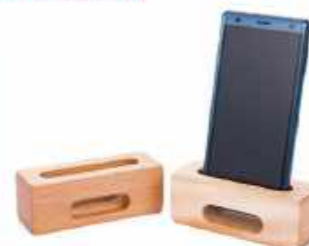
スマートフォン立てスピーカー ※会津産のブナ、トチの木を使用しております。 2,200円(税込)

ただのスマートフォン立てではありません。シンプルな形ながら機能は侮ることなかれ。美しい音を響かせてくれます。一度お試しください。