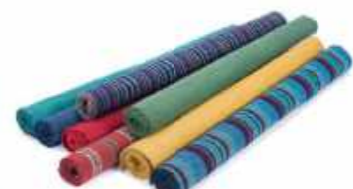
会津木綿 生地1m 1,000円(税込)

使い勝手の良い大きさの会津木綿1mです。手作り派のお友だちには出来上がった商品より、きっと喜ばれると思います。