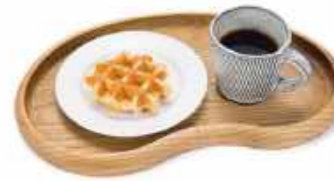
ビーンズトレイ 4,800円~(税込) ※材質により価格が異なります。

そら豆のような形のトレイを作りました。縁が高めで安定感があり持ちやすいです。塗装はえごま+みつろうで安全です。