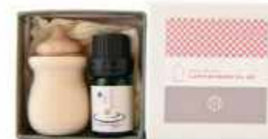
ラッテダロマと和精油セット ※和精油の種類によって料金が異なります。 精油1本(5ml)・ラッテダロマ1個 3,080円(税込)