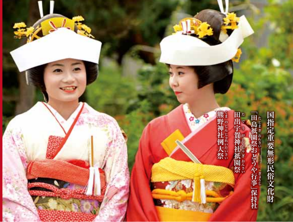
国指定重要無形民俗文化財 「田島祇園祭おとうや行事」保持社 田出宇賀神社祇園祭 熊野神社例大祭

身を浄め花嫁衣裳を身に纏い 神様の喜び給う供え物 7つの行器に満ちし盛り 終始無言の厳肅なる神楽をおさめ 精魂籠めた神様へ供えし濁酒 身体の間々まで行き渡らせ 3日間の夏に疫病・災難・厄除け 良縁結び、長寿そして豊穰を願う