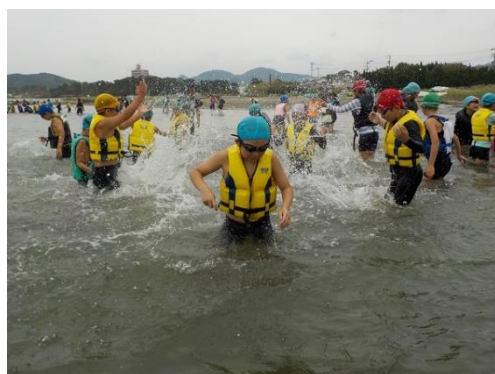
町立小学校児童間の交流活動 (小学生農山漁村交流事業)