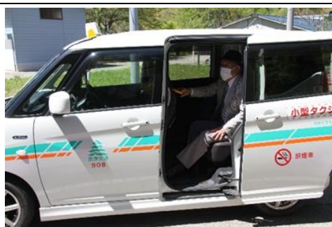
デマンドタクシー運行 (地域乗合タクシー運行事業)