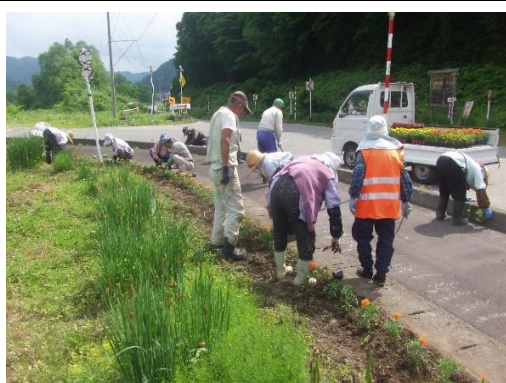
花いっぱい運動 (集落応援交付金事業)

令和3年度も引き続き、事業者の活動支援を行い魅力的な地域づくりの活動を行ってまいります。