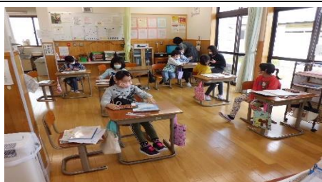
放課後児童クラブ田島第二小学校 (放課後児童健全育成事業)