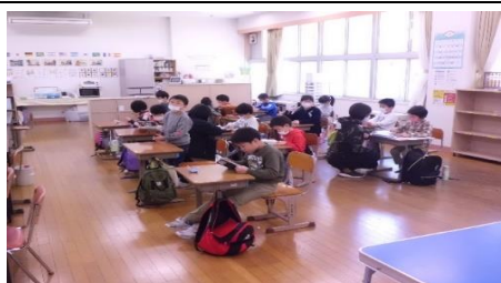
放課後児童クラブ田島小学校 (放課後児童健全育成事業)

高齢者世帯の増加により見守りが必要な世帯も増加傾向にあります。高齢者世帯が抱える不安を解消できるよう、令和3年度も事業を継続し、高齢者の見守り体制の強化を進めてまいります。