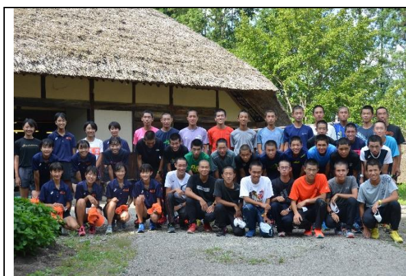
埼玉栄高等学校駅伝部伝統のハチマキ藍染 (都市交流事業)

また、林産業従事者の高齢化及び後継者不足などにより林産業の衰退が進む中で、新規雇用者を確保し林産業の振興に取り組む町内林産業事業体に対して支援しました。