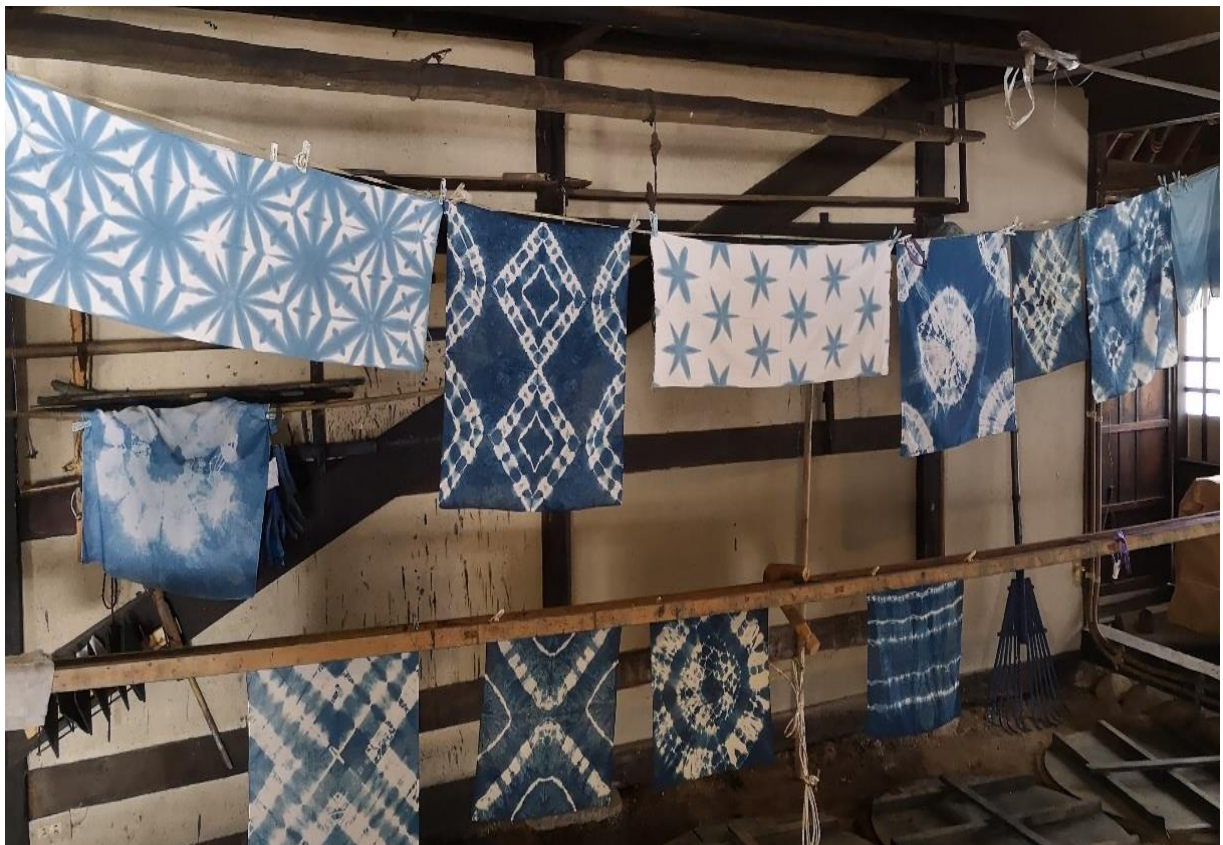
藍染（奥会津博物館：2021NHK大河ドラマロケ地）