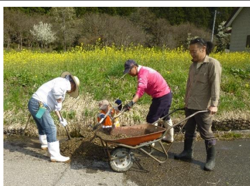
水路の整備 (集落応援交付金事業)