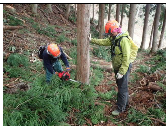
指導員による伐採指導 (林産業人材育成支援事業)