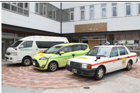
デマンドタクシー運行 (地域乗合タクシー運行事業)