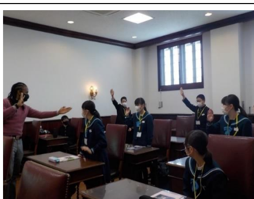
外国人教師による英語学習 (英語が話せる人材育成事業)

5・6年生 39 学級、複式学級6学級、3・4年生 12 学級、複式学級2学級 計 59 学級