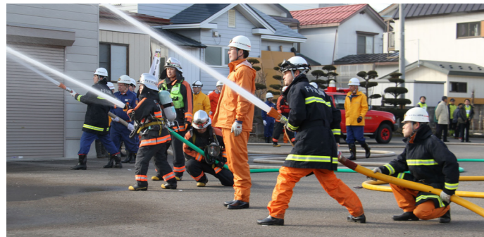
第1支団の訓練の様子（薬師寺）

1月26日、文化財防火デーに合わせて、田島・伊南地域で文化財防火訓練が行われました。 第1支団では、本町地内の「薬師寺」で火災が発生したとの想定で訓練を実施。訓練火災発生時の連絡が入ると、第1分団（田島地区）第1部・第2部の消防団員ら約50人が出動し、洗練された動きで本番さながらの消火活動が進められました。 第2支団では、伊南地域古町地内の「照國寺」で訓練が行われ、貴重な文化財を守るための防火手順や防火意識が再確認されました。