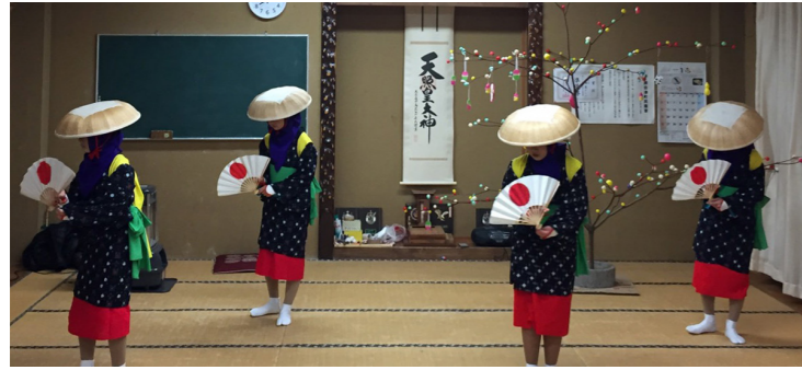
踊りを披露する中高生たち（鶴巣地区）

県の指定民俗文化財（重要無形）「南郷の早乙女踊り」が、1月11日に南郷上町・上平地区、界・蛇の宮地区、鶴巣地区、2月8日に下山地区でそれぞれ行われました。 早乙女踊りは、集落内の区長や班長宅、新築や婚礼などの祝い事があったお宅を訪問し、五穀豊穡と家内安全などを祈願します。 踊り手は地域の中高生が演じ、謡手は子どもから大人までがみんなで務めることで、地域の伝統行事が継承されています。