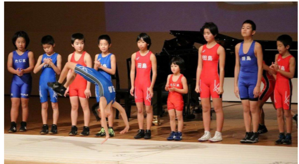
レスリングならではの技を披露する選手たち