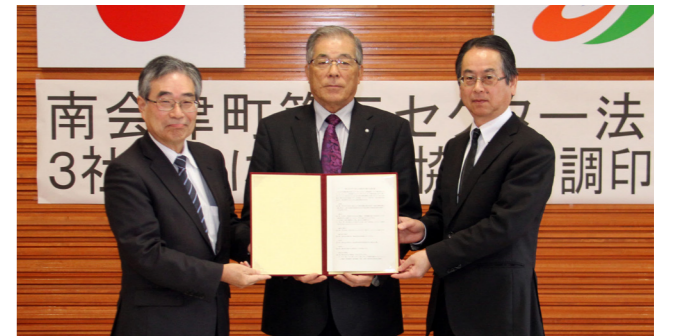
左から渡部社長、大宅町長、星社長