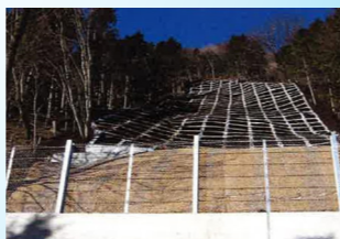
吹付法土工施行後の全景