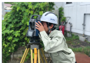
基準点測量の様子

社是「良い会社にしよう」を基本理念に継続して行ける会社となるよう、取締役と社員が一丸となって取り組んでいます。