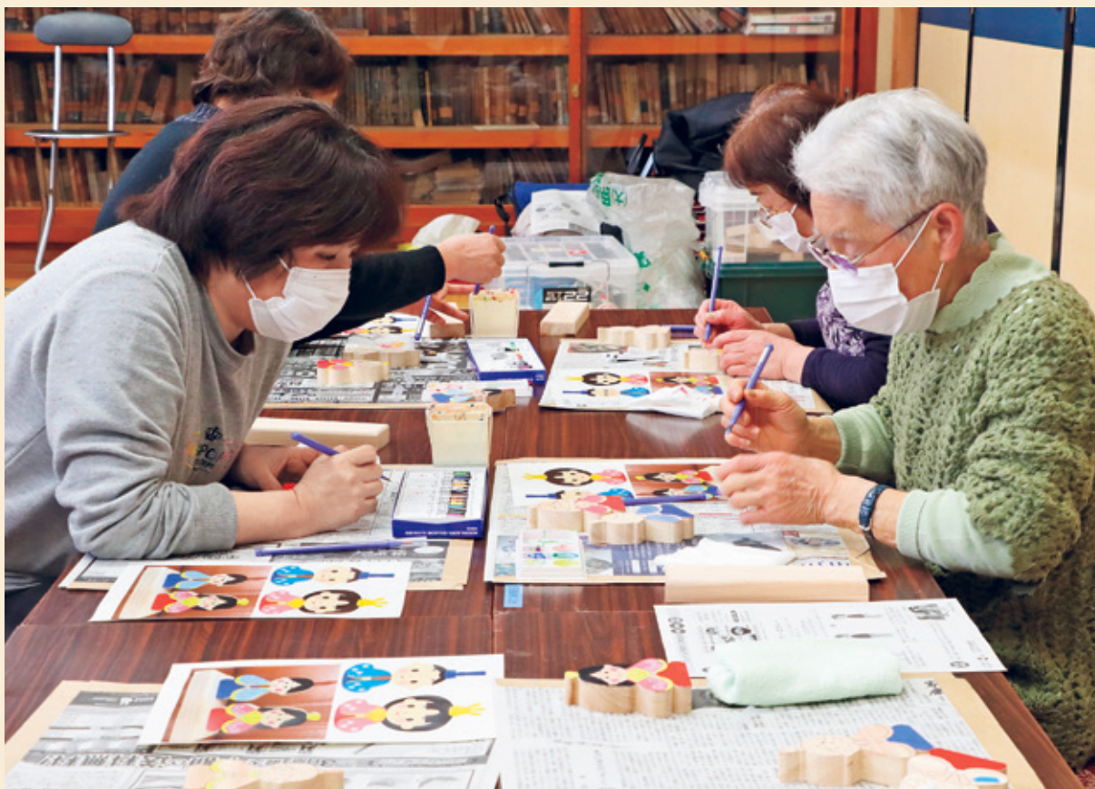
公民館事業（木工教室）