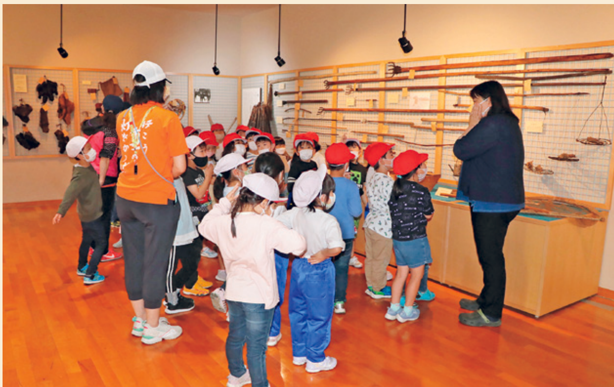
総合学習（奥会津博物館見学）