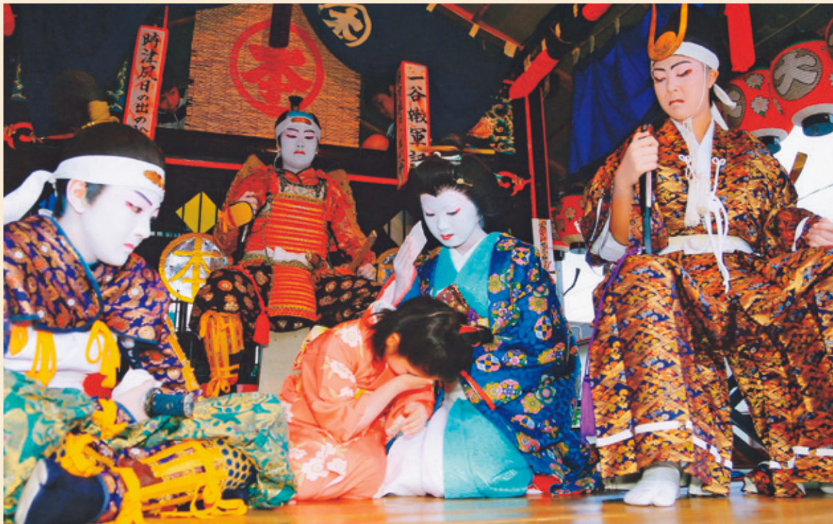
田島祇園祭屋台歌舞伎