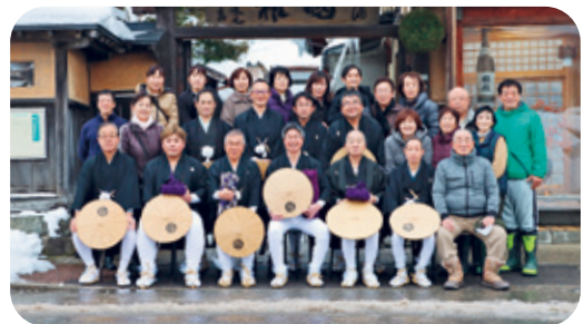
田島祇園祭のおとうや行事