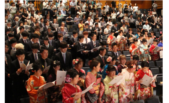
昨年度の成人式の様子

なお、開催可能と判断した場合でも、その後の感染状況により、開催を見合わせる場合がありますので、ご了承ください。