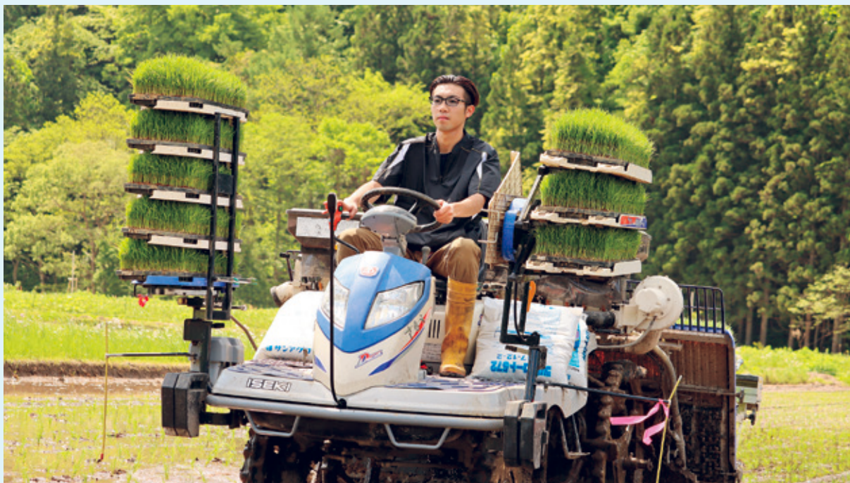
農業に従事する若者