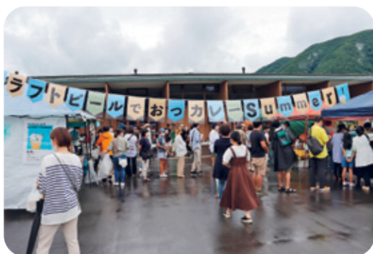
町内事業者連携によるイベント