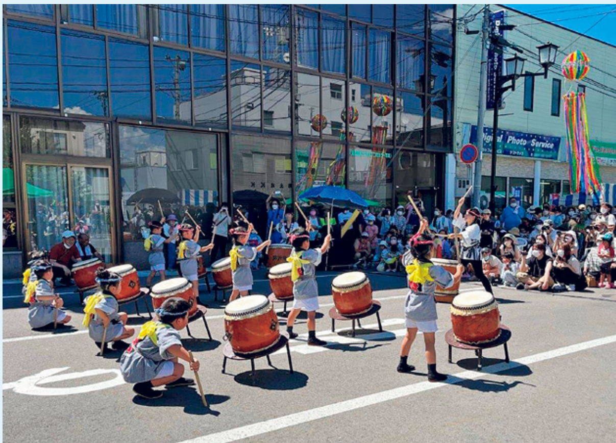
南会津町商業協同組合によるイベント