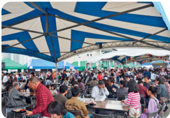
南会津新そばまつり