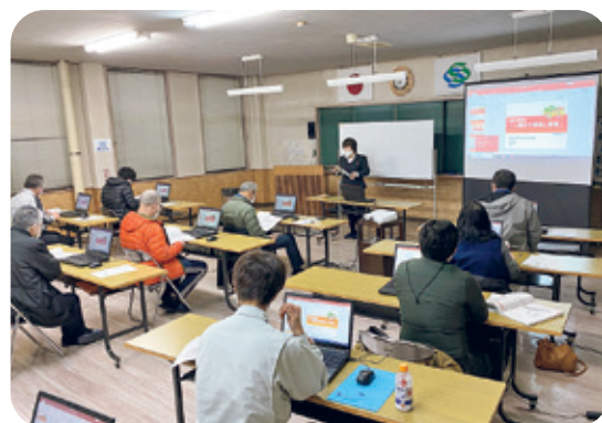
商工会パソコン教室