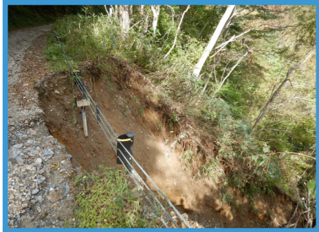
田代山猿倉登山口に至る県道栗山館岩線の崩落現場

昨年10月に発生した台風19号は、田代山に大きな爪痕を残し、のり面や猿倉登山口へ至る県道栗山館岩線など、各所に崩落を引き起こしました。 これまで県道の全面通行止めが敷かれてきましたが、復旧工事が完了し、8月7日から通行が可能となりました。 登山道はしっかり整備されていますので、田代山ファンの皆さん、ぜひ足を運んでみてください。