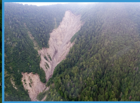
ヘリから見た田代山のり面の崩落現場