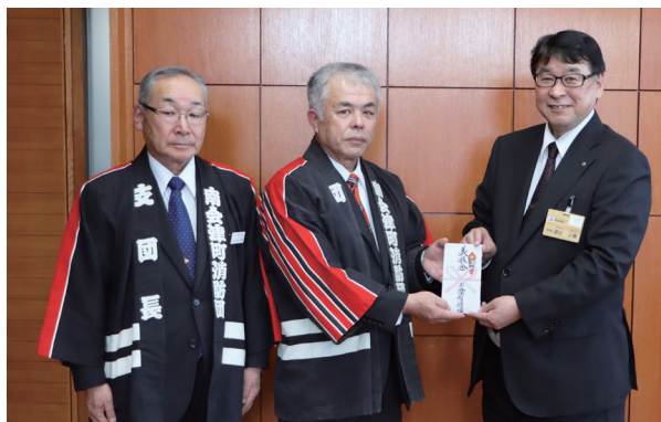
左から、児山新団長、星前団長、渡部町長