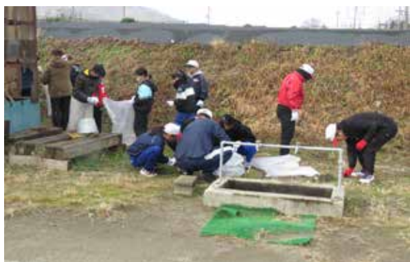
チームや年齢の枠を超えて清掃活動を