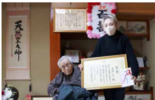
写真撮影に応じるチヨミさん㊤