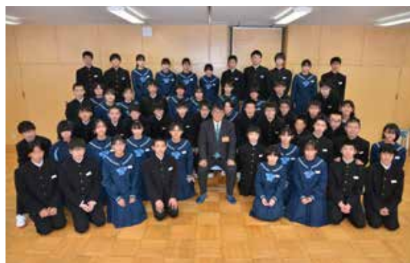
意見交換後の記念撮影

当日は、生徒会の皆さんの司会により進行されました。生徒の皆さんからいただいた意見には、町の大自然や星空など地域資源の活用やPR方法、身近な生活に根ざした中学生ならではの提言があり、今後の施策にいかされていくこととなります。