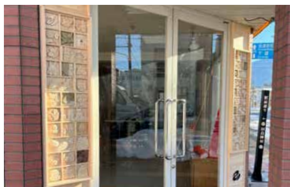
田島陣屋に設置された木彫りの看板と行灯(右)