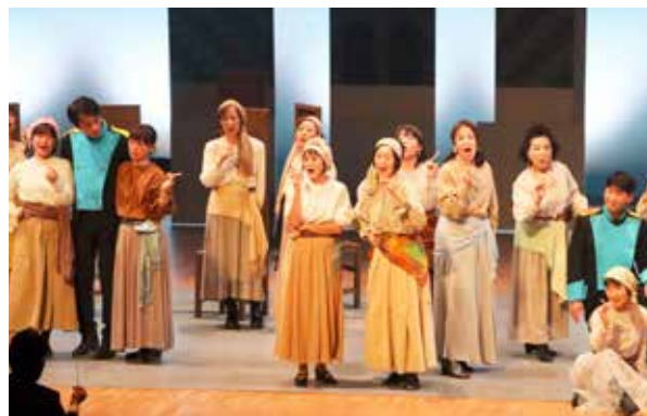
町民合唱団のプロ顔負けの歌唱

この公演は、プロの指揮者と、演出家、歌手の皆さんと一緒に、町民の方々が出演し、小道具・大道具や衣裳まで手作りで作成。衣裳には藍染と南郷刺し子を取り入れるなど南会津版のオペラhi・カルメンとなりました。地域で生活する町民の皆さんの演技や歌声が会場を包み、盛大な拍手が送られました。