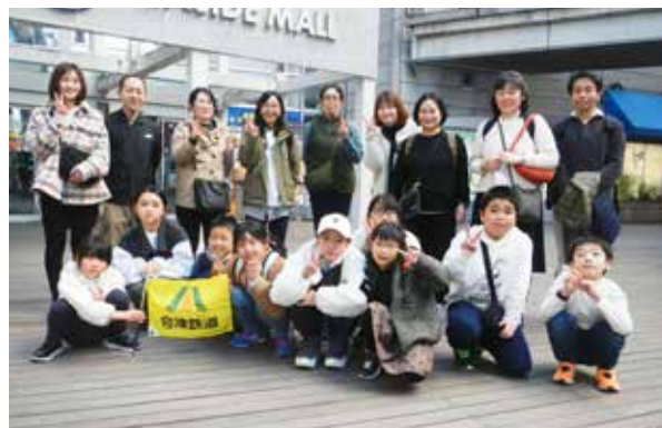
お台場で旅の記念に1枚

初日はお台場の東京ジョイポリスで、様々なアトラクションを満喫。2日目は都内屈指の観光名所、浅草エリアを中心に、思い思いの時間を過ごす親子の笑顔がありました。