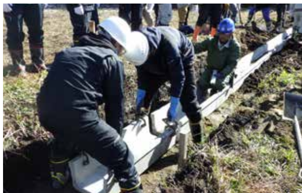
竹筋コンクリート製U字溝を設置する様子