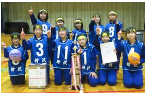
優勝した「HISAWA女子」の皆さん