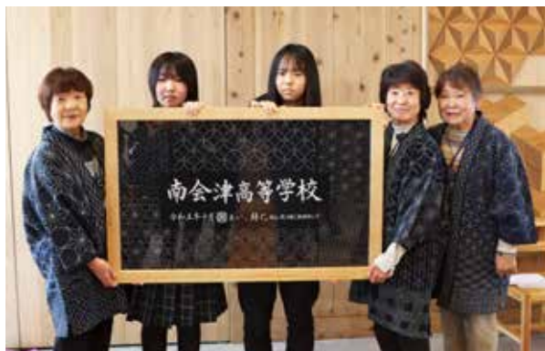
協働制作したタペストリー