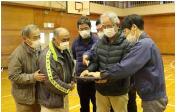
ドローンの操作方法の説明を受ける地域の方々