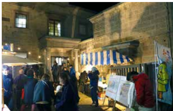
11月22日、石造建築物でのイベント