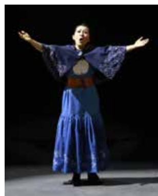
児童・生徒合唱団も活躍し、手作りの衣裳がプロの演技に花を添える