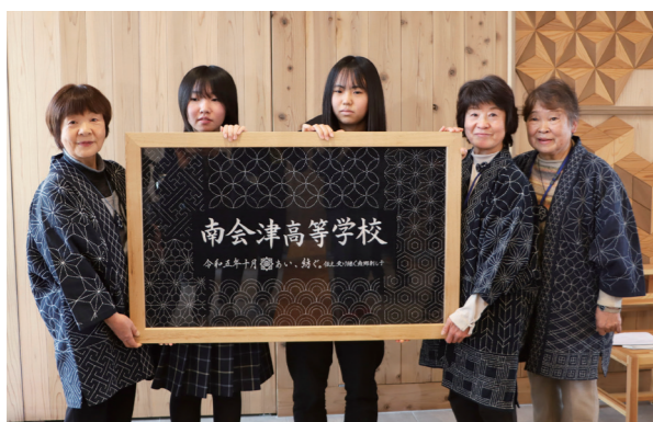
協働制作したタペストリー