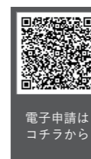
電子申請はコチラから

【入所要件】 ① 就労などで、保護者が日中留守にする家庭の児童であること ② 他の児童と一緒に、集団生活を送れること 【申請期間】 1月12日(金)～2月9日(金) 【注意事項】 定員を超える申し込みがあったときや入所審査によっては、入所をお断りする場合がありますので、ご了承ください。 定員を超えてもなお、入所を希望される場合は「待機者」となります。