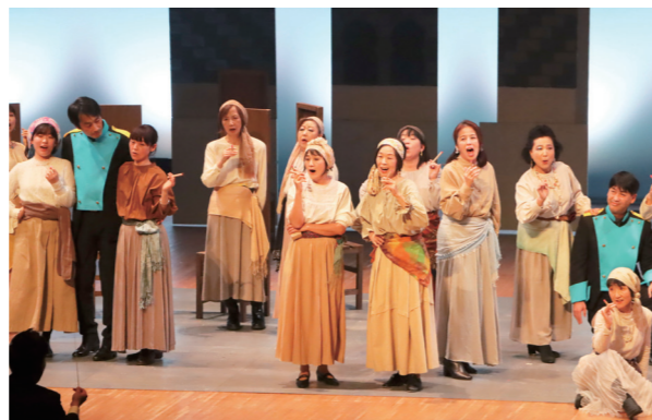
町民合唱団のプロ顔負けの歌唱

この公演は、プロの指揮者と、演出家、歌手の皆さんと一緒に、町民の方々が出演し、小道具・大道具や衣裳まで手作りで作成。衣裳には藍染と南郷刺し子を取り入れるなど南会津版のオペラhi・カルメンとなりました。地域で生活する町民の皆さんの演技や歌声が会場を包み、盛大な拍手が送られました。