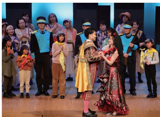
児童・生徒合唱団も活躍し、手作りの衣裳がプロの演技に花を添える