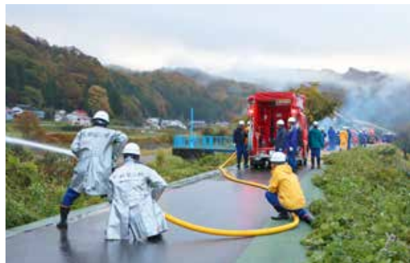
消火訓練の様子（鴫巣区）