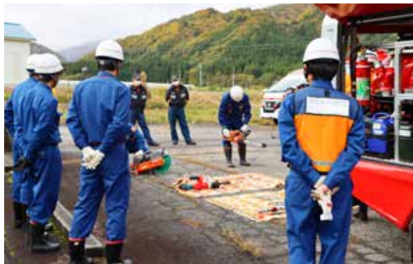
救助資機材操作訓練の様子（白沢地内）