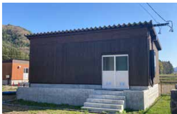
木材パネルを活用した田島第1水源地