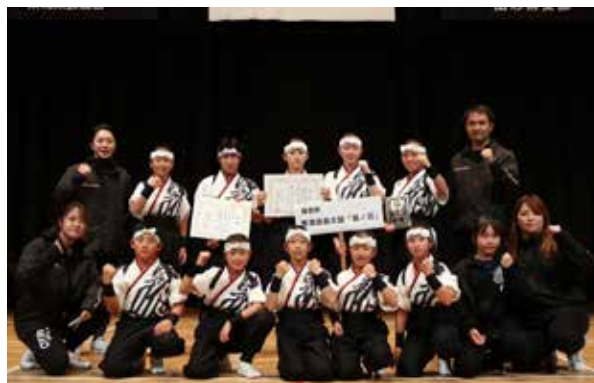
會津田島太鼓「狐ノ刃」の皆さん

11月12日、山形県庄内町文化創造館で開催された標記大会にて、會津田島太鼓「狐ノ刃」が第3位に輝きました。コロナ禍の行動制限の中でも練習を続け、力をつけた子どもたちが、丁度よい時に吹く風という意味がある「時津風」という曲に、祈りを込めて演奏。新しい時代の追い風となるような力強い太鼓を響かせ、会場を湧かせました。