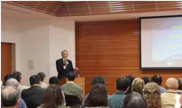
渡部先生による講演の様子