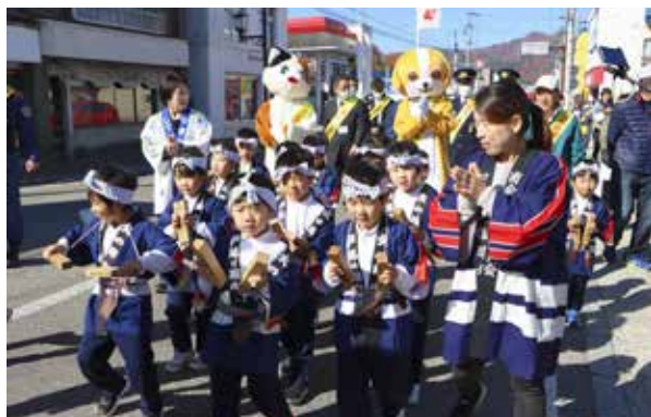
火の用心を呼びかけた子どもたち