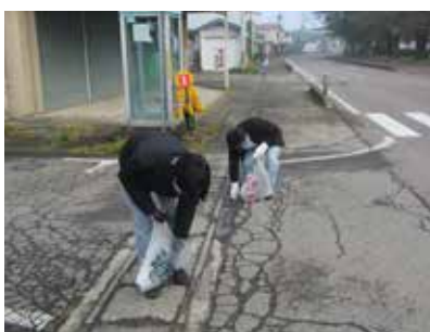
ウォーキングを兼ねたごみ拾い

そこで、働き世代である20代〜30代の若い世代からの健康の意識付けや40代〜50代の健康増進をさらに進め、地域・職域の関係者が連携し、働き世代の健康づくり、事業所での健康経営を推進する必要があります。