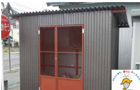
更新したごみ集積所