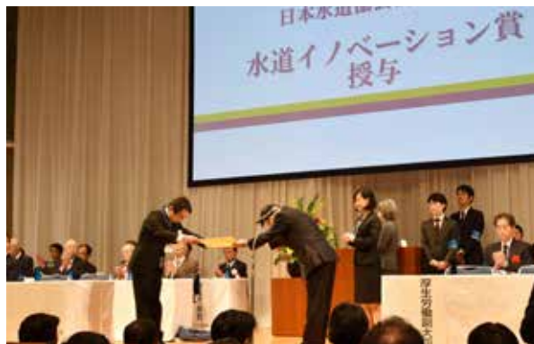
10月18日に開催された授与式の様子

平成30年度の受賞に続き2度目となります。本町の水道事業の取り組みが先進的な事例として認められました。町では今後も積極的に創意工夫を図り、持続可能な水道事業運営に努めてまいります。