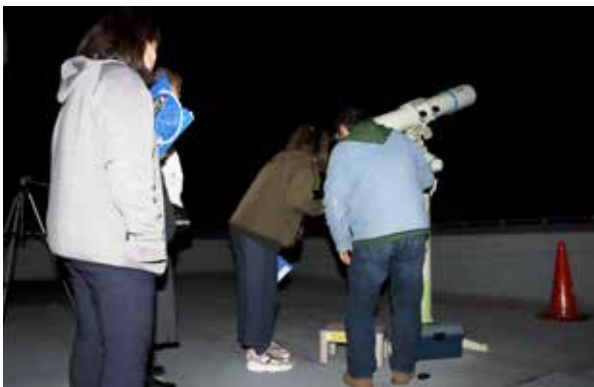
澄んだ空に輝く星々を観察