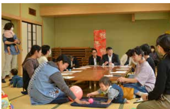
南郷総合センター「つどいの広場」の様子