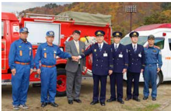
協定を締結した町消防団と消防署の皆さん