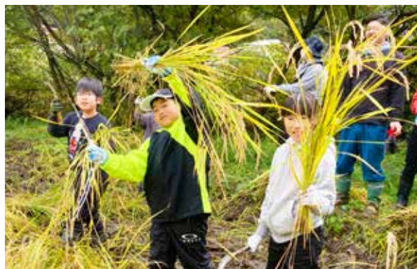
上手に鎌を使い収穫をする子どもたち

田植えも稲刈りも初体験という子どもたちも多く、身を持って農業の大変さと収穫の喜びを体験していました。