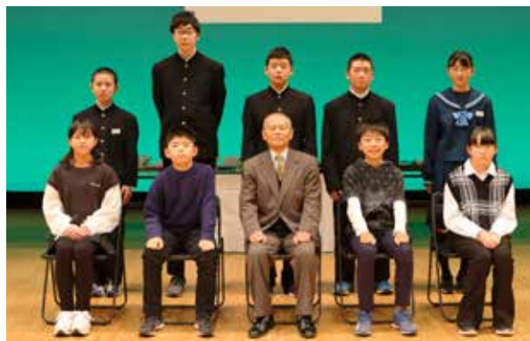
表彰式に参加した皆さん

町内小・中学生より74点の作品の応募があり、受賞者へ賞状や賞品などが贈呈されました。