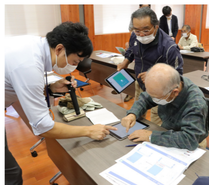
スマートフォン教室の様子

施策の目指す姿 ◇あらゆる場面でデジタル化を進めることにより、業務の効率化や利便性に優れた住民サービスが提供されています。 わたしたちができること ◆マイナンバーカードをつくりま す。 ◆スマートフォンを持ちます。