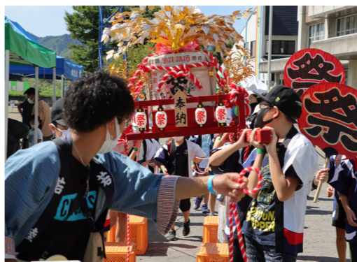
伊南豊年祭りの様子

施策の目指す姿 ◇あらゆる場面でデジタル化を進めることにより、業務の効率化や利便性に優れた住民サービスが提供されています。 わたしたちができること ◆マイナンバーカードをつくりま す。 ◆スマートフォンを持ちます。