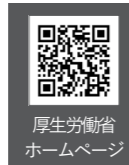
厚生労働省ホームページ