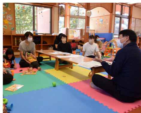
広聴事業動く町長室の様子

施策の目指す姿 ◇町民・議会・行政が、互いの役割を認識し、協働のまちづくりを進める意識の高揚が図られています。 わたしたちができること ◆行政や地域の情報に目を向け積極的に参画します。