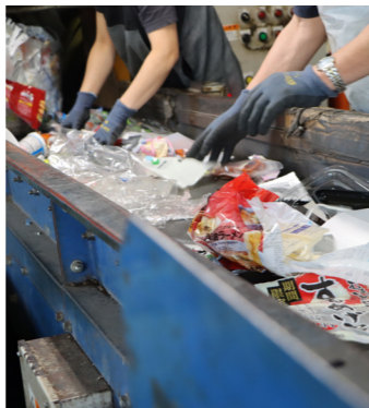
手作業で分別されるごみ

資源としてリサイクルできるごみも、分別せずに出されてしまうと再活用できなくなってしまう。また、分別されていても汚れがついているものはリサイクルすることができず、燃えるごみとして処分することとなります。 ごみの減量化およびリサイクル率の向上のため、正しいごみの出し方にご協力ください。