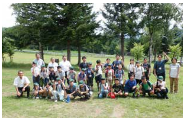
たかつエスキー場での集合写真