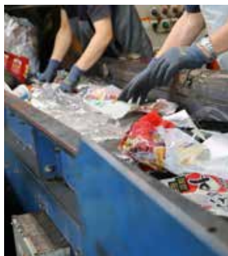
手作業で分別されるごみ