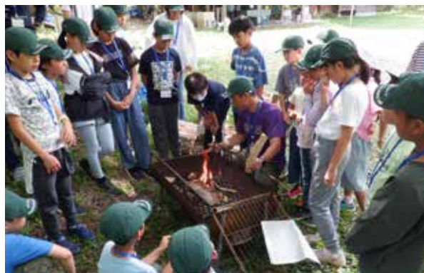
しらかば公園での野外炊飯

首都圏などから小中学生21名が参加し、ホームステイや民宿に宿泊しながら、駒止湿原や前沢曲家集落散策、デイキャンプ、川遊びなどを行いました。参加者からは、「川遊びはスリルがあって水もきれいで楽しかった」「食べたことのないものを食べたり、初めての体験をして楽しかった」と笑顔で話してくれました。