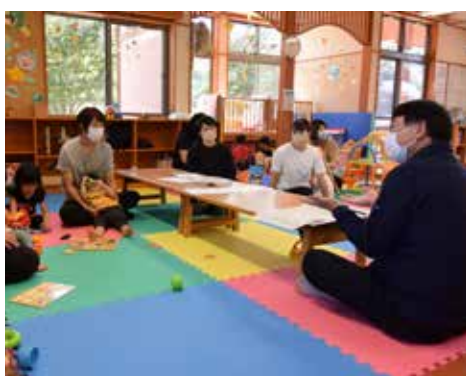
広聴事業動く町長室の様子