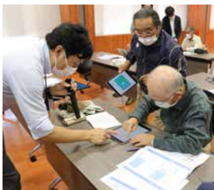
スマートフォン教室の様子