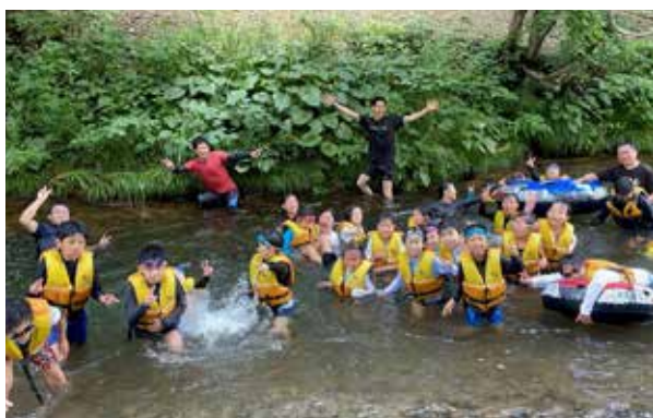
館岩の自然を満喫する様子