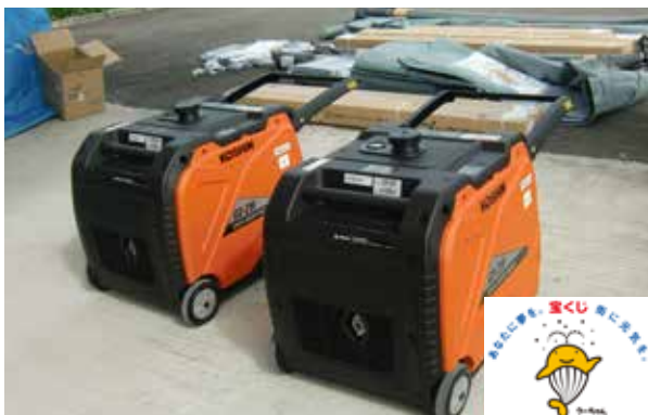
防災拠点に整備した発電機やテント