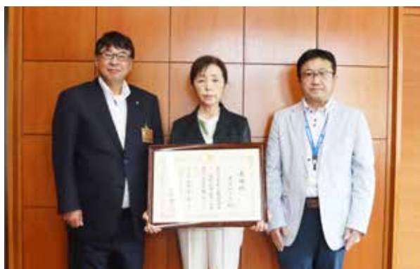
左から渡部町長、渡邊さん、鈴木法務局長