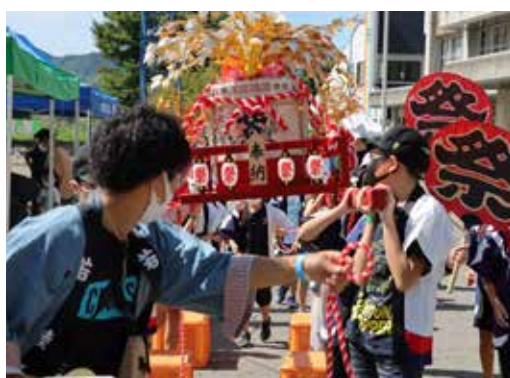
伊南豊年祭りの様子