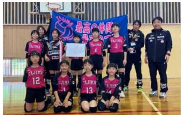
優勝した田島バレーボールスポーツ少年団の皆さん

初日の予選リーグでは相手チームを圧倒、1セットも落とすことなく順位決定戦へ。2日目も危なげない試合展開で快勝しました。