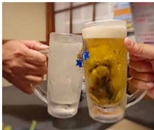
表1の量の2倍以上を継続して飲んでいる場合には注意が必要です