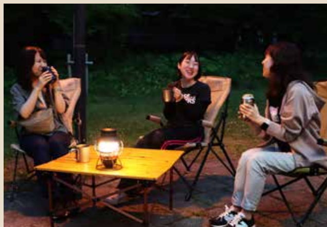
夜は南会津ならではの星空も

キッチンやバーベキュースペースなどが整備されている森の中のコテージでの女子会をパシャリ！