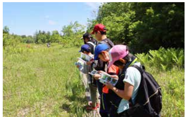
ガイドブックを片手に散策

今回は、国指定天然記念物となっている駒止湿原の高山植物の観察や、ブナ林の散策をしました。「南会津町の湿原を守る会」の会員の方々に細かい説明を受けながら、知識を深めていました。