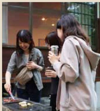
バーベキューセット をレンタルして