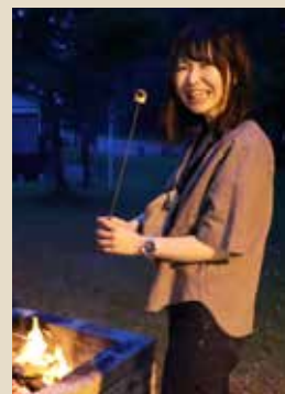
マシュマロを 焚火で