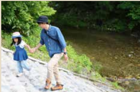
釣りができる川辺も