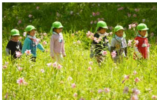
南郷保育所の子どもたちがお散歩に

群生地はピンク色の花で一色となり、例年と変わらず「天空のひめさゆり」の名に恥じぬ美しい姿を見せてくれました。