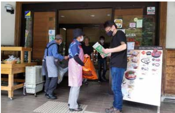
リーフレットや減塩商品などを配布