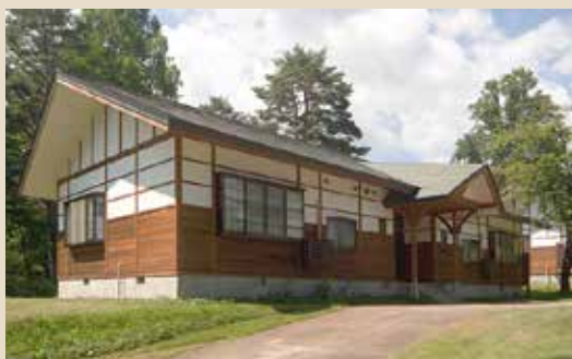
キッチンがあるから 料理も簡単