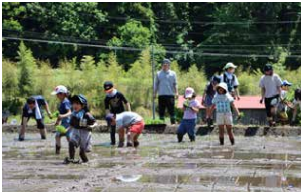
水田には、子どもたちの楽しいような声が