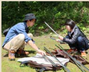
日除けタープを 家族で設営