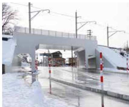
昨年開通した田島バイパス