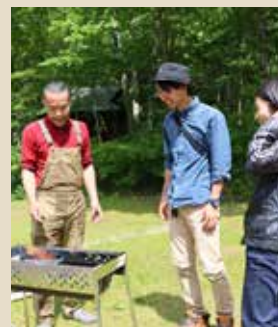
スタッフが コツを伝授