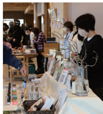
町産材を使用した商品販売