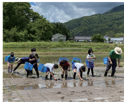
小学生による田植えの様子

◆地区の農地維持作業などの共同作業にみんなで取り組みます。 ◆野菜や木材など地元産を消費します。