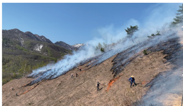
【問合せ】 総合政策課 地域振興係 電話 0241-62-6210

◆藤生鉄山の山焼き 江戸時代から藤生区民全世帯により脈々と続けられてきた区の中行事であり、食糧不足対策として山に火を入れ始めたことが起源と言いつづけています。 山焼きの継続が、同地の貴重な植物や昆虫が生息する環境を守っています。