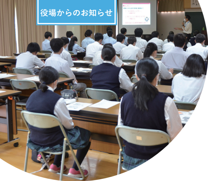
役場からのお知らせ