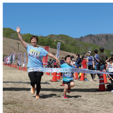
親子でフィニッシュ