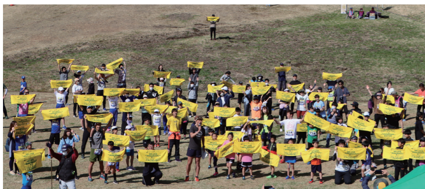
参加者による集合写真