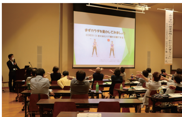
町保健師による講演の様子