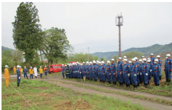
早朝より訓練に参加した団員の皆さん(和泉田区)

昼夜を問わず日々の訓練や火災予防活動に励む団員の勇姿が披露されました。これから火災が発生しやすい時期を迎えるにあたり、消防団員の規律正しい迅速な行動は、大変心強いものでした。