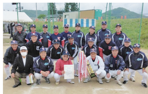
優勝した田島シニアソフトクラブの皆さん