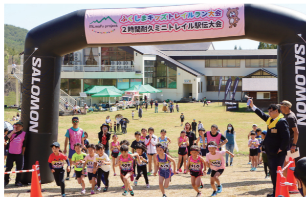
勢いよくスタート切る選手たち

5月4日、標記大会が、会津高原だいらスキー場で開催されました。この大会は福島県3地方（会津・中通り・浜通り）において、季節ごとに開催されるもので、小学生や未就学児と親子を対象として、里山を走る「トレイルランニング」の大会を開催しています。地元の子どもたちをはじめ、県外からも多くの方々が参加し、新緑が芽吹きはじめたスキー場のグレンデを駆け抜けました。