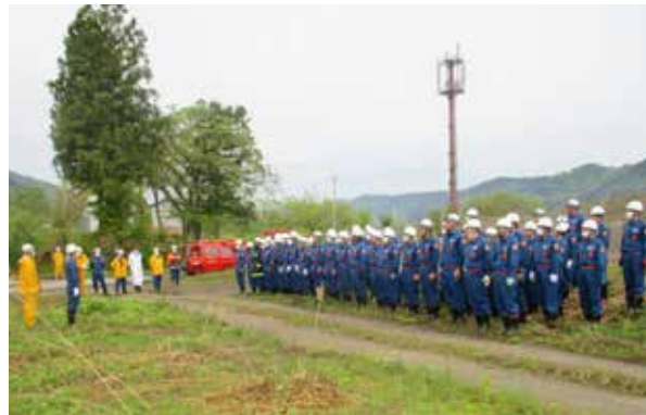
早朝より訓練に参加した団員の皆さん(和泉田区)

昼夜を問わず日々の訓練や火災予防活動に励む団員の勇姿が披露されました。これから火災が発生しやすい時期を迎えるにあたり、消防団員の規律正しい迅速な行動は、大変心強いものでした。