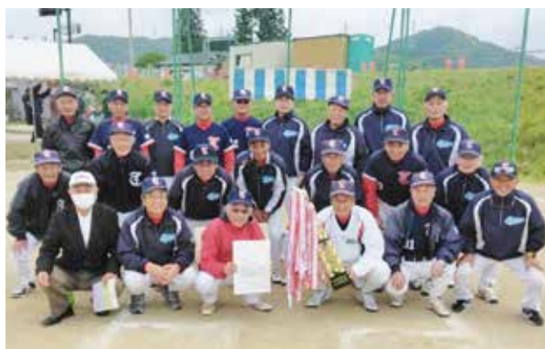
優勝した田島シニアソフトクラブの皆さん