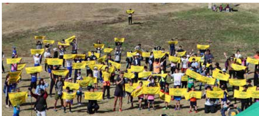
参加者による集合写真