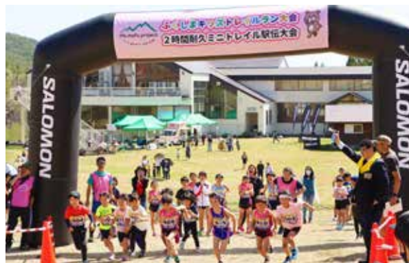
勢いよくスタート切る選手たち

5月4日、標記大会が、会津高原だいくらスキー場で開催されました。この大会は福島県3地方（会津・中通り・浜通り）において、季節ごとに開催されるもので、小学生や未就学児と親子を対象として、里山を走る「トレイルランニング」の大会を開催しています。地元の子どもたちをはじめ、県外からも多くの方々が参加し、新緑が芽吹きはじめたスキー場のゲレンデを駆け抜けました。