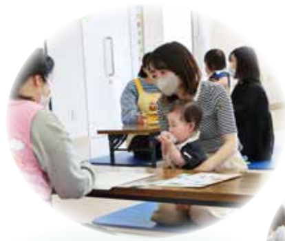
発達段階に応じた健康診査や相談も