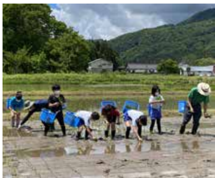
小学生による田植えの様子

◆地区の農地維持作業などの共同作業にみんなで取り組めます。 ◆野菜や木材など地元産を消費します。