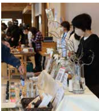
町産材を使用した商品販売