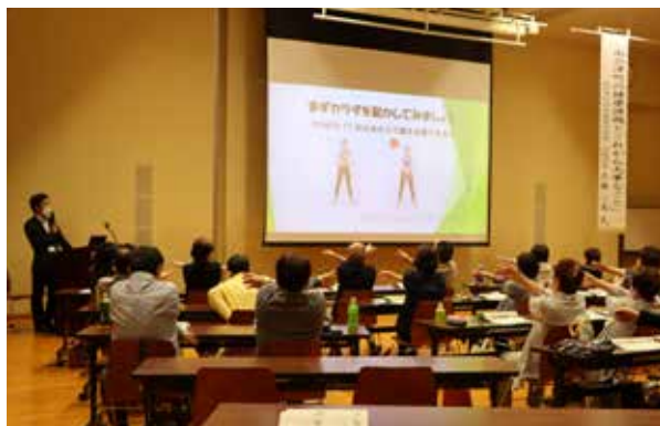
町保健師による講演の様子