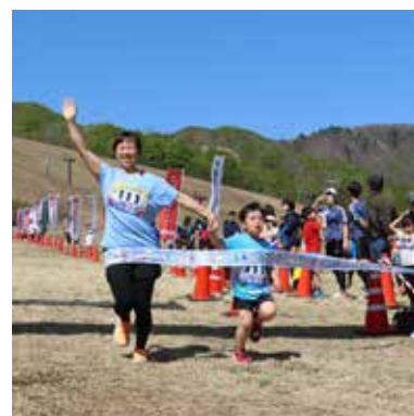
親子でフィニッシュ