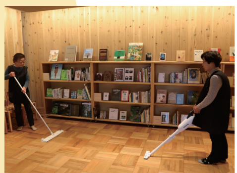
きとね等の清掃作業も

町が発注する公共施設の維持管理や清掃などの作業などもあり、町民が安心して行政サービスを利用するため「緑の下の力持ち」としての役割を果たしています。もちろん一般家庭においても、安心して仕事をお願いできる身近な存在と言えます。センターでは、年に数回研修会も行っており、会員の方々の交流の機会にもなっています。