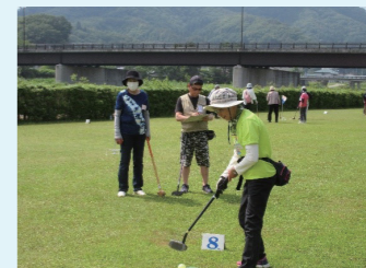
グラウンドゴルフ大会