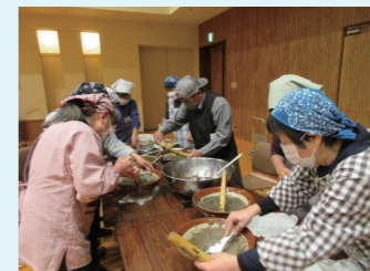
しんごろう交流会