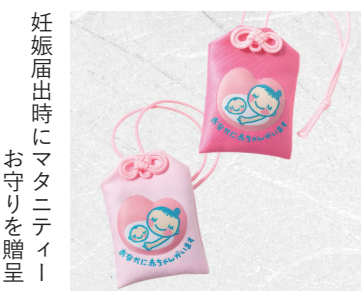
妊娠届出時にマタニティイ お守りを贈呈