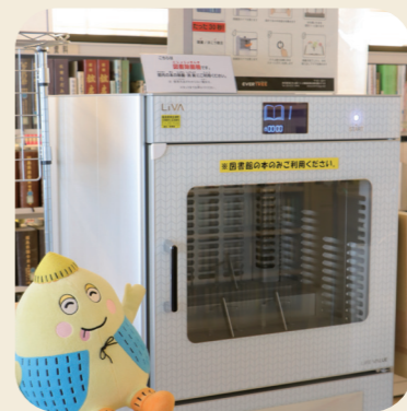
L I V A 図書消毒機

また、返却された本は、システム上で返却の処理がなされた後に、図書消毒機に入れます。紫外線による殺菌や送風によるほこり取りを行い、消臭抗菌され、清潔な状態で「本日返却された本」のコーナーに並びます。このコーナーも人気で、ほかの来館者が読んでいる本を見ることができ、面白い本に出合うきっかけの一つになっています。