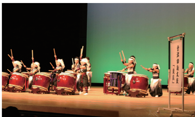
小・中学生チーム「鼓狐」の演奏