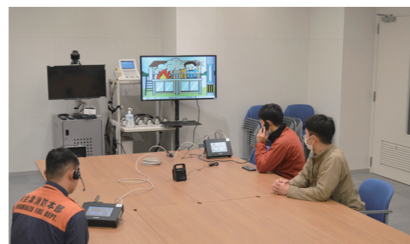
119番通報訓練装置を使用した訓練の様子

【問合せ】 南会津地方広域市町村圏組合消防本部 予防課 電話 0241-63-3117