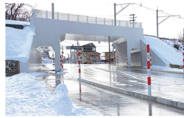
開通した鎌倉崎・松下線

12月24日、鎌倉崎・松下線が開通したことにより、国道289号田島バイパスが全線開通しました。田島バイパスは、本町中心市街地における交通混雑の解消を目的とした全体延長2.2kmのバイパス事業であり、重点的に整備が進められてきました。本道路の整備により、4車線化された田島バイパスから栃木県方面への通り抜けが可能になりました。