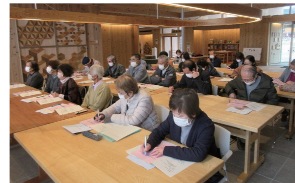
職員の講話に耳を傾ける参加者の皆さん