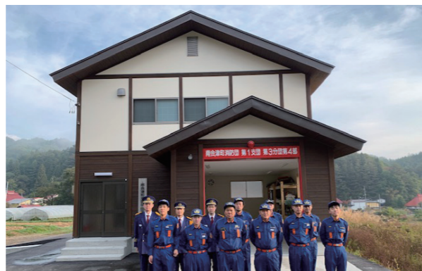
完成した屯所と消防団の皆さん

富貴沢橋の架替事業に伴い建替工事を行っていた藤生消防屯所が完成し、落成式が行われました。福島県森林環境税を活用して、土台を除いた構造材と外壁などの造作材に町産材を使用しています。建て替え前に引き続き、地域防災の拠点として防災訓練や救急講習を開催し、緊急時には地区住民の避難場所として活用されます。