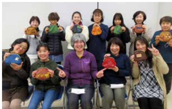
オリジナルバッグの出来に大満足！

柔らかく肌触りが良い鹿革に触れ、アイデアが次々に生まれてくる参加者の皆さん。デザイン性と実用性を兼ね備えた、すてきな作品が完成しました。