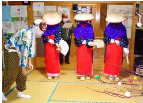
上平区・上町区早乙女踊り

上平区・上町区では1月8日、鵜巢区では1月15日に、地元の中학생や高校生が中心となり、早乙女踊りを披露しました。伝統行事を伝承してきた先輩や、今後の担い手となる後輩が、立派に務めを果たす踊り子たちを温かく見守る様子が印象的でした。