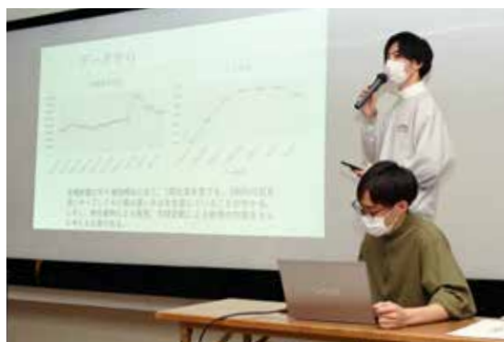
大学生（水田班）の発表 「そばと日本酒による水田農業の活性化」