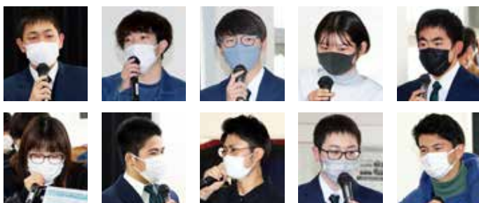
互いの成果報告を尊重しながら 積極的に意見やアドバイスを出し合う場に

1月17日、発酵食品を使用した新商品の開発や、それを活用した旅行プランの作成など「発酵ツーリズム」を探究する田島高等学校の2年生と、水田と園芸を両軸に「町の農業の未来」を探究する福島大学食農学類の学生により、1年間の活動成果を共同で報告する場が設けられました。 「発酵あんこ」や「塩麴豆腐」といった発酵食品のユニークなアイデア、農業のビジネスモデルや加工・流通に関わる考察、関係人口の増加策など、魅力ある提案が数多く示されるとともに、世代を超えた活発な意見が交わされました。