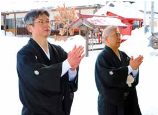
拍手を打つ音が静寂に響く