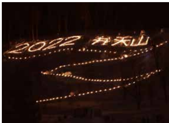
キャンドルライトの光に包まれた弁天山