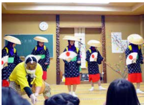
鵜巢区早乙女踊り