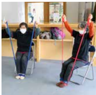
ゴム製バンドで筋肉を刺激