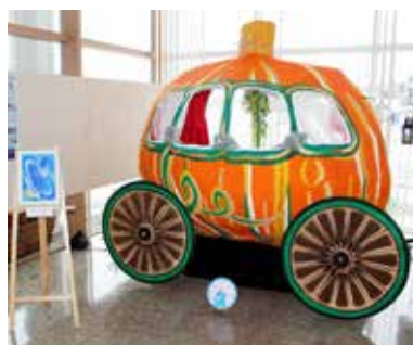
展示された「かぼちゃの馬車」に乗り、記念撮影もできます