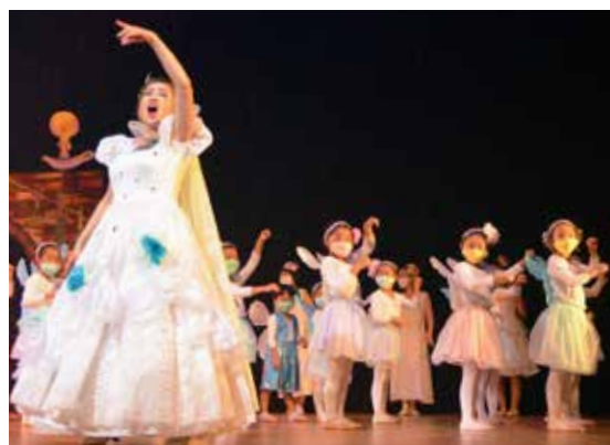
公演に華を添える「妖精」に ぶん 扮した子どもたち