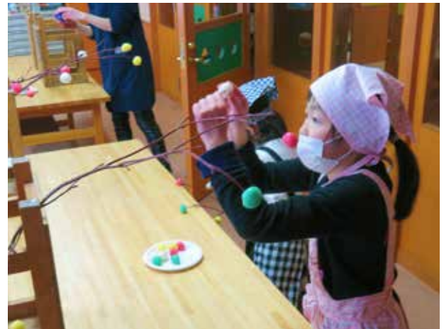
視線を指先の一点に(館岩小学校)

「だんごさし」にあたって、児童はさまざまな疑問を抱いている様子。「なぜするのか」「いつするのか」先生が正月行事の基本を教えるところから、本校の小正月は始まります。続いては、団子作りの工程へ。上新粉を練り、丸め、ゆでる...色とりどりの団子がようやく完成。かわいらしい団子一つ一つに、今年の目標や願いを込める児童の姿がありました。