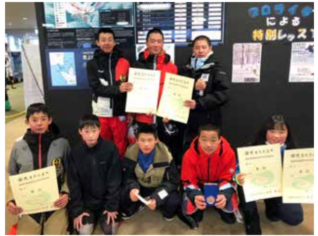
渾身の滑りを披露(田島中学校)

熱いまなざしが一点に集まる光景...いよいよ百人一首大会の幕が上がります。6人前後の縦割り班に分かれ、随所で白熱した札の奪い合いが繰り広げられた今大会。万全の準備を整えた生徒もおり、上の句が詠まれた瞬間、気付けば札が宙を舞っていることも。礼節を重んじ、古典文学に関心を持つ良い機会になりました。