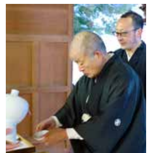
平盃を飲み干し、神事は終了