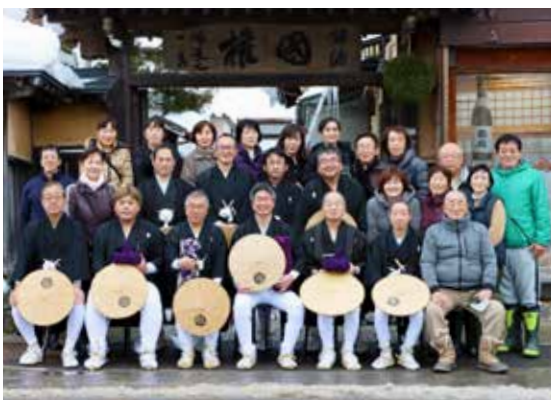
上町上側御党屋組の皆さん

昨年に引き続き、大杯回しは中止となりましたが、代わりに平盃をグイッと飲み干す男衆。祭りの大役を背負い、気を引き締めて帰路につく姿がありました。