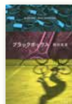
「ブラックボックス」