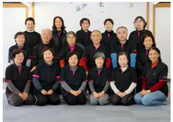
月に3回程度、楽しく生き生きと活動中