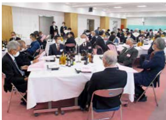
館岩・伊南・南郷地域（1月5日：南郷総合センター）

大宅町長は「『ひとが"集まる"まち』『ひとを"育む"まち』『みんなが"輝く"まち』の実現に向け、ウィズコロナの時代に即したまちづくりを進めていく」と力強くあいさつしました。