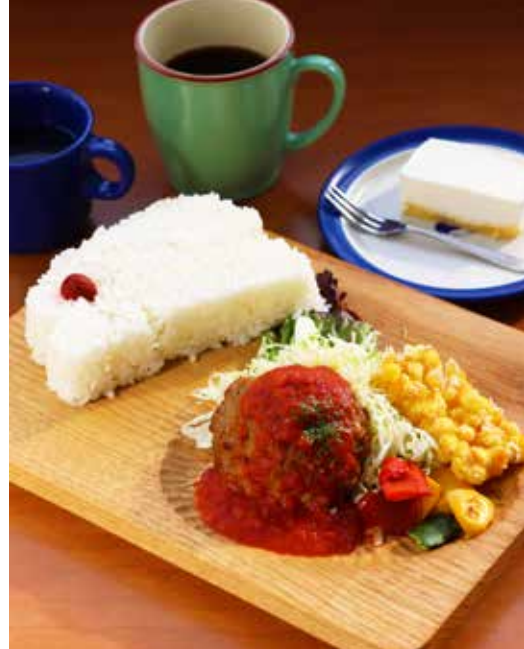
● ランチセット(平日限定) 1,000円

南郷トマトソースをかけたハンバーグに、ご飯がすすむ。スープやケーキ、コーヒーも付いたお得なセット