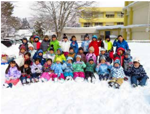
雪をも溶かすエネルギー(田島小学校)

五穀豊穡や家内安全、無病息災などを祈る「だんごさし」に、時間を忘れて没頭する1・2年生。南会津森林組合館岩支所から届けられたミズキの枝に、班ごとにこしらえた4色(白・赤・黄・緑)の団子を飾り付けていきます。小さな手で、てきぱきと作業が進められ、単色だったはずの枝に、いつしかカラフルな花々が咲き誇っていました。