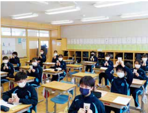
七転び八起き(南会津中学校)

北塩原村の猫魔スキー場で開催された県中体連スキー大会(アルペン競技)には、特設スキー部員の8人が出場。部員それぞれが持てる力を存分に発揮し、男子総合5位、女子総合5位、男女総合4位の好成績を残すことができました。さらに、部員3人が東北大会や全国大会への出場を決めるなど、これまでの努力が実を結んでいます。