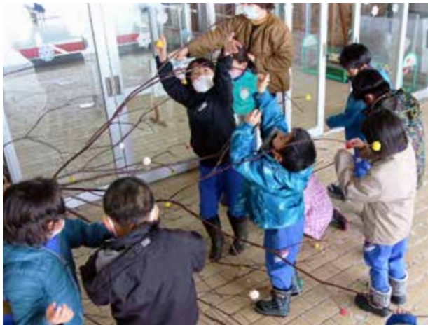
飾り付けのセンスが光る(伊南小学校)