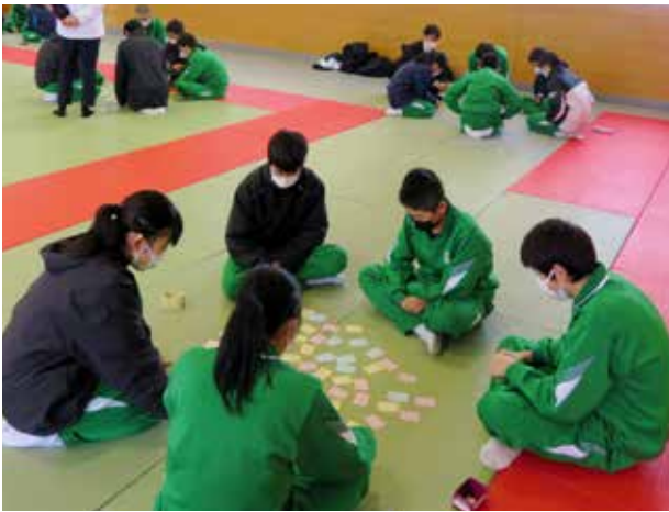
コンマ数秒の駆け引き(荒海中学校)