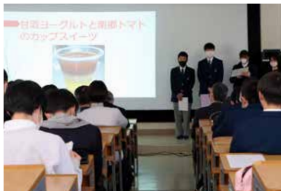
田島高等学校（D 班）の発表 「発酵を通じた健康と町おこし」