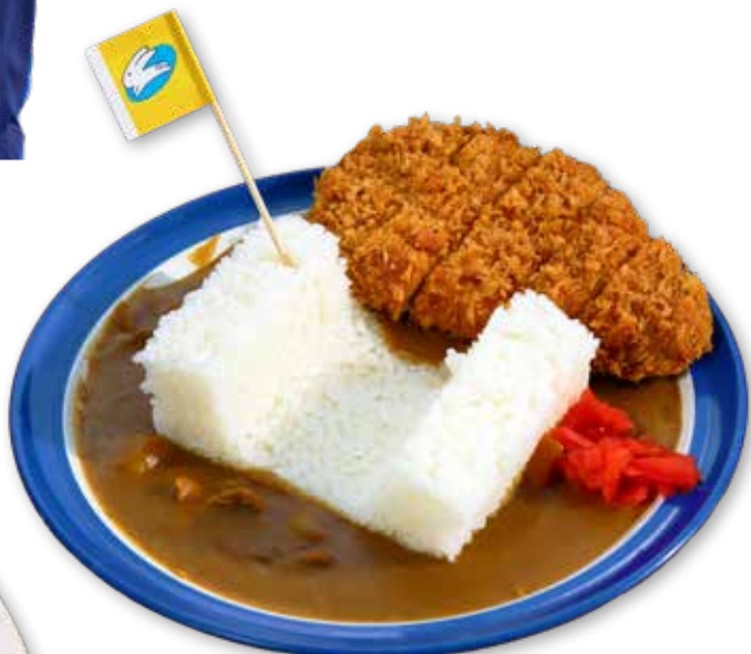
● ハーフパイプカツカレー 1,150円

南郷トマトソースをかけたハンバーグに、ご飯がすすむ。スープやケーキ、コーヒーも付いたお得なセット