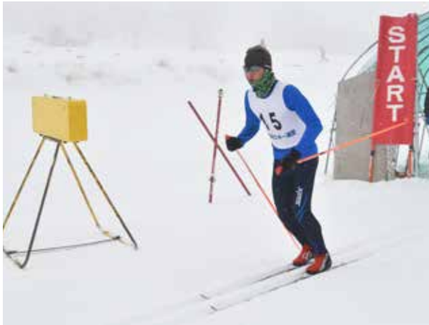
思いを背負って前へ！(南会津高等学校)