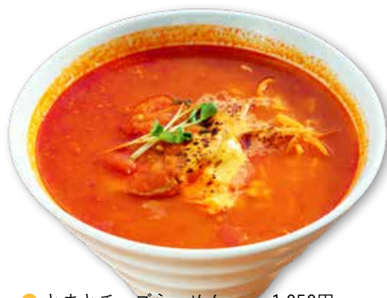
● とまとチーズらーめん 1,050円

ハーフパイプをかたどった、ボリューム満点の新メニューが登場。食べ応え抜群で、インスタ映えすること間違いなし