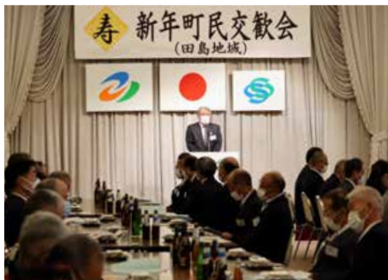
田島地域（1月4日：丸山館）