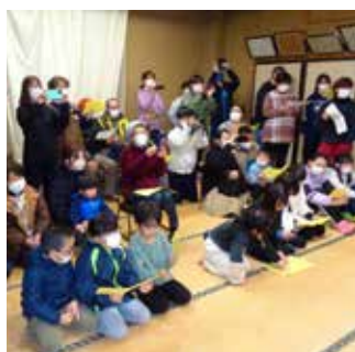
踊りを盛り上げるため、地区住民が歌い手に