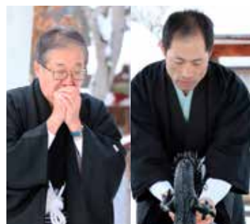
かじかむ手を何度もお清め