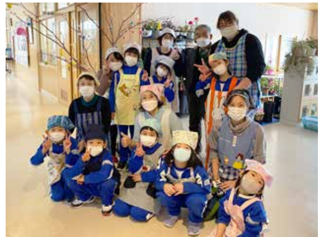
団子作りで団らんの時間(南郷小学校)

大雪に見舞われる中で始まった3学期も、1週間が経過しました。初めてのスキー教室も予定されている中、33人の1年生は、毎日を元気いっぱい過ごしています。今日は、友だちと仲良く雪遊び。児童のキラキラ輝く笑顔のおかげで、灰色の空も明るくなる気配。楽しい思い出がたくさんできました。元気な1年生を温かく見守ってください。