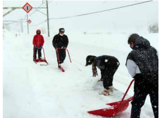
スノーダンプで奮闘(田島高等学校)

昨年の12月から、本校のスキー部は各種大会への出場で大忙し。全会津大会や県大会など3つの大会では、アルペン競技・クロカン競技ともに優秀な成績を残し、多くの選手がインターハイへの出場を決めています。スキー部後援会の皆さんからは、温かい激励金も届きました。生徒が3月まで学校を離れることは寂しい限りですが、活躍を期待しています。