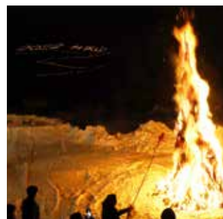
「歳の神の炎」と「みかん」 一夜に映えるオレンジ色