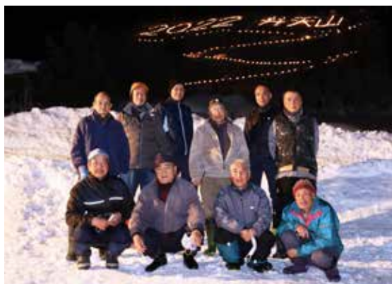
イベントを開催した横町区の皆さん

いよいよ点火の時間を迎えました。1本ずつ丁寧に設置されたキャンドルライトが、揺らめきながら、優しい光を放ちます。田島市街地からもはっきりとわかる「光の文字」が描かれ、手作りならではの温かい光は、多くの目を楽しませてくれました。