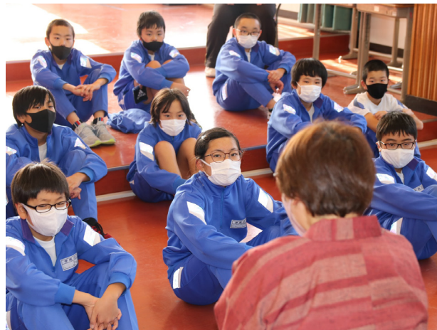
昔話の世界を訪ねて(伊南小学校)

さあ書写の時間です。静寂に包まれる中、児童が勢よく筆を走らせる音が響きます。2時間続きの授業のうち、1時間目は半紙を使い、1文字ずつ練習を積み重ねました。手に筆がなじんできた2時間目は、いよいよ書きぞめ用紙を使った練習へ。5年生は、課題「春の足音」に挑戦。児童それぞれの個性が光る、すばらしい作品が完成しました。