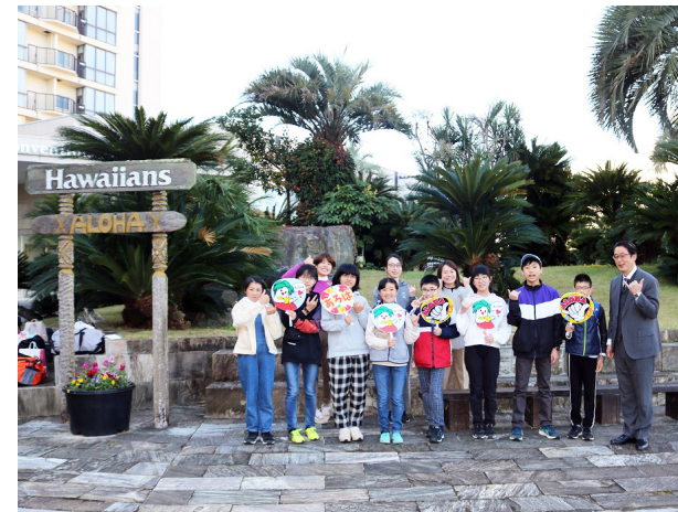
いわき市から「ALOHA!」(桧沢小学校)

本校では、伊南川昔話りの会の皆さんを講師に迎え、地域に伝わる昔話に触れる「昔語り」の時間を、年3回にわたり設けています。今回は、5・6年生を対象に開催。講師の皆さんは、児童が興味を持つ題材を選択し、伊南地域の言葉で語りかけてきます。昔話の世界に惹き込まれていくかのように、真剣に耳を傾ける児童の姿がありました。