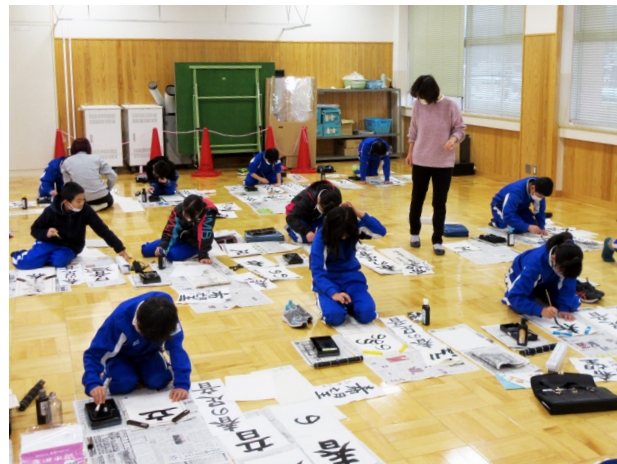
毛筆に親しむ会(南郷小学校)