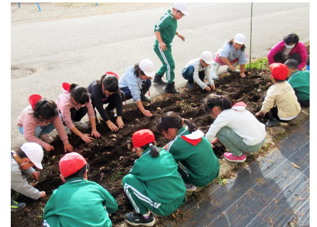
手の温もりが土に伝わる(田島第二小学校)

延期していた修学旅行に、いざ出発。初日は、あぶくま洞、石炭化石館ほるる、アクアマリンふくしま、スパリゾート・ハワイアンズへ。翌日は、県立博物館、七日町散策など、濃密な行程を満喫した6年生。スパリゾートの流れるプールやウォーター 슬라이ダーを体験し、大きな歓声を上げるなど、仲間たちと楽しく過ごせた様子。小学校最高の思い出ができました。