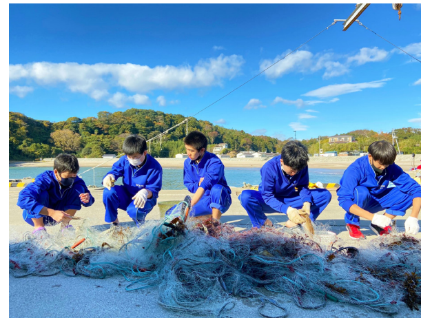
複雑に絡む漁網と格闘(館岩中学校)