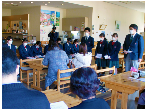
発酵の多様性に驚き！(田島高等学校)