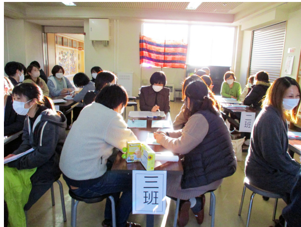
心を通わせる時間(荒海小学校)