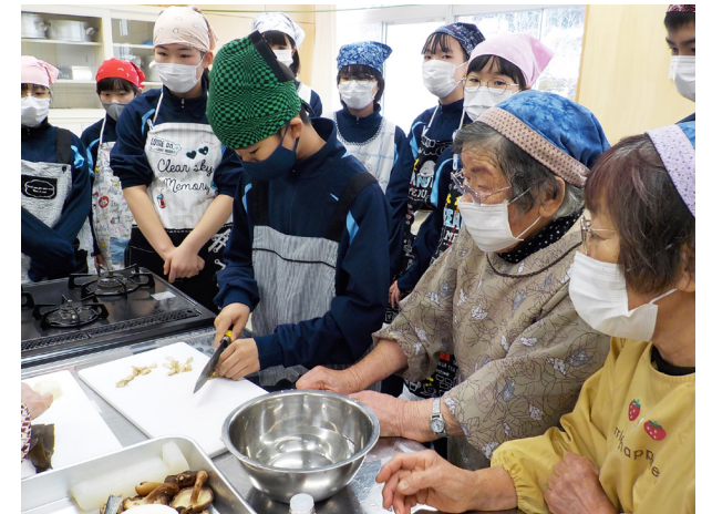
郷土の伝統に舌鼓を打つ(南会津中学校)

本校の三大大行事の1つ「 でんちゅうはい 田中杯」を開催しました。競技種目は、ソフトバレーボール。学友会に所属する生徒たちが話し合いを重ね、企画・運営を担う大役を果たしてくれました。どのクラスも、楽しみながら懸命にプレーし、応援にも熱がこもります。今年も大きく盛り上がった田中杯。さらに一步、クラスの団結力が高まったようです。