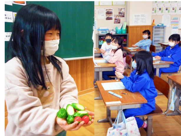
野菜の量足りていますか?(田島小学校)

授業参観に合わせ、南会津教育事務所による講話や、グループディスカッションを企画。「家庭学習」について、保護者の皆さんと考えました。子育てと同じく、家庭学習の在り方に悩みはつきもの。各家庭での悩みを共有・共感しながら、保護者と学校が協力することで、学びを深める環境を作り上げていくことを確認しました。