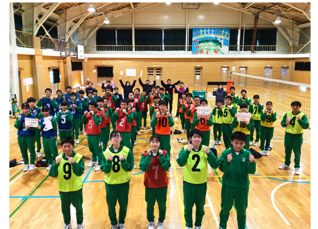
荒中ポーズで心もあったか!(荒海中学校)

本校では、3年生が修学旅行で仙台・東松島方面を、1・2年生が学習旅行で会津若松市を、それぞれ訪問しました。修学旅行では、震災後に学校施設をリノベーションした宿泊施設KIBOTCHAへ宿泊し、海の幸を存分に堪能。学習旅行では、会津の歴史名所を巡り、伝統工芸にも挑戦しました。かけがえのない思い出をお土産に、笑顔で帰校しました。