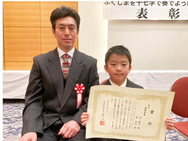
親子の絆を文字に起こす(館岩小学校)