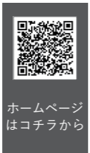
ホームページはコチラから

【問合せ】 住民生活課 戸籍住民係 電話 0241-62-6120 館岩総合支所 町民課 住民係 電話 0241-78-3320 伊南総合支所 町民課 住民係 電話 0241-76-7711 南郷総合支所 町民課 住民係 電話 0241-72-2111