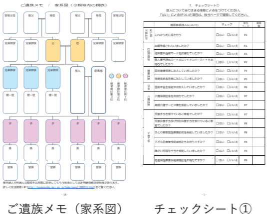
ご遺族メモ(家系図)