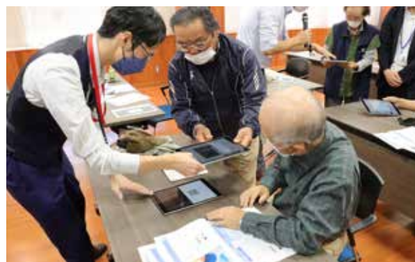
参加者で協力し合い学ぶ様子

町では65歳以上の方を対象に各地域で、スマホ・タブレット教室開催しています。電源の入れ方から始まり、基本操作やインターネット検索、LINEの使用方法について、参加者に寄り添いながら説明。参加者からは「便利で驚いた」といった声が寄せられました。今後も、様々な部分でデジタル化が進む一方、デジタル機器を身近に感じていただけるよう支援していきます。