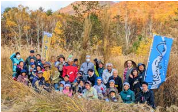
ワークショップに参加された皆さん