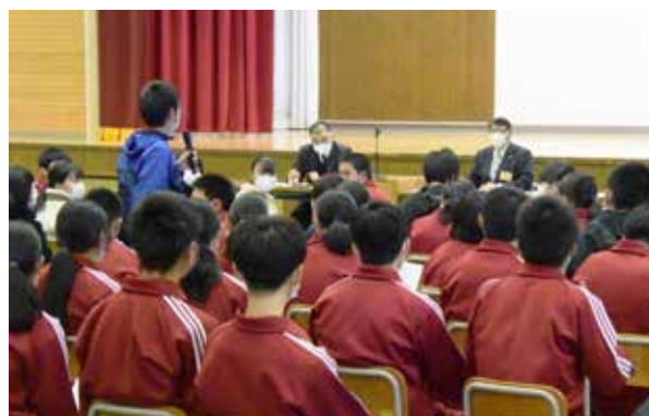
町に対する様々な意見があげられました

今回、生徒の皆様から頂いた意見は、これまで頂いていた大人の方の意見と重なる部分もあることながら、日頃の学校生活を通した中学生ならではの意見の中には、行政として気づかない身近な課題の提言もあり、今後の施策に活かされていくこととなります。