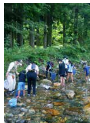
自然体験学習の様子

この分野では、森林の生産基盤整備に努めるとともに、地球温暖化防止のための森林整備を進め、自然との共生と森林利用による経済性を確保していきます。環境指標の評価では、ボイラー設備導入にあたって燃料チップの安定供給体制など需給バランスが課題であり、長期計画の基、企業や事業所等と協議・検討を進めていきます。また、自然資源である森の大切さ、森と環境の関心を広めるため各団体と連携し、特に子どもを対象とした体験学習等を推進していきます。