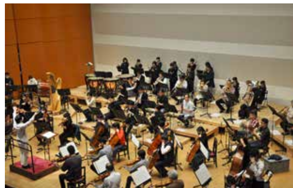
山形交響楽団と生徒たちの共演