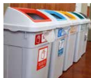
ごみの分別にご協力ください