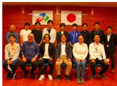
第1回モニターツアー