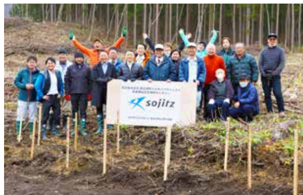
セレモニーに参加した皆さん

今年度は、5,000本を植栽し年々植栽本数を増やす計画で、日本特有の芳香精油として新たな商品化を目指します。