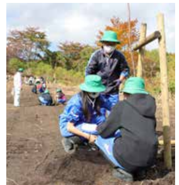
みどりの少年団も活躍