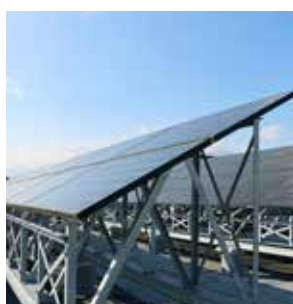
町役場本庁舎太陽光パネル

この分野では、木質バイオマスなどの地域の特性を活かした再生可能エネルギーの導入と、温室効果ガス排出量削減を目指し、地球温暖化防止対策を進めていきます。環境指標の評価では、再生可能エネルギー利用設備数がこのままでは目標に達しませんが、ビジョン1の「森林整備を進め、森林資源の有効活用を図ります」とあわせて、長期的計画の基、施設導入の検討を進めていきます。