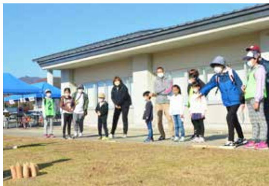
様々なスポーツの体験コーナーが

11月12日、標記イベントを秋晴れのもと田島地内を中心に開催しました。今回の競技は「スポーツロゲイニング」で、チームを組んでマップに表示されたチェックポイントを制限時間以内に、いかに多く回るかを競うスポーツです。参加者の皆さんは競技マップをもとに作戦を立て、スポーツ体験コーナーやフォトスポットを回り、ゴールを目指し汗を流しました。