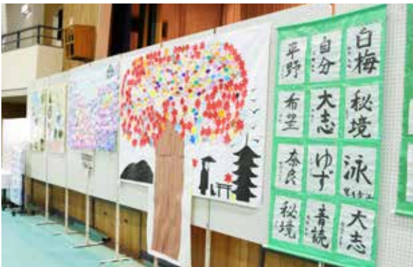
田島体育館での作品展の様子