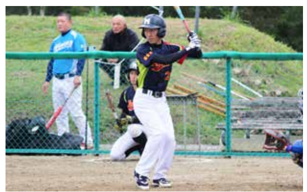
攻守で活躍を見せた聖星選手