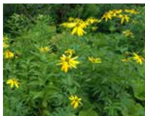
特定外来植物 オオハンゴウソウ

この分野では、国指定天然記念物である駒止湿原や尾瀬国立公園田代山湿原などの自然資源を保護し、後世に継承していきます。環境指標の評価では、田代山の山腹崩落規模が拡大し、国や県に対し対応を要望、林野庁で方針を検討していますが、急斜面が広範囲に亘るため修復には長期になる見込みです。今後も抜本的な対策を講じるよう強く働きかけを行っていくと共に、河川への影響、湿原の木道も含め状況の把握と対策を国及び県と協議していきます。