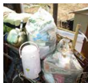
ごみ出しルールを守りましょう