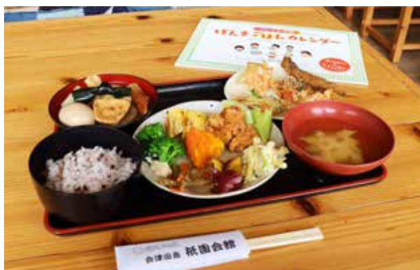
約20種類が食べ放題のランチバイキング