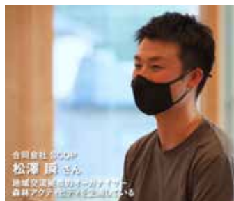
ヒアリングムービーはコチラ▶

その結果、多くの事業者から山林を軸として産業や文化が発展してきたことが、南会津町独自のポイントではないかという共感を得ました。そこで、この事業の大テーマを「山林と人との共存共栄」と設定しました。