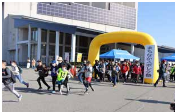
勢いよくスタートする参加者の皆さん