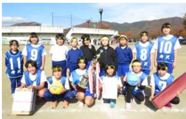
優勝した「HISAWA」のみなさん