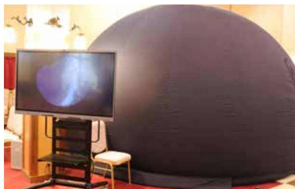
ドーム型プラネタリウム