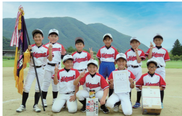
優勝した本町・会下・後原・上中町・折橋チーム

地区子供会によるチーム編成となるため、上級生を中心に声を掛け合い、チーム一丸となって臨む姿が見られ、白熱した試合となりました。