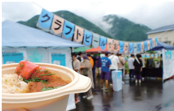
スパイスの効いたカレーが最高!