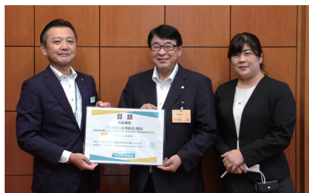
左から手塚営業所長、渡部町長、猪股さん