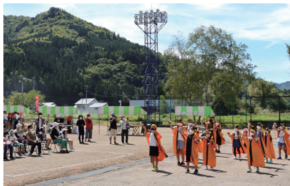
伊南小学校児童によるよさこいの発表