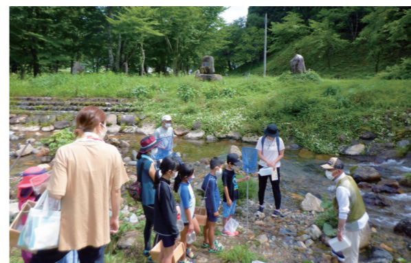
ヘビトンボやオニヤンマ、カジカの生息を確認