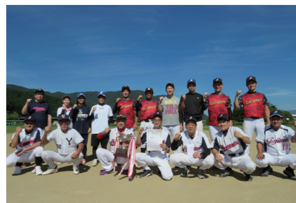
優勝した東横チームの皆さん