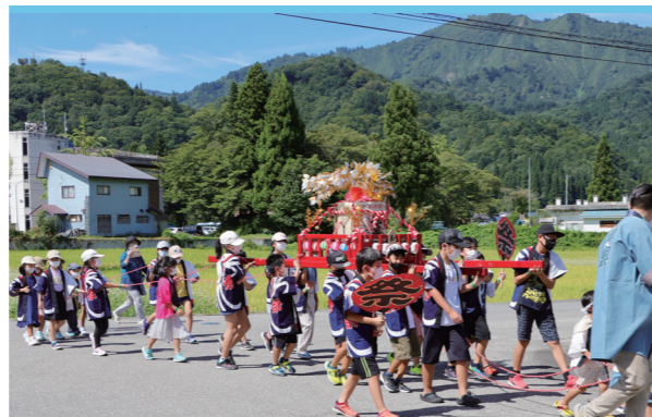
子ども神輿が町内を練り歩く

開催にあたり、規模の縮小や感染対策を徹底し、今までになかったミニゲームや、子どもたちの発表会も行われ、地域の子どもの笑顔が随所に見られるお祭りとなりました。