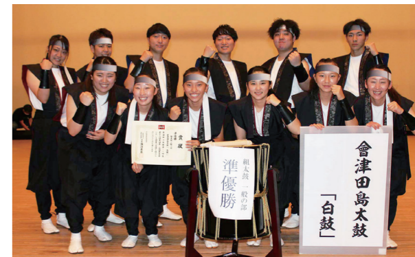
準優勝を果たした「白鼓」の皆さん