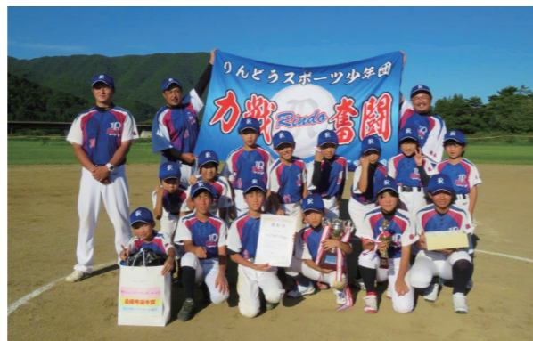
熱戦を制したりんどうスポーツ少年団の皆さん