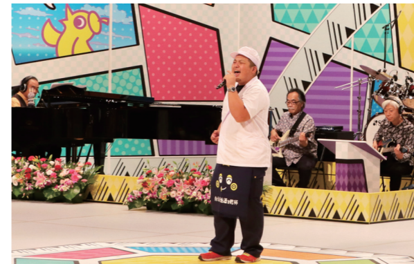
熱唱を全国へ届けた参加者の方々