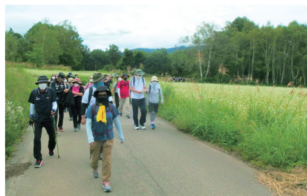
見ごろになったそば畑を