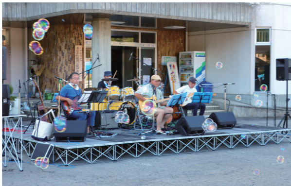
ライブ演奏に子どもたちのシャボン玉が花を添える