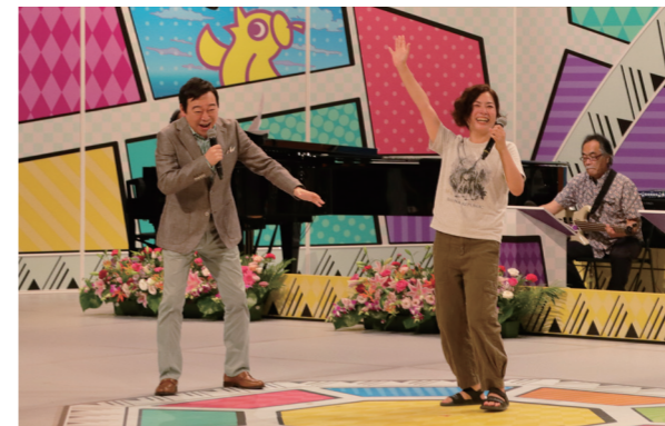
合格の鐘が鳴り喜びがあふれる

8月28日、「クラフトビールでおつかれー Summer!」が、きとねで開催されました。今年は、クラフトビールが2店舗、カレーが4店舗の出店があり、ほかにもおつまみや、かき氷、ワークショップやローダーで作成したプールなど遊びの場も充実していました。当日はあいにくの雨模様でしたが、夏の終わりを感しながら思い思いにイベントを楽しんでいる様子でした。