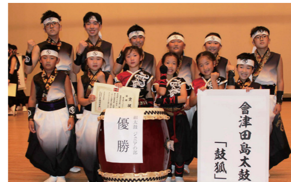
優勝を果たした「鼓狐」の皆さん