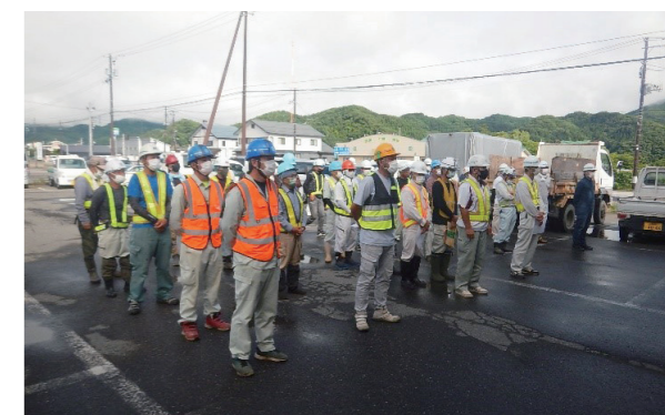
美化作業に臨む事業者のみなさん(田島地域)

本町では、8月5日に、県建設業協会田島支部、同山口支部、町建設協議会などが美化作業を実施。国道289号、400号、県道黒磯田島線、町道中山線などの、町内主要道路の美化作業に汗を流しました。