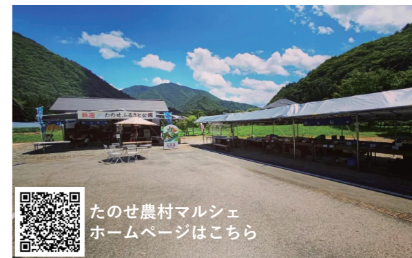
たのせ農村マルシェ ホームページはこちら

7月30日、2回のプレオープンを経て、たのせの農村マルシェがオープンしました。採れたての野菜を使ったピザや、コーヒー、トマトフラッペなどのドリンクを提供しているカフェに加え、郷土料理や採れたて野菜を販売しています。集落直営で10月下旬までの毎週土日営業しています。素敵な景色と、地元食材を使ったフードとドリンクで贅沢な時間を過ごしてみるのはいかがですか。