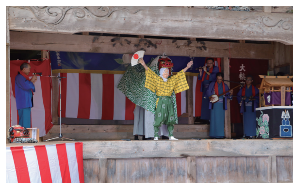
小塩芸能保存会による小塩の神楽