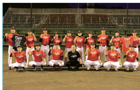
ベスト8以上を目指して!

10月9日の初戦では、相馬光陽ソフトボール場(相馬市)で埴町と対戦。試合では、多くの方々の協賛や応援に感謝し、泥臭くプレーしますので、声援よろしくをお願いします。