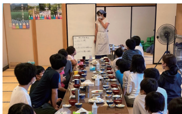
南会津の郷土料理に舌鼓