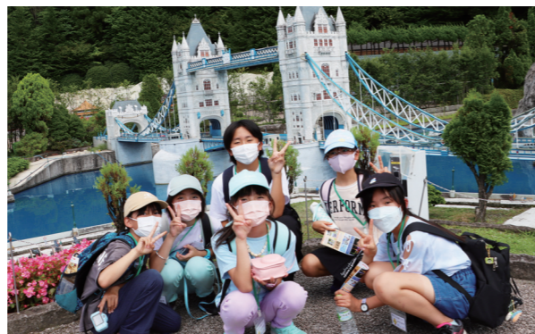
精巧に再現された建造物に感動

東武特急リパティを利用して、日光市にある「東武ワールドスクウェア」と「とりっくあーとぴあ日光」を訪れました。天候に恵まれ、学校で習った世界遺産に触れたり、目の錯覚を利用した面白アートを体験したりと、暑さにも負けず楽しむ様子が見られました。