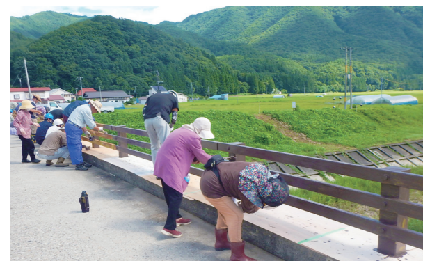
塗装作業に汗を流す参加者