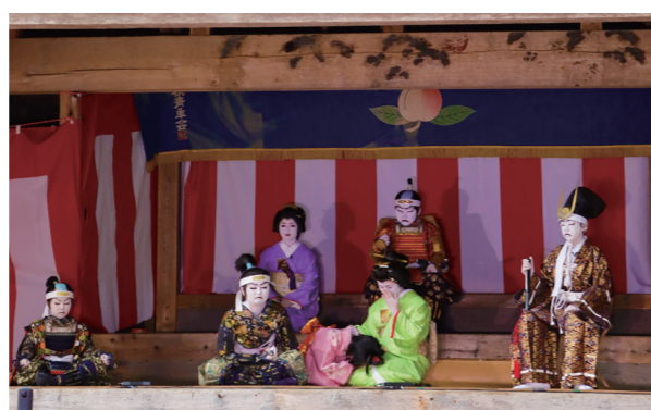
田島祇園祭屋台歌舞伎

8月7日、郷土芸能を披露する「大桃夢舞台」が、大桃地区の国指定重要有形民俗文化財「大桃の舞台」で開催されました。新型コロナウイルスの感染予防のため会場は入場制限を行い、YouTubeでの配信を行いました。小塩芸能保存会による小塩の神楽、南会津高校郷土芸能委員会による早乙女踊り、田島祇園祭屋台歌舞伎がそれぞれ上演され、情緒あふれる素晴らしい舞台となりました。