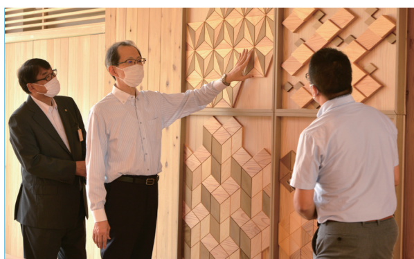
施設の説明を受ける内堀知事