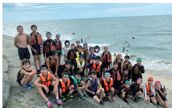
町内の5・6年生31人が参加

今年も、感染予防対策を徹底し、町内の小学5・6年生を対象に、8月2日から2泊3日の日程で、新潟県少年自然の家(胎内市)で宿泊研修会を行いました。緊張と不安いっぱいだった研修会でしたが、野外炊さんでは協力しあい、海水浴やカヌー体験などの活動を通して子供たち同士の絆が深まり、学校の枠を超えた仲間も増え楽しい夏休みの思い出になりました。