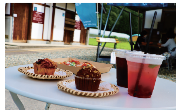
時期に合わせたメニューが絶品