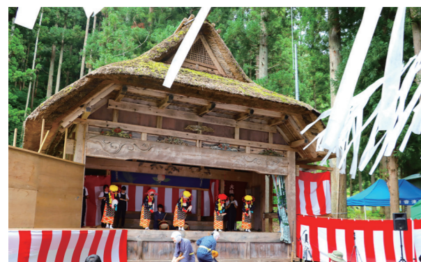
南会津高校郷土芸能委員会による早乙女踊り