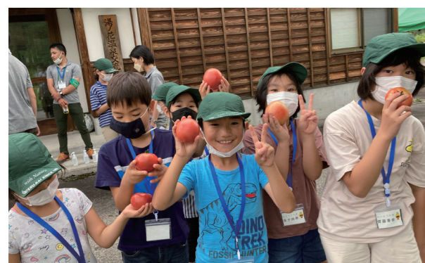
おやつは南郷トマトを丸かじり