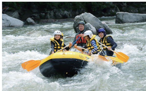
みんなで力を合わせたラフティング体験

7月26日からの6日間、館岩地域にて夏休み短期山村留学を実施し、関東地方などから小学生18人を受け入れました。感染症対策を徹底した上で、山や川での自然体験や、農作業、ホームステイなどを通じた交流体験が行われました。参加者からは、「もっと滞在したかった、また来たい」などの感想がありました。町では、今後通年での留学生の受け入れを検討していく方針です。