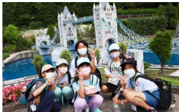
精巧に再現された建造物に感動

東武特急リバティを利用して、日光市にある「東武ワールドスクウェア」と「とりっくあーとびあ日光」を訪れました。天候に恵まれ、学校で習った世界遺産に触れたり、目の錯覚を利用した面白アートを体験したりと、暑さにも負けず楽しむ様子が見られました。