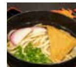
きつねうどん1人前 塩分5.3g