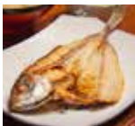
あじの開き1枚(60g) 塩分1.2g