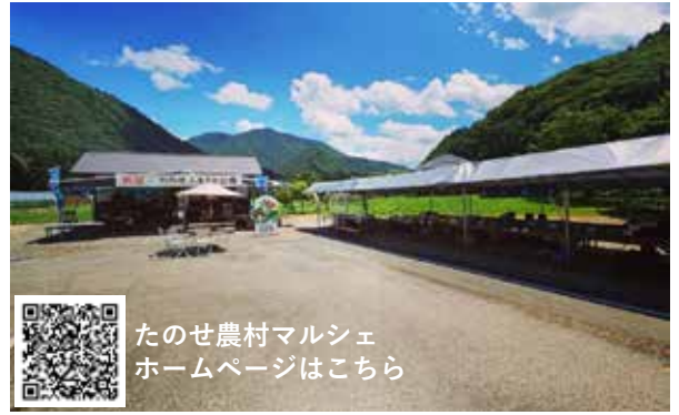
たのせふるさと公園で開催

7月30日、2回のプレオープンを経て、たのせの農村マルシェがオープンしました。採れたての野菜を使ったピザや、コーヒー、トマトフラッペなどのドリンクを提供しているカフェに加え、郷土料理や採れたて野菜を販売しています。集落直営で10月下旬までの毎週土日営業しています。素敵な景色と、地元食材を使ったフードとドリンクで贅沢な時間を過ごしてみるのはいかがでしょうか。