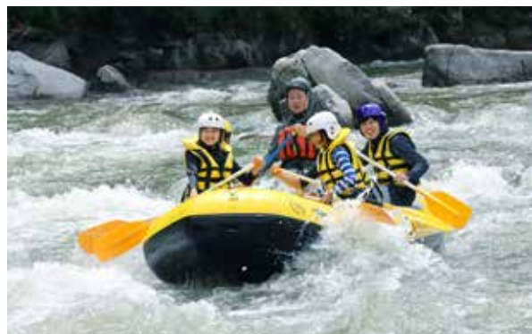
みんなで力を合わせたラフティング体験

7月26日からの6日間、館岩地域にて夏休み短期山村留学を実施し、関東地方などから小学生18人を受け入れました。感染症対策を徹底した上で、山や川での自然体験や、農作業、ホームステイなどを通じた交流体験が行われました。参加者からは、「もっと滞在したかった、また来たい」などの感想がありました。町では、今後通年での留学生の受け入れを検討していく方針です。