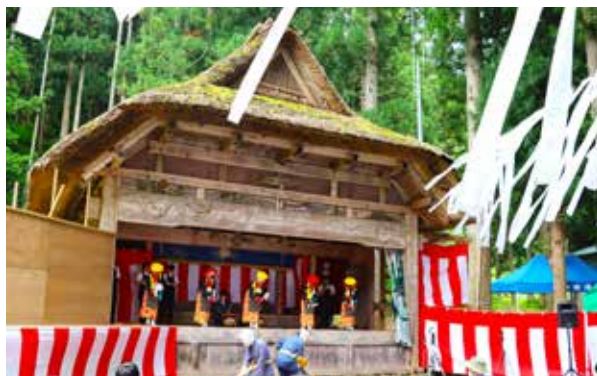
南会津高校郷土芸能委員会による早乙女踊り