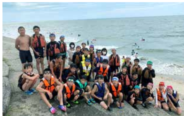
町内の5・6年生31人が参加

今年も、感染予防対策を徹底し、町内の小学5・6年生を対象に、8月2日から2泊3日の日程で、新潟県少年自然の家(胎内市)で宿泊研修会を行いました。緊張と不安いっぱいではまった研修会でしたが、野外炊さんでは協力しあい、海水浴やカヌー体験などの活動を通して子供たち同士の絆が深まり、学校の枠を超えた仲間も増え楽しい夏休みの思い出になりました。