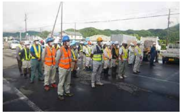
美化作業に臨む事業者のみなさん(田島地域)

本町では、8月5日に、県建設業協会田島支部、同山口支部、町建設協議会などが美化作業を実施。国道289号、400号、県道黒磯田島線、町道中山線などの、町内主要道路の美化作業に汗を流しました。