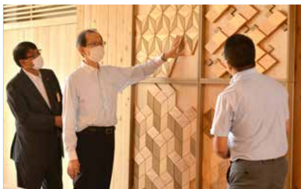
施設の説明を受ける内堀知事㊦