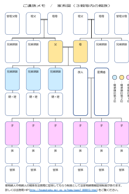
ご遺族メモ（家系図）