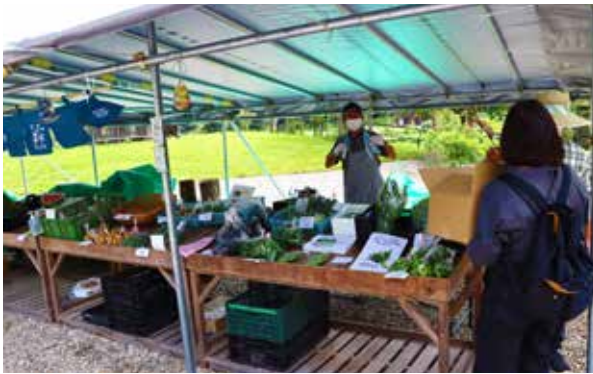
ヤマメの塩焼きや採れたて野菜も！