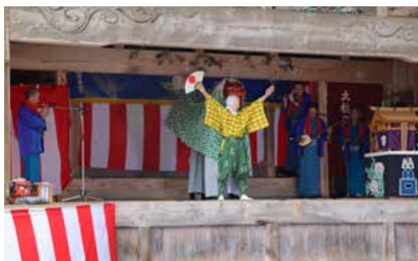
小塩芸能保存会による小塩の神楽

8月7日、郷土芸能を披露する「大桃夢舞台」が、大桃地区の国指定重要有形民俗文化財「大桃の舞台」で開催されました。新型コロナウイルスの感染予防のため会場は入場制限を行い、YouTubeでの配信を行いました。小塩芸能保存会による小塩の神楽、南会津高校郷土芸能委員会による早乙女踊り、田島祇園祭屋台歌舞伎がそれぞれ上演され、情緒あふれる素晴らしい舞台となりました。