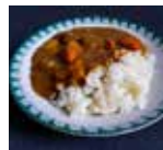
カレーライス1人前 塩分3.3g