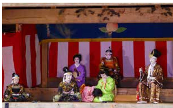
田島祇園祭屋台歌舞伎