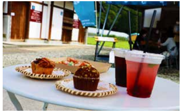
時期に合わせたメニューが絶品