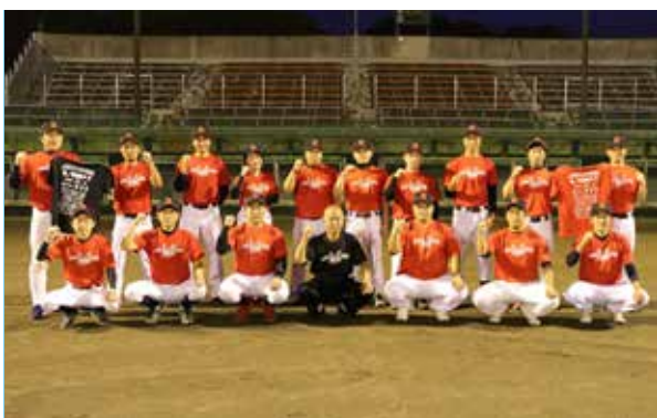
ベスト8以上を目指して!

10月9日の初戦では、相馬光陽ソフトボール場(相馬市)で塙町と対戦。試合では、多くの方々の協賛や応援に感謝し、泥臭くプレーしますので、声援よろしくお願いします。