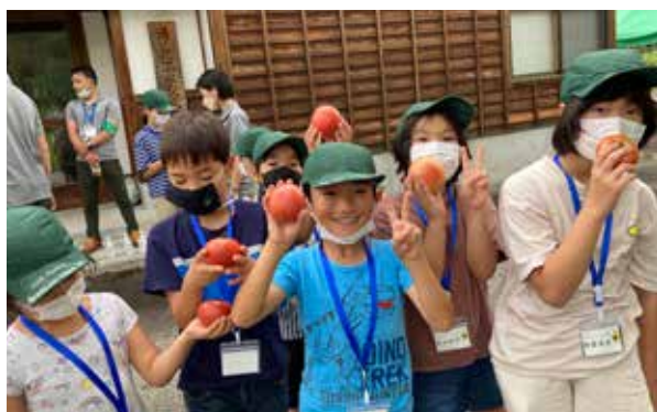
おやつは南郷トマトを丸かじり