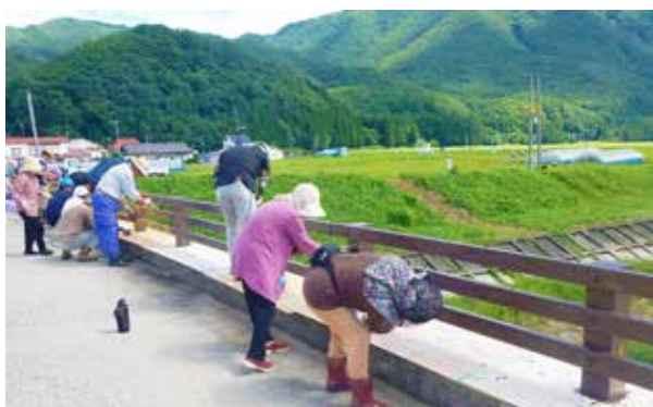
塗装作業に汗を流す参加者