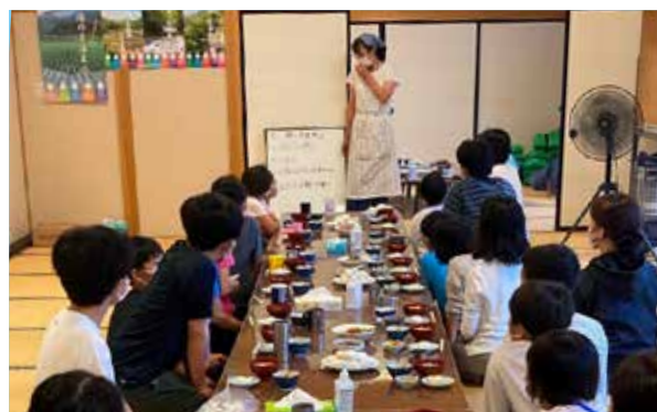
南会津の郷土料理に舌鼓