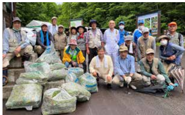
外来植物の駆除に参加した皆さん

東北電力ネットワーク(株) 田島電力センターのボランティア2人含め18人が参加しました。除去はおよそ2キロの農道を中心に行い、町ゴミ袋16袋分を除去しました。