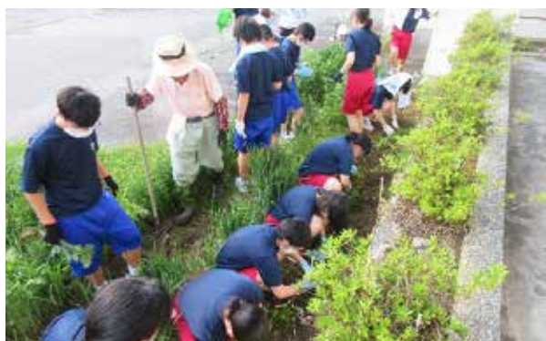
暑い中作業をする総合文化部の生徒さん