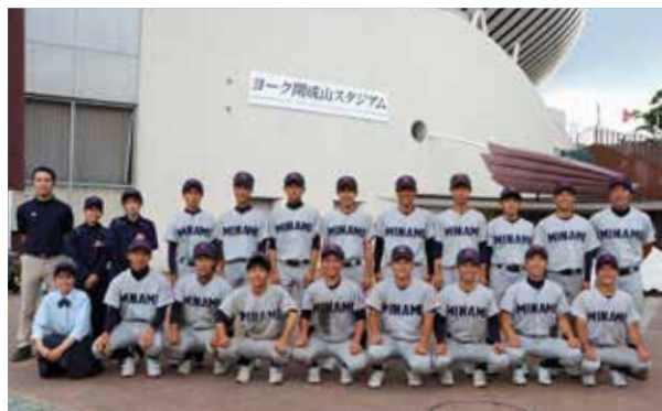
すがすがしい表情での集合写真