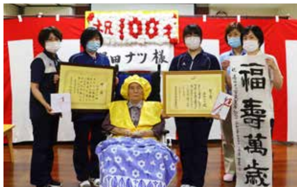
職員に方々に囲まれ撮影に応じるナツさん㊦

お子さんが3人、お孫さんが3人いらっしゃる、長寿の秘訣は、「人の悪口を言わないこと、周囲に感謝を伝えること」だそうです。健康を維持し、これからも長生きしてください。