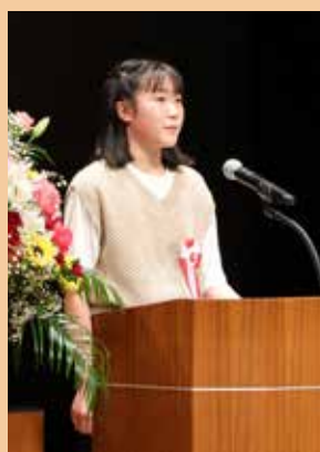
自分の思いを堂々と伝える発表者の姿