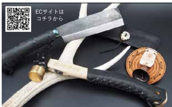
ハンマーやナタのグリップ等を商品化