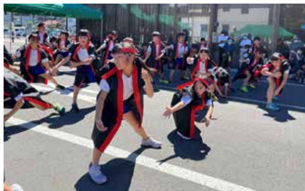
田島小学校4年生のよさこい演舞

7月2日、南会津町商業振興協同組合とまちなか楽座の主催で「GO TO! テイクアウト 七夕まつり」が開催されました。会場には、田島地域内の園児らの願い事が七夕飾りに綴られていました。ステージでは、バルーンショーや地元園児の太鼓、田島小学校のよさこい演舞などが披露されました。キッチンカーや、地元商店の出店もあり、祭りを楽しむ人で賑わいました。