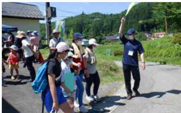
高野地区の皆さんご協力のもと開催