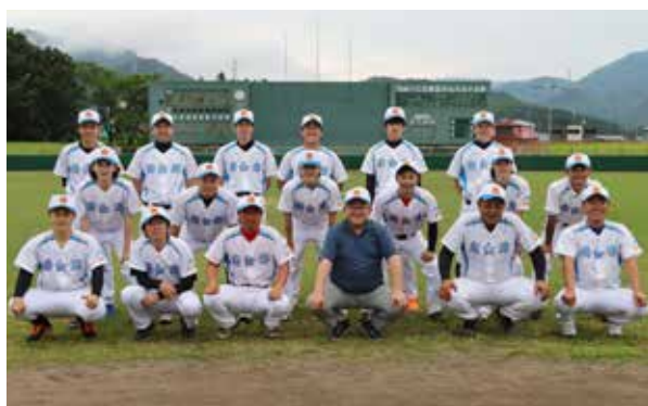
市町村野球チームのメンバー

今年のチームは1月から自主練習を行い、バットを振り込んできました。その成果として打線の調子がよく、切れ目のない打線となり、若さあふれる仲の良いチームです。一丸となって試合に臨みベストを尽くしますので、応援よろしくお願いします。