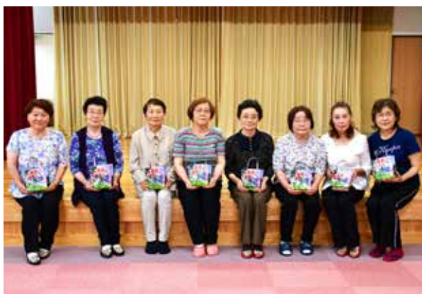
作成にご協力くださった皆さん