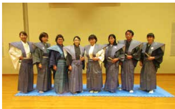
美しく袴を着こなす参加者の皆さん