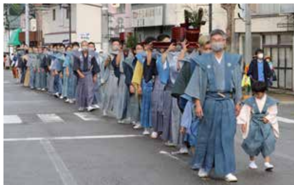
男衆のみで行われた七行器行列

また、田島保育園の園児による奉納太鼓の演奏や、田島祇園祭屋台歌舞伎保存会による子供歌舞伎の上演が行われました。