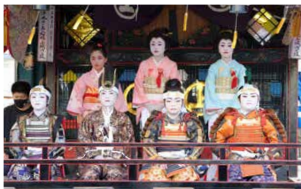
上屋台で堂々と演じた子どもたち