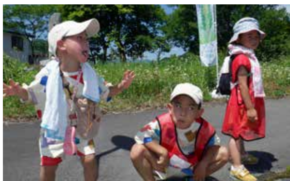
多くの子どもたちが参加

6月25日、NPO法人ひのきスポーツクラブでは、コロナ禍にあっても安全に安心して楽しめる、ウォークラリー大会を開催しました。町内から42名の参加者が集まり、初夏の田園や歴史ある名所を巡るコースに、地域の魅力を感じながら楽しそうに散策されていました。コース内では、クイズをしたり、アトラクションゲームをしたりと、歩くだけではない楽しみに子供から高齢者まで大いに賑わいました。