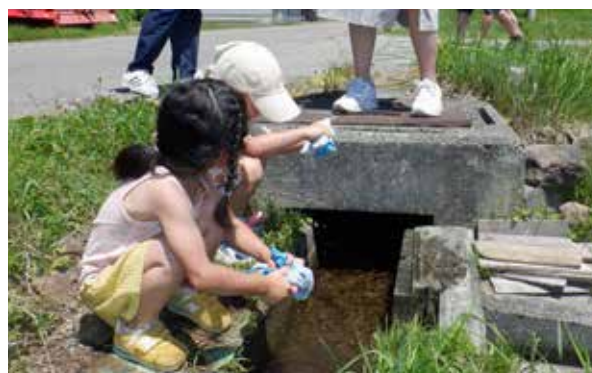
汗をかいたら水遊び