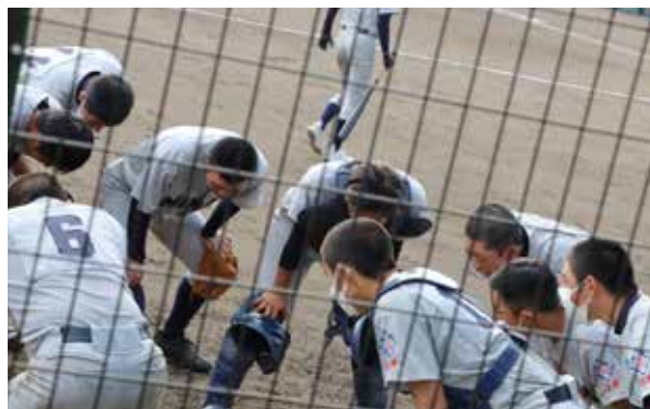
お互いを鼓舞し最後まで諦めずにプレー