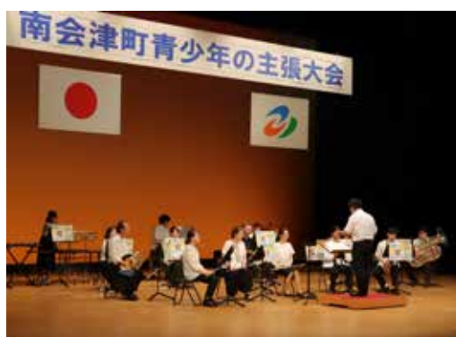
田島吹奏楽団による演奏

令和4年度南会津町青少年の主張大会を7月3日、御蔵入交流館文化ホールで開催しました。 町内の小・中・高校から計207名の応募があり、学校推薦による19人が発表会に出場しました。 出場した19人の主張の題名をここで紹介するとともに、小学生、中学生、高校生・青年の各部門で最優秀賞に輝いた3つの主張を、原文のまま掲載します。 また、幕間には「田島吹奏楽団」による演奏が披露されました。 公の場で演奏するのは、約2年半ぶりのことでしたが、心躍る演奏に来場者からは、盛大な拍手が巻き起こりました。