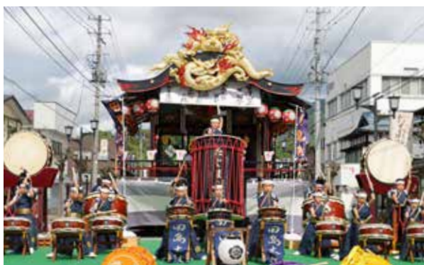
オリジナル楽曲を力強く演奏