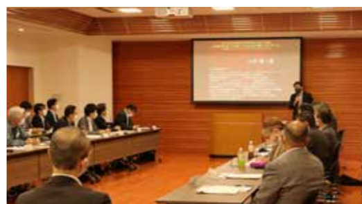
懇談会での講演の様子

向けセミナーを2回開催し、現在までの取組や成果の共有、3市町の事業者同士の交流や情報交換を行うほか、町民の方により八十里越を知ってもらうために、八十里越道路の工事見学ツアーなどを開催予定です。詳細が決定しましたら、改めてお知らせしていきますので、ぜひご参加ください。