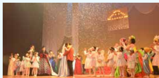
昨年開催された手作り舞台公演

南会津町文化ホール運営委員会では、コンサート等、様々な自主公演の企画・運営を行っています。多くの若い世代の方にも南会津町文化ホールにお越しいただくため、若者向け企画をいっしょに考えていただけるメンバーを募集します。 【応募資格】 町内にお住まいの15歳から18歳の方(平成16年4月2日から平成19年4月1日生まれの方)