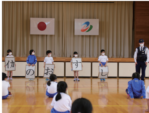
いざという時のために(伊南小学校)

雨天のため1日順延となりましたが、5月15日(日)青空の下運動会を開催することができました。6年生が考えた今年のテーマは「勇気りんりんフルパワー!」。全力で競技に挑む子。真剣なまなざしで鼓笛演奏に取り組む子。頑張る友達へ全開の声で応援する子。みんな一人ひとりがフルパワーで取り組んだ運動会でした。