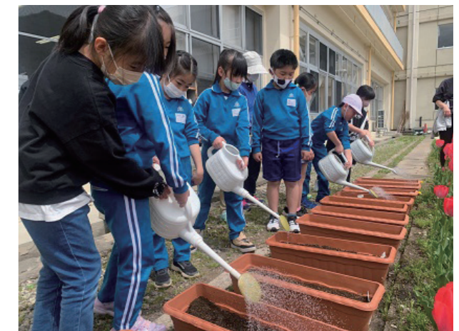
芽吹きを心待ちに(荒海小学校)

保健体育委員会から「デンタルスローガン」について提案があり、全校児童と全教職員から作品を募集し、その後投票により優秀作品を決定します。早速、むし歯予防について家族に聞いたり、本で調べたりする姿が見られるようになってきました。歯科保健に対する意識が高まり、子どもたちが健康なお口で、一生快適な生活を送れることを願っています。