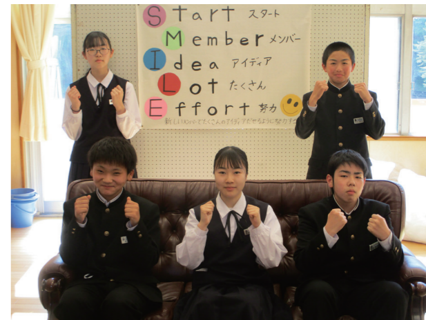
笑顔に溢れる学校へ(荒海中学校)

陽光が差し、春の訪れを感じるなか、館岩中毎年恒例の野外炊飯を行いました。定番の焼きそば、焼肉のみならず、ガーリックライスやフルーツパフェなど各班が予算内で工夫を凝らし、協力して作った料理に舌鼓を打ちました。時折吹く清々しい春風も心地よく、仲間との絆を深めた心温まる1日となりました。