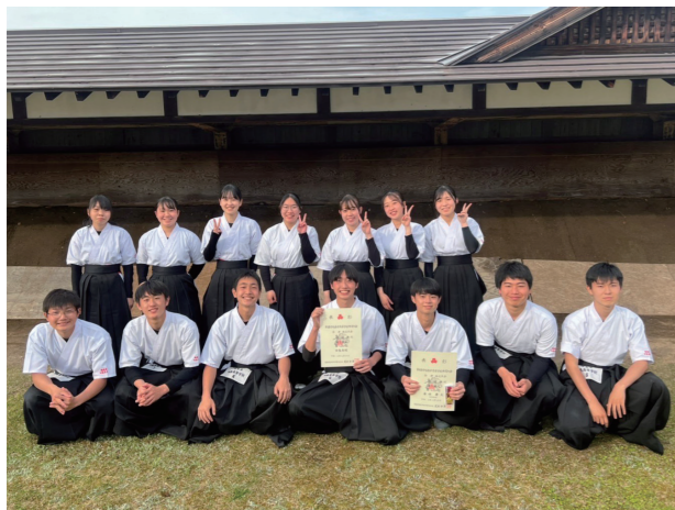
魂を込めて、一矢を放つ(田島高等学校)