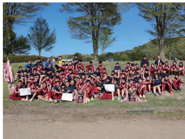
努力の末に優勝旗(田島中学校)