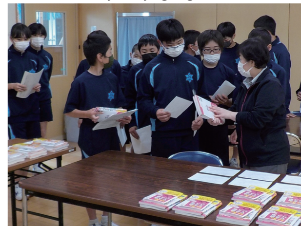
We'll try studying english(南会津中学校)

標記大会に、特設陸上部が参加しました。生徒たちは4月上旬から毎朝練習に取り組み、大会当日はその成果を存分に発揮し、見事女子総合・男子総合・男女総合優勝を果たすことができました。選手に加え、サポート、応援、大会の手伝いなど「チーム田島」として参加していました。この結果を糧に、今後の中体連総合大会等での活躍を目指していきます。