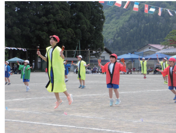
元気に踊るひのきの子(松沢小学校)

伊南駐在所のお巡りさんをお招きして防犯教室を行いました。通学途中で不審者に遭遇した場合の対処の仕方、留守番をしているときに訪問した不審者への対応の仕方について実技を交えて詳しく教えていただきました。不審者から身を守る合言葉「イカ」「の」「お」「す」「し」を活かして不審者から自分の命を守ることを学びました。