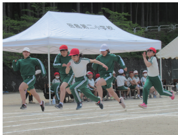
全力を尽くす徒競走(田島第二小学校)