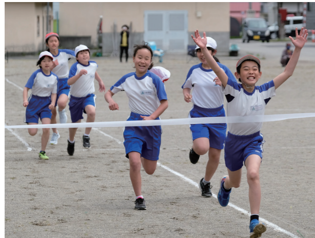
ゴールを目指して全力疾走(南郷小学校)