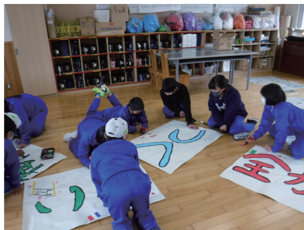
想いを込めた横断幕(田島小学校)

今年度も午前中のみ開催となった運動会。子どもたちは、応援合戦・鼓笛演奏・徒競走・親子競技・チャンス走・全校リレーなどに一生懸命取り組みました。全力で演技する姿はもちろん、運営する姿や応援する姿、家族と協力する姿など、子どもたちのどの姿もかっこよく素敵でした。子どもたち、家族、教職員が一致団結した素敵な運動会となりました。