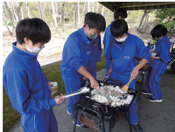
美味しさもひとしお(館岩中学校)

原付安全運転技術講習会を実施しました。2年ぶりとなる本講習会は、白バイ隊員の方を講師に迎え本校生7名が参加しました。南会津高校は、原付通学が条件付きで認められている県内でも数少ない高校のひとつです。参加した生徒は、乗車前点検、乗車姿勢など基本的な部分から丁寧に教えてもらった後、スラロームなどを真剣に取り組んでいました。