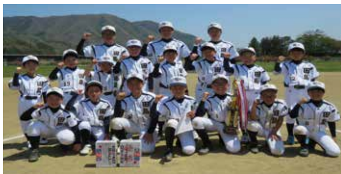
田島スポーツ少年団男子ソフトボール部