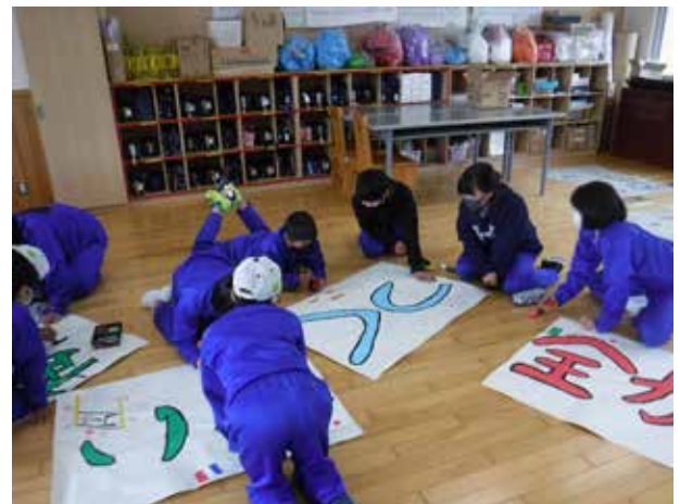
想いを込めた横断幕(田島小学校)

今年度も午前中のみ開催となった運動会。子どもたちは、応援合戦・鼓笛演奏・徒競走・親子競技・チャンス走・全校リレーなどに一生懸命取り組みました。全力で演技する姿はもちろん、運営する姿や応援する姿、家族と協力する姿など、子どもたちのどの姿もかっこよく素敵でした。子どもたち、家族、教職員が一致団結した素敵な運動会となりました。