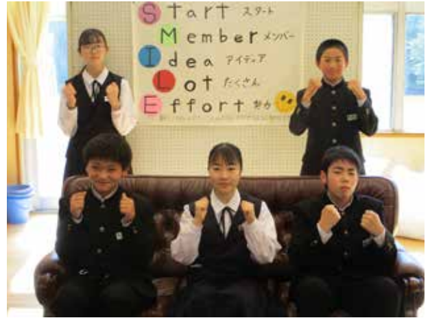
笑顔に溢れる学校へ(荒海中学校)

陽光が差し、春の訪れを感じるなか、館岩中毎年恒例の野外炊飯を行いました。定番の焼きそば、焼肉のみならず、ガーリックライスやフルーツパフェなど各班が予算内で工夫を凝らし、協力して作った料理に舌鼓を打ちました。時折吹く清々しい春風も心地よく、仲間との絆を深めた心温まる1日となりました。