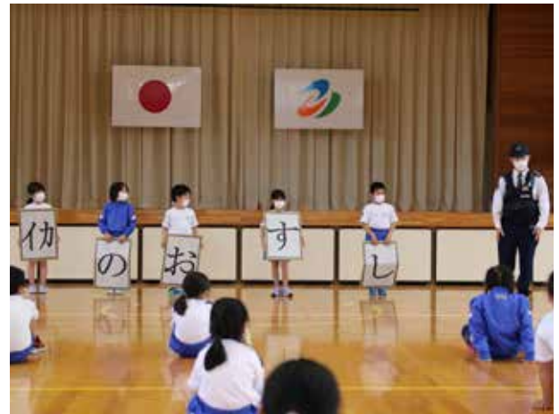
いざという時のために(伊南小学校)

雨天のため1日順延となりましたが、5月15日(日)青空の下運動会を開催することができました。6年生が考えた今年のテーマは「勇気りんりん フルパワー!」。全力で競技に挑む子。真剣なまなざしで鼓笛演奏に取り組む子。頑張る友達へ全開の声で応援する子。みんな一人ひとりがフルパワーで取り組んだ運動会でした。