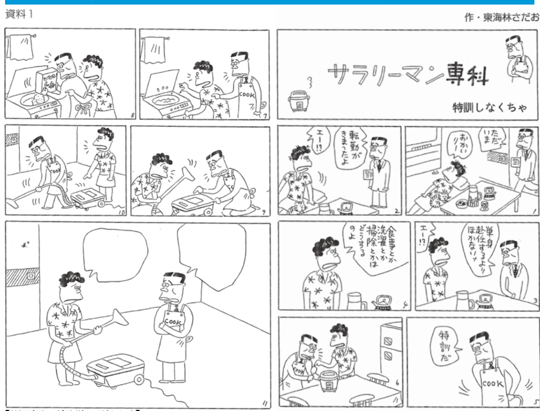
【漫画及び解説の引用元】 奥山和弘「男だてら」に「女泣き」 ジェンダーと男女共同参画社会入門 (文芸社) 14～18項

まずは男女共同参画について考えるきっかけとして、問題です。 Q. 次の漫画の最後のセリフはなんでしょう？