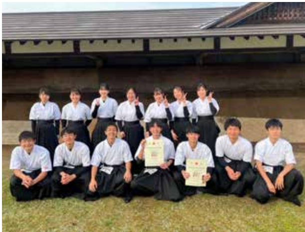
魂を込めて、一矢を放つ(田島高等学校)