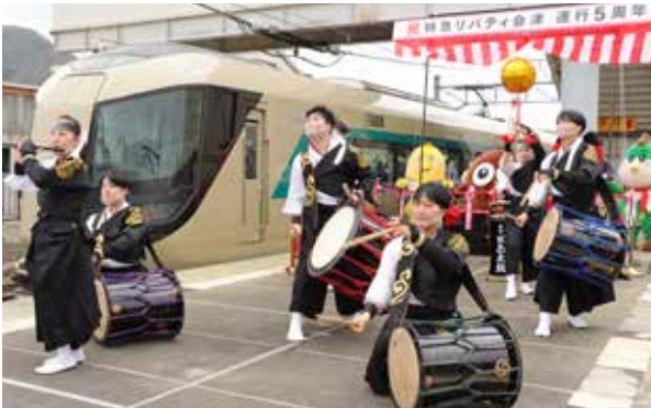
會津田島太鼓「白鼓」の皆さんの演奏