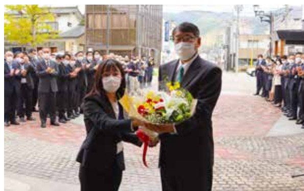
初登庁で職員から花束を受け取る様子