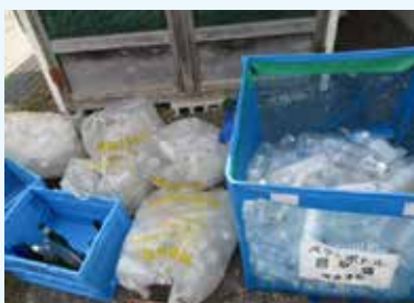
ペットボトル回収時