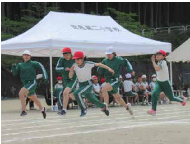
全力を尽くす徒競走(田島第二小学校)

伊南駐在所のお巡りさんをお招きして防犯教室を行いました。通学途中で不審者に遭遇した場合の対処の仕方、留守番をしているときに訪問した不審者への対応の仕方について実技を交えて詳しく教えていただきました。不審者から身を守る合言葉「イカ」「の」「お」「す」「し」を活かして不審者から自分の命を守ることを学びました。