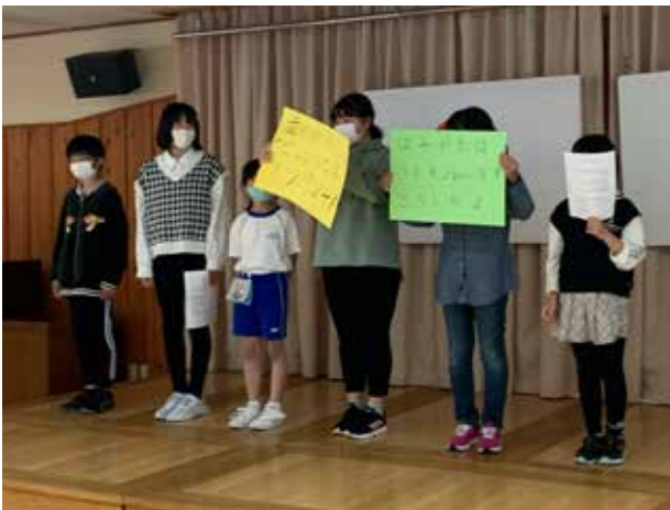
自主的な学びに繋がる提案(館岩小学校)

天候にも恵まれ、21日に運動会を実施することができました。徒競走・チャンス走・団体競技・踊り・鼓笛・全校リレーに、子どもたちは元気に取り組みました。練習の時から、一生懸命に頑張ってきた子どもたち。本番でも、その成果を発揮しようと、全力で競技に臨む姿は、どの子も輝きを放っていました。