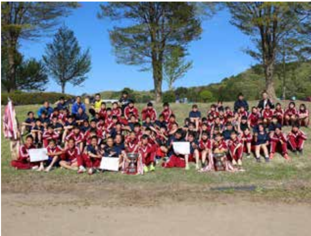
努力の末に優勝旗(田島中学校)

本校では毎年、生徒会活動に目標をもって取り組むためにスローガンを掲げています。今年度の生徒会スローガンをStart(スタート) Member(メンバー) Idea(アイディア) Lot(たくさん) Effort(努力)と掲げました。新しいメンバーでたくさんのアイディアを出せるように努力し、全生徒が笑顔(スマイル) でいられるような学校を目指します。