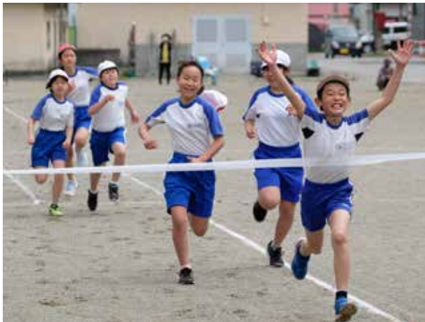
ゴールを目指して全力疾走(南郷小学校)