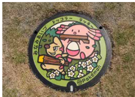
「木の町、南会津がイメージされた「ポケふた」

先日オープンした、みなみあいづ森と木の情報・活動ステーション「きとね」の芝生に設置してありますので、探してみてください。また、きとね内の「つくるば」には、ポケふたのぬりえも設置しましたので、併せてお楽しみください。