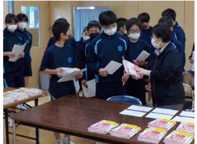
We'll try studying english(南会津中学校)

標記大会に、特設陸上部が参加しました。生徒たちは4月上旬から毎朝練習に取り組み、大会当日はその成果を存分に発揮し、見事女子総合・男子総合・男女総合優勝を果たすことができました。選手に加え、サポート、応援、大会の手伝いなど「チーム田島」として参加していました。この結果を糧に、今後の中体連総合大会等での活躍を目指していきます。