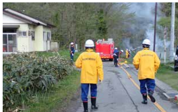
機敏な動きで行われた消火活動（館岩地域）

張り詰めた空気の中、団員の迅速で的確な動きに、見学に来ていた住民からは拍手が送られていました。