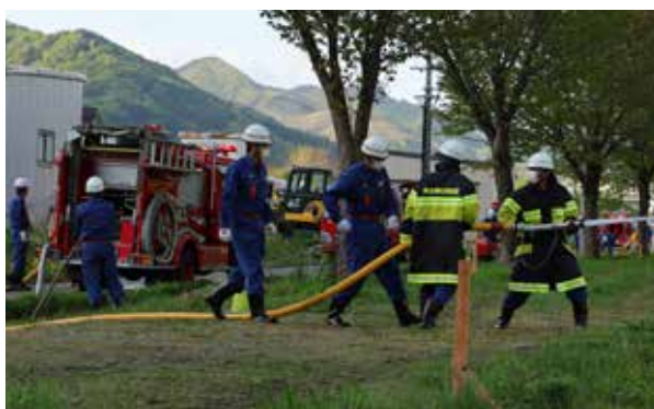
先輩団員の指導にも熱が入る（伊南地域）