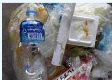
プラ製容器包装の回収時