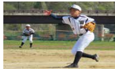
ソフトボール競技