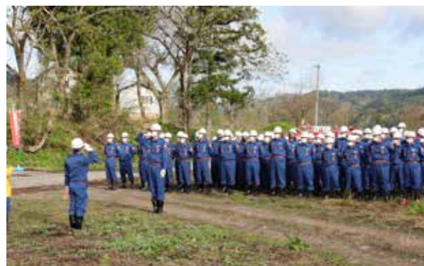
早朝から多くの団員が参加（南郷地域）