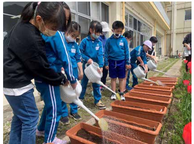
芽吹きを心待ちに(荒海小学校)