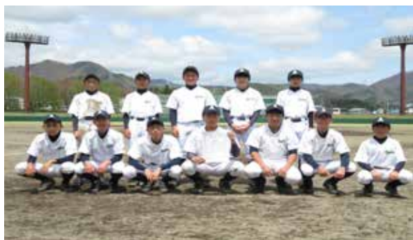
荒海スピリッツスポーツ少年団 (荒海中・館岩中合同チーム)