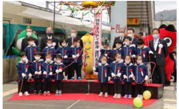
来賓の方々と田島保育園児によるくす玉開花