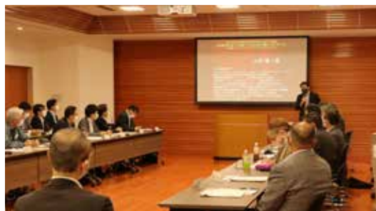
懇談会での講演の様子

向けセミナーを2回開催し、現在までの取組や成果の共有、3市町の事業者同士の交流や情報交換を行うほか、町民の方により八十里越を知ってもらうために、八十里越道路の工事見学ツアーなどを開催予定です。詳細が決定しましたら、改めてお知らせしていきますので、ぜひご参加ください。