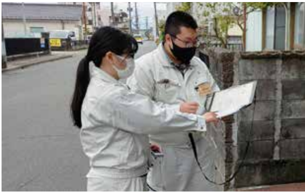
相馬市で住宅被害認定調査業務にあたる様子