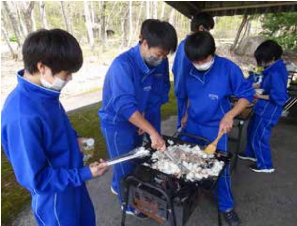
美味しさもひとしお(館岩中学校)