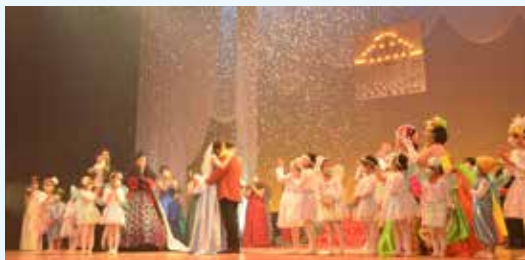
昨年開催された手作り舞台公演