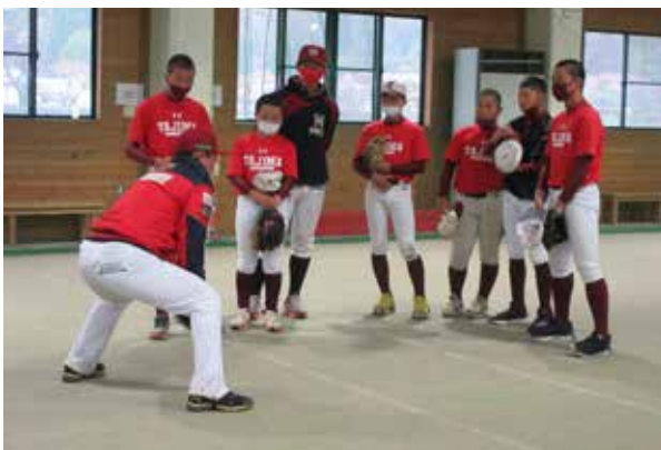
試合後に行われた野球教室