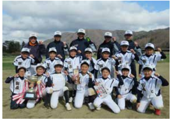
田島スポーツ少年団男子ソフトボール部の皆さん