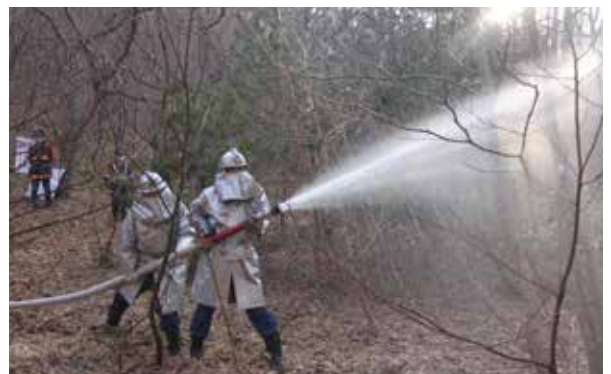
迅速な消火活動が行われていました（羽塩区）

町消防団では、引き続き火災予防の啓発強化に努めますので、地域住民の皆さんのご理解とご協力をお願いします。