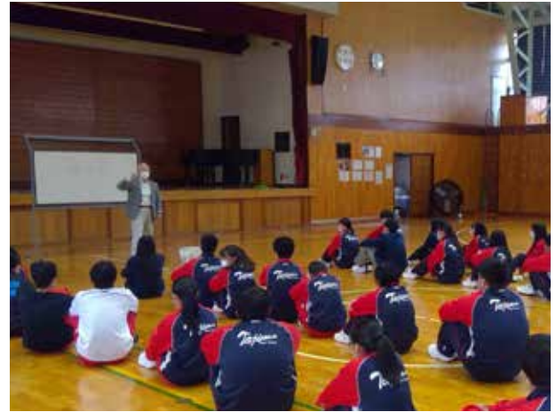
自分を表現し友人の魅力を知る(田島高等学校)

桜が咲き始めた時期ですが、地元南郷スキー場の協力を得て雪上トレーニングを実施しています。放課後や休日に雪上練習ができるこの環境を活かし、来シーズンはさらなる活躍をしてほしいと思います。