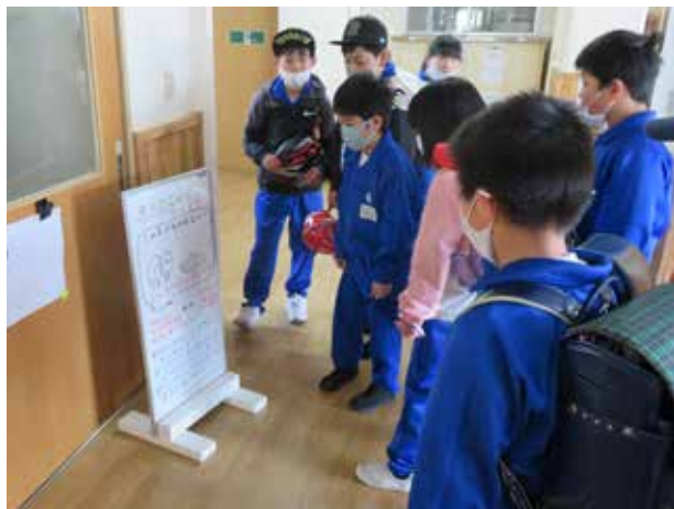
魅力ある学校づくり(田島小学校)