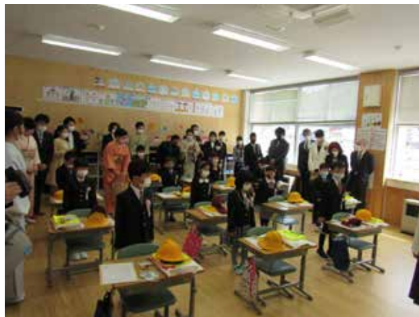
ドキドキの入学式(南郷小学校)

今年度、田島小学校は「がんばるぞう」「まけないぞう」「見つけるぞう」を合い言葉に子供たちのやる気を高めていきます。その第1弾として校長室の前にクイズコーナーが設置されています。「校長先生、ヒント教えてください!」といきなり質問に校長先生もたじたじですが、魅力ある学校を目指して今年度もがんばるぞう!