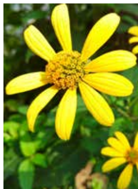
オオハングンソウ

どちらの植物も、強い繁殖力を持ち、他の植物の成長を妨げるなど、周囲の生態系に重大な影響を及ぼすことから「特定外来生物」に指定されています。