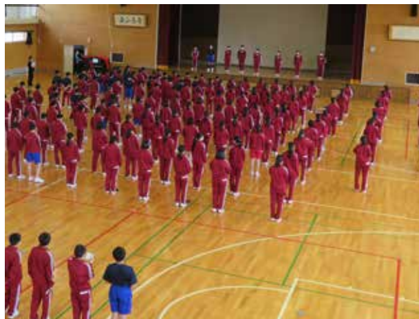
伝統を繋いでゆく(田島中学校)

今年度も、『荒海中の伝統である「ななもりの心」を意識して生活しよう!』と校長先生から全生徒へ呼びかけがあり、全校朝会では、毎回唱和することになりました。良き伝統はしっかり引き継いでいきたいものです。また、春のテーマとして「人にあたたか」をクローズアップして良好な人間関係の構築を図っていきます。