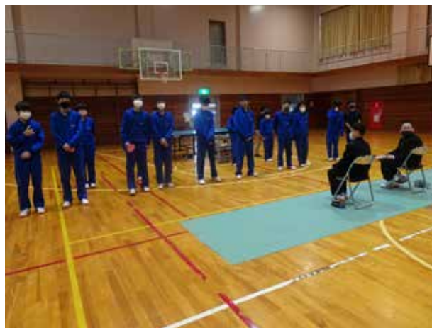
館中の魅力を存分に(館岩中学校)

入学式の翌日に対面式を実施しました。前日の準備会では各部の2,3年生が新入部員獲得に向けて懸命に思案。各競技の練習内容はもちろんのこと、部員の個性を生かした寸劇あり、思わず見とれるスーパープレイありと、工夫を凝らした発表が行われました。緊張していた1年生も最後には満面の笑顔を浮かべ、時間を忘れる楽しい会になりました。