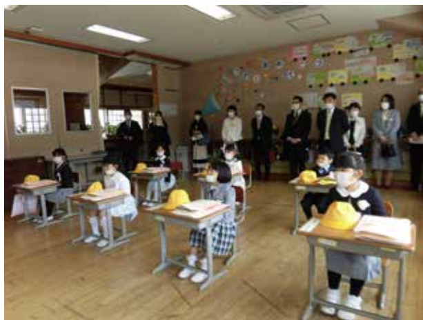
新たな一歩を踏み出す(桧沢小学校)

新入生13名が入学しました。ビシッと決めた服装で、シャキッと臨んだ入学式。ドキドキワクワクしながら初めての教室に入り、ピッカピカの帽子と教科書をもらいました。ドキドキ見守る保護者の皆様の期待に応えてハキハキお返事立派でした。これから新しい学校生活が始まります。元気に登校してくださいね。