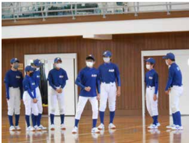
ユーモアあふれる対面式(南会津中学校)