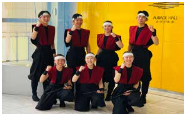
笑顔溢れる「狐ノ刃」の皆さん