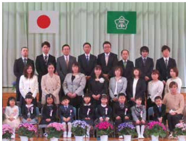
元気な声が響く(田島第二小学校)

4月6日、桧沢小学校に7名のお友達が入学しました。緊張する姿も見られましたが、2年生から6年生のお兄さん、お姉さんに見守られながら、無事入学式を終えることができました。これからは、優しい上級生や先生方と一緒に、楽しく勉強や運動に取り組んでいきましょう。