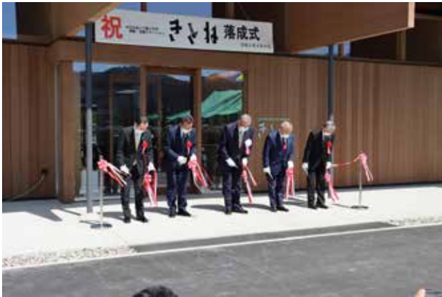
落成式の様子 (テープカット)

当施設では林業の担い手確保・育成につなげる取り組みとして、林業に関する情報提供や発信、相談窓口を設けるなど、林業への就業に向けた支援を実施していきます。