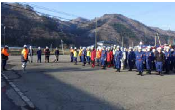
早朝から多くの団員が参加（福米沢区）