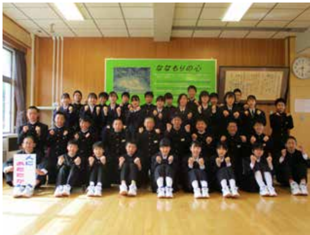
33年間続く 伝統の精神!(荒海中学校)

2名の新入生を迎え、全校生21名でスタートした令和4年度の「チームたていわ」。今年度は「Change!!」(変わりましょう)(変えていこう)「Yes,We Can!!」の合言葉も加わりました。4月7日に行われた生徒会オリエンテーションでは、上級生から生徒会活動や部活動についての説明が行われ、新入生は新たに始まった中学校生活に期待を膨らませました。