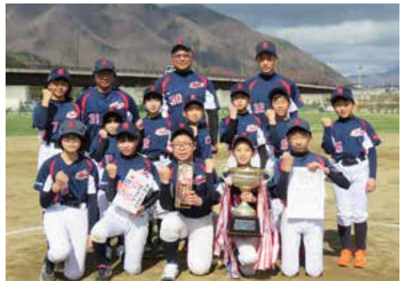
南郷スポーツ少年団の皆さん