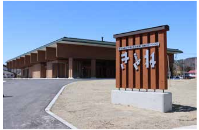
オープンした「きとね」

式では、これまでの工事経過報告のほか、工事関係者等に感謝状が贈呈がされました。また、テープカット後にオープンし、多くの方々が訪れ、賑わいました。