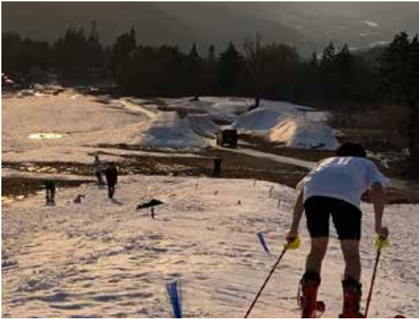
継続は力なり(南会津高等学校)