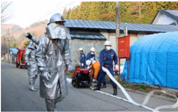
原野火災を想定しての消火訓練（水無区）