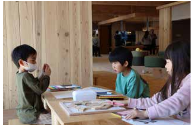
「つくるば」で遊ぶ子どもたち

幅広い世代が、木材を身近なものとして実感できる「まなぶば」「あそぶば」「つくるば」を設置しています。