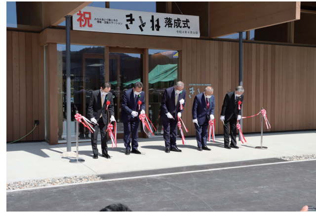
落成式の様子(テープカット)

式では、これまでの工事経過報告のほか、工事関係者等に感謝状が贈呈がされました。また、テープカット後にオープンし、多くの方々が訪れ、賑わいました。