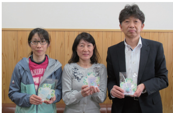
マスクットを手にする星さん㊦と関口さん㊦