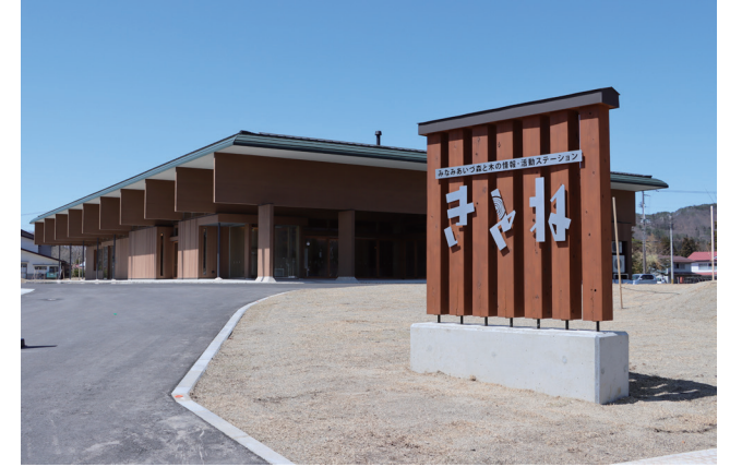
オープンした「きとね」

当施設では林業の担い手確保・育成につなげる取り組みとして、林業に関する情報提供や発信、相談窓口を設けるなど、林業への就業に向けた支援を実施していきます。