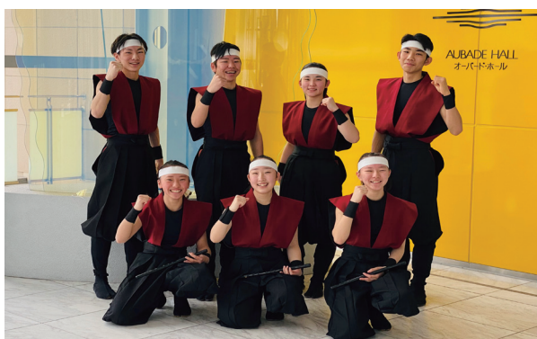
笑顔溢れる「狐ノ刃」の皆さん

■ 開催期間: 5月29日(日)まで ※月曜日休館 ■ 場 所: 福島県立博物館(会津若松市) エントランスホール