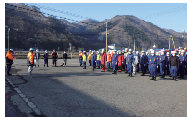
早朝から多くの団員が参加(福米沢区)

町消防団では、引き続き火災予防の啓発強化に努めますので、地域住民の皆さんのご理解とご協力をお願いします。