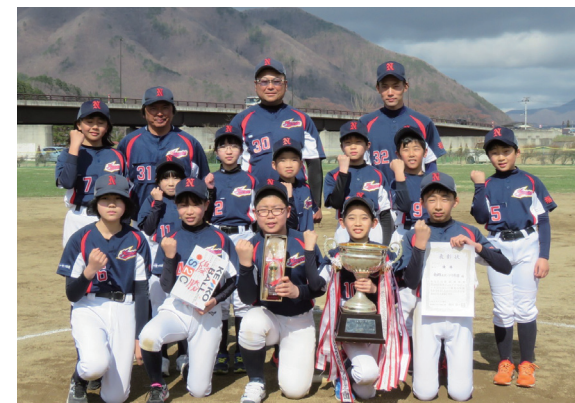
南郷スポーツ少年団の皆さん