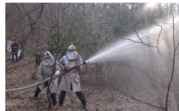
迅速な消火活動が行われていました(羽塩区)