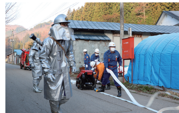
原野火災を想定しての消火訓練(水無区)