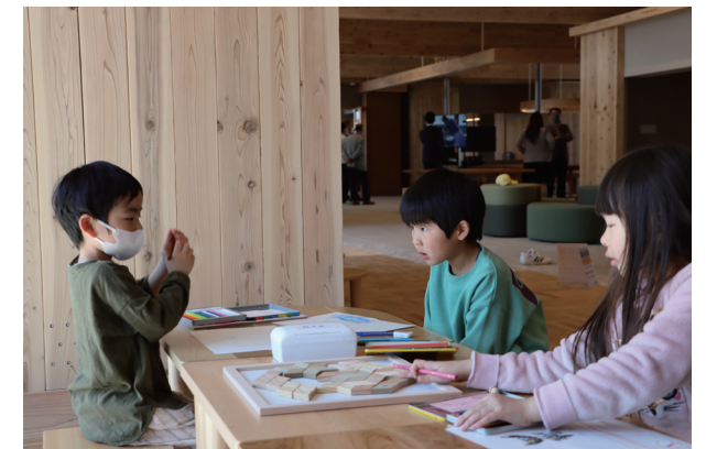
「つくるば」で遊ぶ子どものたち

そのほか「木の町」をPRするため、地場産材で製造し、高い評価を得ている家具や、様々な木製玩具を配置したほか、木製玩具やアロマオイルの展示・販売もしていますので、気軽にお立ちよりください。