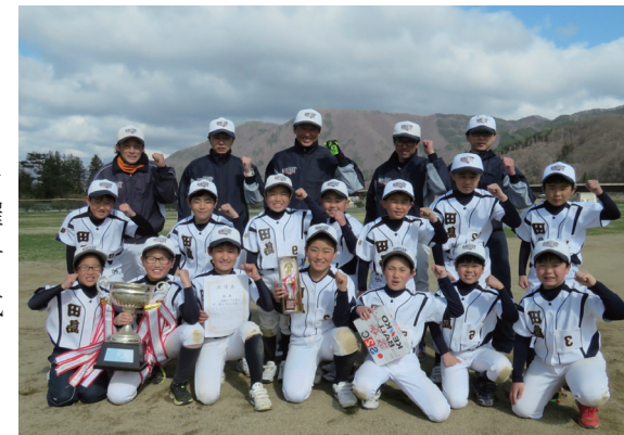
田島スポーツ少年団男子ソフトボール部の皆さん