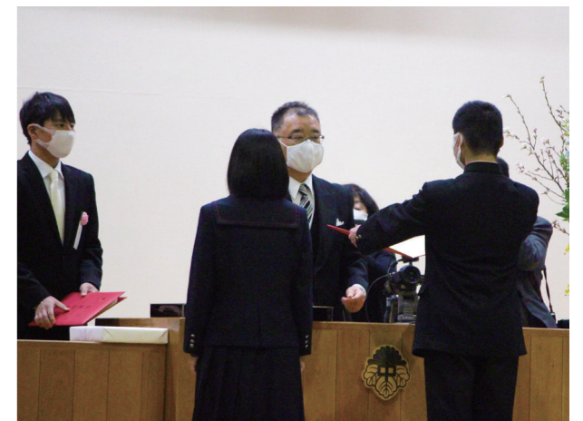
さらなる飛躍を誓う(田島中学校)

コロナ禍で挙行された卒業証書授与式に臨む卒業生19人。厳粛な空気が漂う中、名前を呼ばれた生徒の力強い返事が体育館に響き渡ります。マスク越しに発せられる声にも、生徒たちの成長を感じることができ、式全体を通して多くの感動を残してくれました。在校生は、立派な卒業生の姿を目に焼き付け、伝統の「荒中魂」を引き継いだようです。