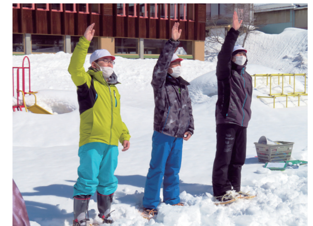
豊かなアイデアをカタチに(館岩小学校)

国のGIGAスクール構想により、町から児童一人一人にタブレット端末が整備され、1年が過ぎようとしています。本校でも、インターネットを活用した学習に加え、写真や動画を撮影したり、発表原稿をタイピングしたりと、授業で幅広く端末を活用。毎日扱う文房具のように、タブレット端末がより身近に感じられる学習環境を心がけています。