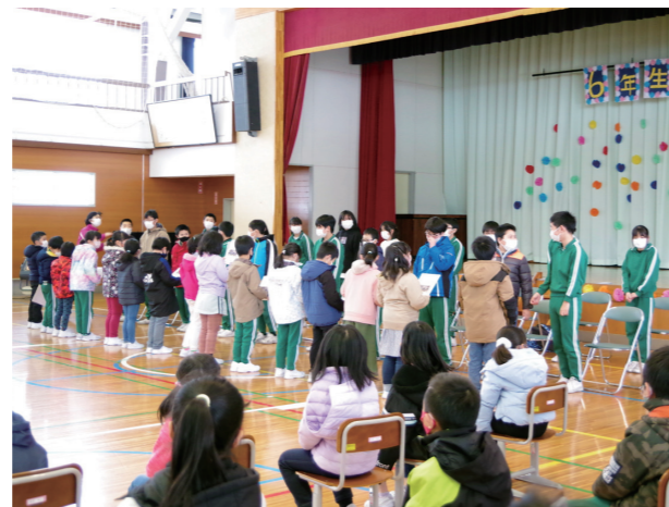
最上級のおもてなし(田島第二小学校)

大好きな桧沢小学校を卒業する6年生全員で、雪遊びを楽しみました。他者を思いやり、仲間と協力し合って過ごした1年間、常に「学校のため、みんなのため」を実践してくれた8人。下級生のお手本となる頼もしい存在ですが、今日ばかりは時を忘れて大はしゃぎ。この笑顔が絶えることのない、充実した中学校生活となることを願っています。