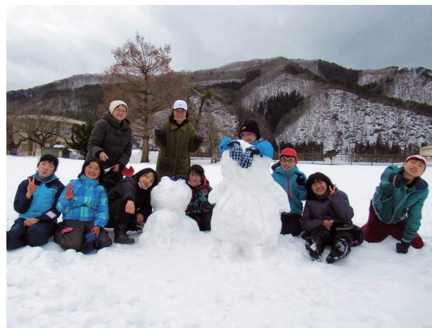
はじける笑顔大切に(桧沢小学校)