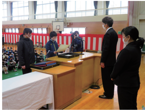
「先生ありがとう」を結集(田島小学校)