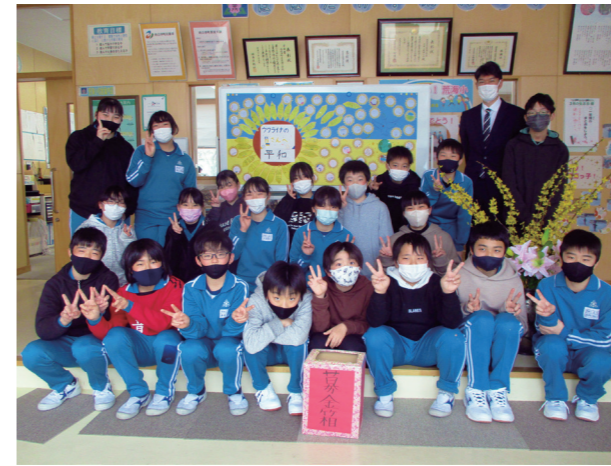
願いは国境を越える(荒海小学校)

6年生に日頃の感謝を込めて、各学年ごとに工夫を凝らした出し物を披露。クイズやアトラクションで、体育館は明るい雰囲気に包まれています。また、鼓笛隊が新体制に移行することに伴い、 いじょうしき 移杖式も併せて開催。旧メンバーが慣れ親しんだ校歌などを演奏すると、新メンバーもドラムマーチでお返し。感動の光景が広がっていました。