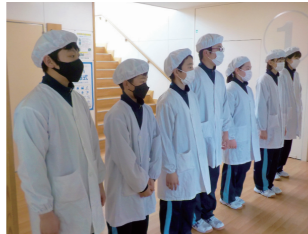
責任ある生徒の姿(南会津中学校)

迎えた卒業式では、感染拡大防止のため、在校生の同席は叶いませんでしたが、卒業生への感謝を含めて、式会場までの通路を色鮮やかな紙花やメッセージ、思い出の写真などで装飾してくれました。オンラインで見守る在校生の心遣いに触れながら、卒業生39人が学び舎を巣立ちました。多くの経験を経て「地域の未来を創る人材」に成長することを期待します。