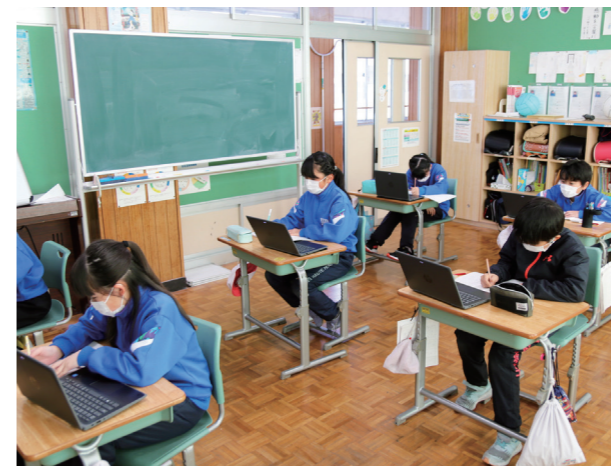
「相棒」となる日は近い(伊南小学校)

3月3日の3校時...3が3つ並ぶタイミングで、全校生が体育館に集まりました。真心が込められた案内状で、手作りの装飾が施された会場に招待される6年生。在校生は準備と練習を重ねたクイズや歌、プレゼントなどを贈り、これまでの感謝の気持ちを伝えます。春の日差しのように温かく、楽しい時間を過ごすことができました。