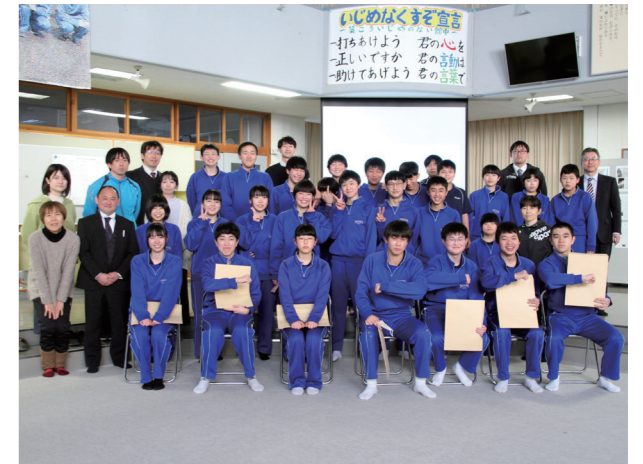
「チームたていわ」を胸に刻む(館岩中学校)

無事に卒業式を終え、1・2年生は進級に向けて学年のまとめに着手。特に成長著しいのが、学級の係や委員会といった自分の役割への責任感。この日は4校時が移動教室でしたが、1学年の給食当番はあっという間に準備し、配膳室の前で献立の説明を真剣に聞いていました。卒業生から受け継いだ南会津中の誇りと伝統は、確実に後輩へ伝わっています。