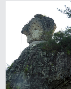
現在も姿をそのまま残す 「天狗の投げ石」