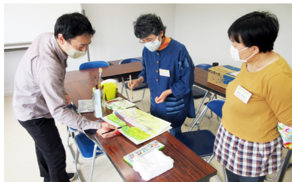
初心者の方も大歓迎！絵画を一緒に楽しみましょう