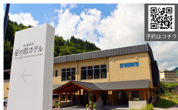
オープンを迎えた会津高原星の郷ホテル