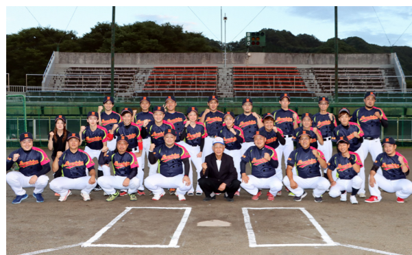
活気あふれるチームにご期待ください