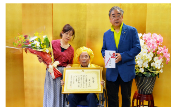
ご家族と一緒に記念撮影