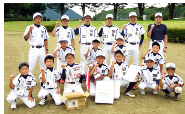
優勝した田島スポーツ少年団男子ソフトボール部