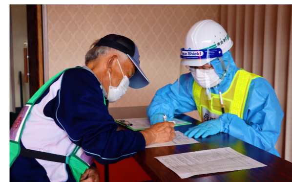
体調不良者に対する問診(避難所開設訓練)