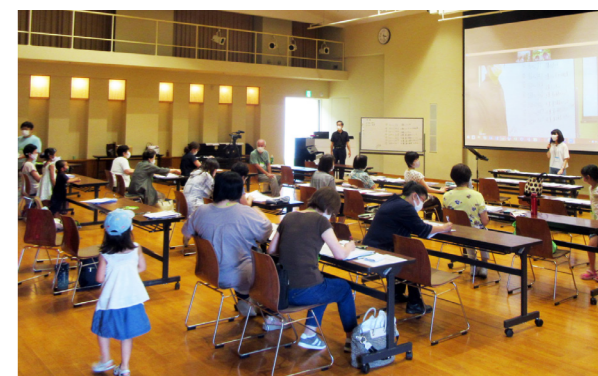
皆さんも練習の輪に加わってみませんか