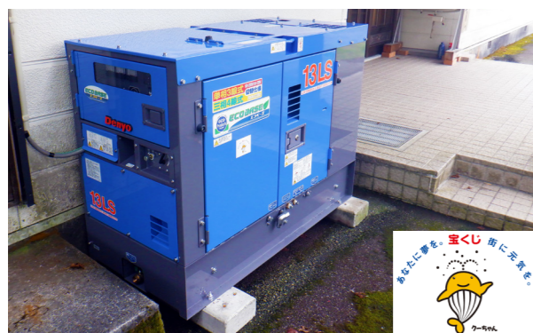
設置された発電機(永田林業研修センター)

このたび、宝くじを原資とするコミュニティ助成事業を活用し、永田林業研修センターに発電機を設置しました。災害など有事の際に、自主防災活動に支障がないよう、停電対策を強化するものです。地区住民が安心して生活できる環境の整備に寄与することができました。