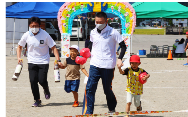
南郷トマトや地酒を抱えてゴール！

借り物競争など親子競技では、紅組と白組による熱戦が繰り広げられました。アットホームな雰囲気に包まれ、親子一緒に心地よい汗をかいたようです。