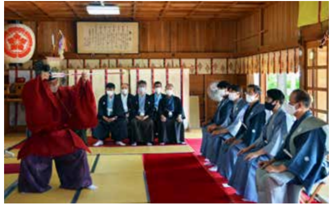
厳粛な雰囲気の中で執り行われた神事の様子

なお、田島保育園の園児の皆さんによる奉納太鼓も併せて披露され、神事に花を添えました。また、夜には各屋台上で、田島祇園祭屋台歌舞伎保存会による子供歌舞伎が上演され、多くの方が足を止めていました。