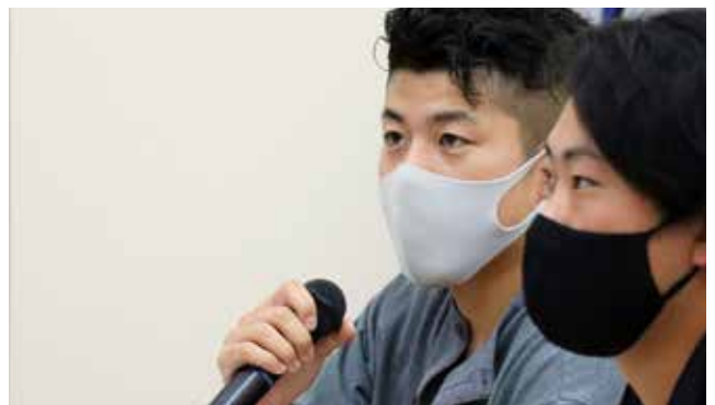
多様な視点から、活発な議論が交わされました