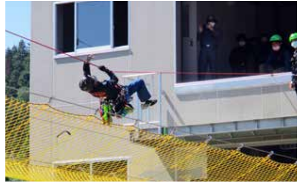
高所に臆することなくロープ渡過に挑戦

隊員の努力の積み重ねにより、万が一に備えた救助体制を敷いていますが、登山にあたっては事前準備を徹底し、遭難事故防止にご協力ください。