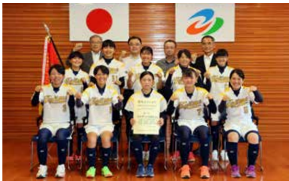
記念撮影でも持ち前の明るさが爆発！