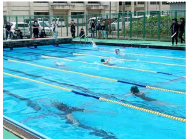
自己ベスト更新を目指して(荒海小学校)

しらかば公園で、館岩小学校と館岩幼稚園合同の体験学習を行いました。児童たちは早速、放流されたイワナのつかみどりに挑戦しますが、なかなかうまくいきません。泳ぐイワナのスピードに翻弄されるも、協力し合い無事捕まえることができました。また、地域住民や保護者の皆さんから、イワナのさばき方を学び、最後はおいしくいただきました。