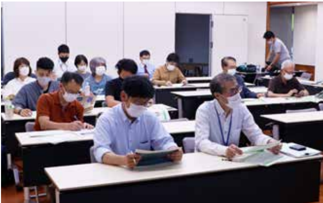
説明会当日は、町内事業者をはじめ15人が参加