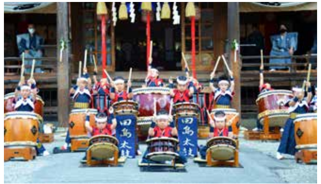
元気いっぱいの音色を響かせた奉納太鼓