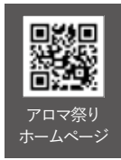
アロマ祭り ホームページ

イベントの詳細は、ホームページをご確認ください。当イベントは「南会津町元気の出る地域づくり支援事業」を活用して開催します。