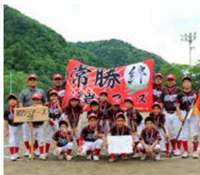
西部地区優勝： 館岩ベアーズスポ少