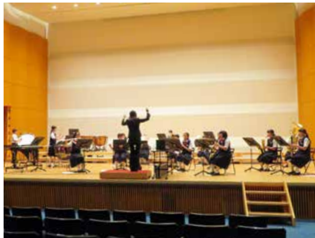
直前の発表会が自信につながる(田島中学校)

コロナ禍により、昨年は開催を断念した校内体育祭を、今年は無事開催することができました。3年生は最後の、1・2年生は初めての校内体育祭。全校生と全職員の心が一つとなる時間は、かけがえのないものです。保護者の皆様のご協力により造形された「心」の文字をバックに、体育祭後の記念撮影に臨んだ3年生は、青春の1ページを心に刻みました。