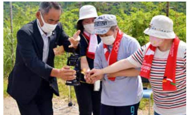
採火した種火をランタンに灯す作業所の皆さん

当イベントは、作業所自慢の割り箸で起こした種火を採火し、パラリンピックの聖火リレーにつなげるもの。「南会津町の火」は、県内全市町村から集められた種火と合わせ、8月24日のパラリンピック開会式へ届けられます。