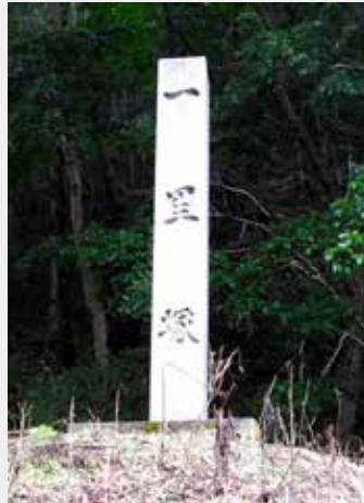
「横川の一里塚」 (日光市指定文化財)

道中記には「待まふけありて、酒、飯、数種の料理あり、馳走になる」と記されています。「待まふけ」とは「待ち設ける」ことを指す言葉で「客人を待ち受ける」