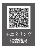
モニタリング 検査結果

県のホームページ上で、モニタリング検査結果を公開していますので、ご確認ください。