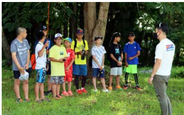
針生区の皆さんや多くのお子さんも参加