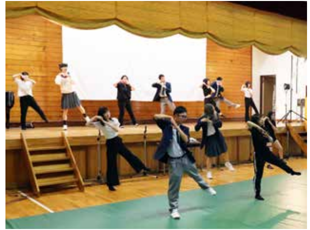
最高のパフォーマンスを発揮(田島高等学校)

全校生が一丸となり、2年ぶりとなる校舎内外の清掃活動に取り組みました。校舎外では、男子生徒が側溝にたまった泥をかき出し、校舎内では、女子生徒が普段手の行き届かない隅々まで清掃しました。途中で雨が降り出しましたが、生徒の手は止まることなく、2時間の作業を完遂。きれいになった校舎で、より一層勉強や部活に励んでほしいと思います。