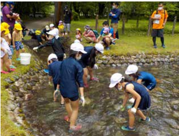
イワナを追いかけて右往左往(館岩小学校)