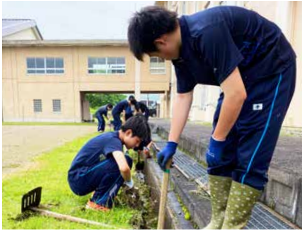
頬を伝う汗が光る(南会津高等学校)