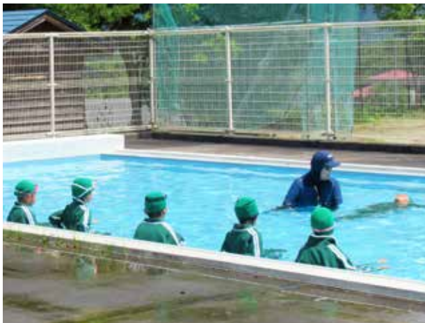
「浮いて待つ」大切さを学ぶ(田島第二小学校)

南郷小学校では、先生同士でお互いの授業を参観し合い、授業力の向上に努めています。今回は「正直にすることの大切さ」を説く、3年生の道徳科を研修の場に設定。窓ガラスを割って逃げてしまった主人公が、あることをきっかけに正直に謝るという物語を通して、児童たちと一緒に「正直にすること」がもたらす価値について考えを深めました。