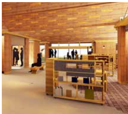
施設イメージ（内観：共有スペース）

しており、国道289号田島バイパス沿いという立地を生かした、アクセス性の高い施設です。