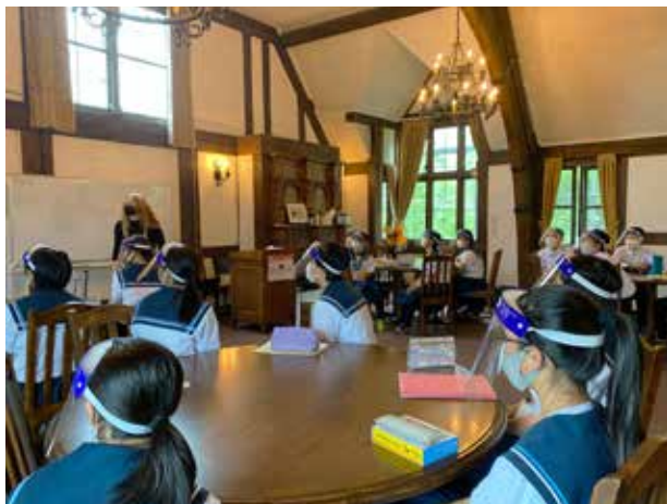
I am so excited. (南会津中学校)