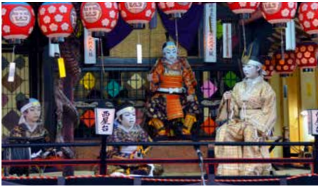
真剣なまなざしで役を演じる子どもたち