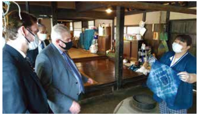
奥会津博物館で藍染め文化に触れる