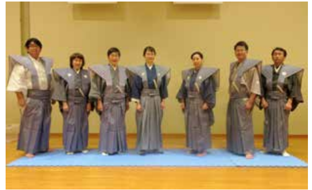
美しく裱を着こなす参加者の皆さん

6月21日の最終講座では、参加者それぞれの成果を確認。「自分で着たい」「家族に着せたい」ご家庭でも上達した着付けの腕前を披露してください。