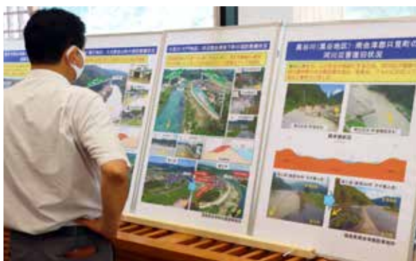
展示パネルに目を通す来場者