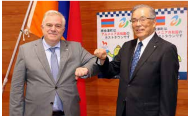
アレグ・ホヴァニシャン駐日大使 ㊦ と大宅町長 ㊧

新型コロナウイルスの感染状況を踏まえ、東京2020オリンピック後に予定されていた代表選手団との事後交流は中止となりましたが、草の根による交流が実現する日を夢見て、今後も絆を深めていきます。国際交流の推進にご期待ください。