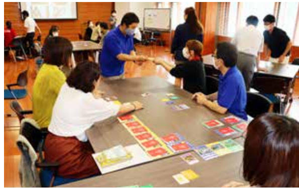
刻々と変化する世界を実感する参加者たち

持続可能な社会の実現には「経済」「環境」「社会」のバランスが大切。「経済」を重視すれば「環境」が悪化し、「社会」を重視すれば「経済」成長が滞る。一人の活動で世界に変化が生じることを意識する機会となりました。