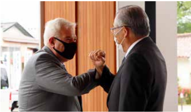
再会のあいさつは「腕タッチ」