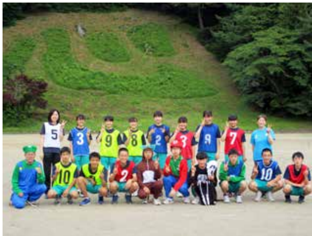
「心」の文字背負ってます！(荒海中学校)

地元の会津高原たかつえカントリークラブと連携し、年2回のゴルフ教室を開催しています。今回は、その1回目。講師の皆さんの熱心な指導を受けた生徒たちは、グリーンめがけて思い切りクラブを振り抜き、ゴルフの醍醐味を満喫。南会津町の豊かな自然を肌で感じる事ができるこの行事は、生徒たちにとって最高の思い出になることでしょう。