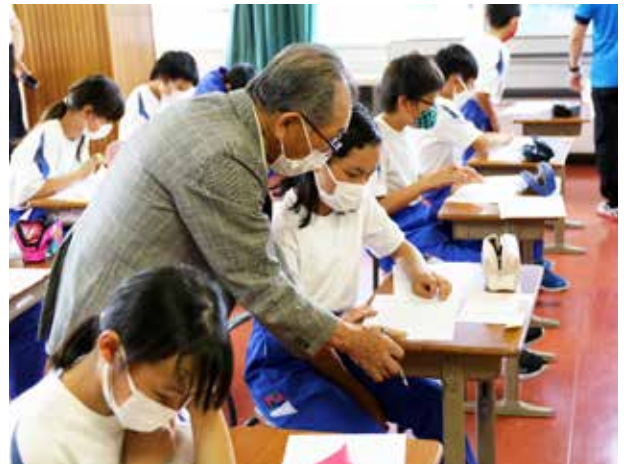
言葉の美しさに触れる(伊南小学校)

全校生で着衣泳に挑戦したこの日は、絶好のプール日和。はじめに、服を着たままプールに入り、濡れた重みで自由に動けない状態を体験。次は、服に空気を入れたり、ペットボトルを使ったりと、水に浮く感覚をつかみます。この体験や感覚を通して、万が一の場合は「浮いて待つ」よう心がけるなど、水難事故への備えを学ぶことができました。