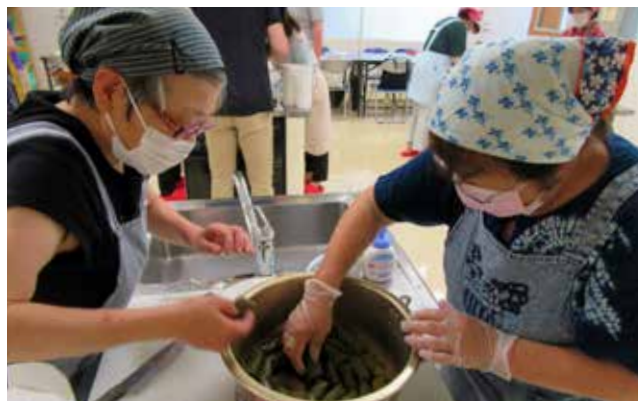
慣れない調理工程も「経験」でカバー

具材をブドウの葉で包む「トルマ」、ヨーグルトソースで具材を和えた「ジャジク」、クルミの焼き菓子「パクラバ」の3品が完成し、早速アルメニアの味を体感。異文化の香りに包まれ、楽しい時間を過ごしていました。