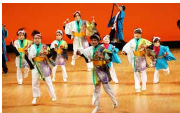
躍動感あふれる「よさこい踊り」