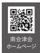
南会津会 ホームページ