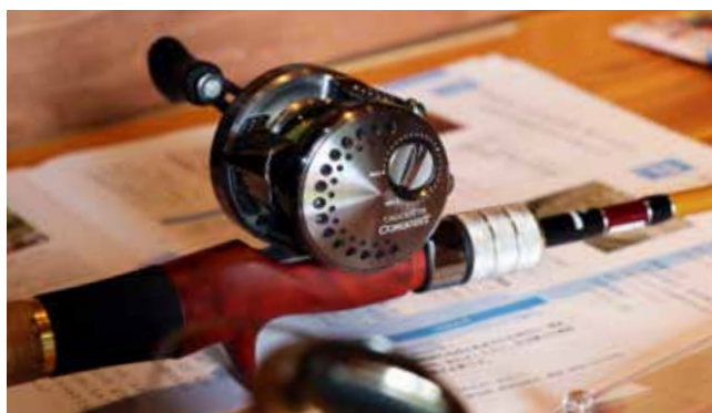
ロッジ内に並ぶフィッシング用品

7月22日には、当ロッジを開放したイベントを開催。ルアーフィッシング講座のほか、焚き火やテント設営など、お手軽アウトドア体験を提供しました。ふらっと立ち寄れるフリースペースも設けていますので、近くにお越しの際は、ぜひ足を運んでみてください。