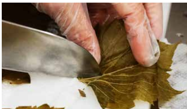
塩漬けにしたブドウの葉など珍しい食材も登場