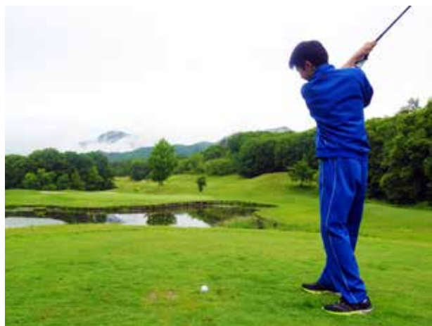
グリーンめがけて、フルスイング(館岩中学校)

町が進める「英語が話せる人材育成事業」の一環として、天栄村のブリティッシュヒルズで語学学習を行いました。1年生は日帰り、2年生は1泊2日の行程で、日頃の英語学習の成果を腕試し。ウォームアップゲームやクラフト、アクティビティなど、英国情緒漂う多様な体験を通し、英語の楽しさや英語を学ぶ意義を実感することができました。