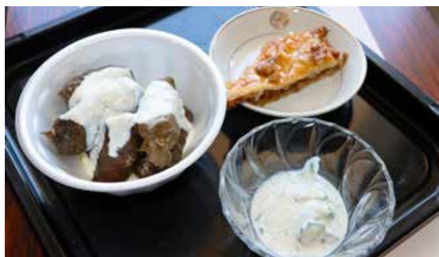
完成した「トルマ㊤」「パクラバ㊤」「ジャジク㊤」