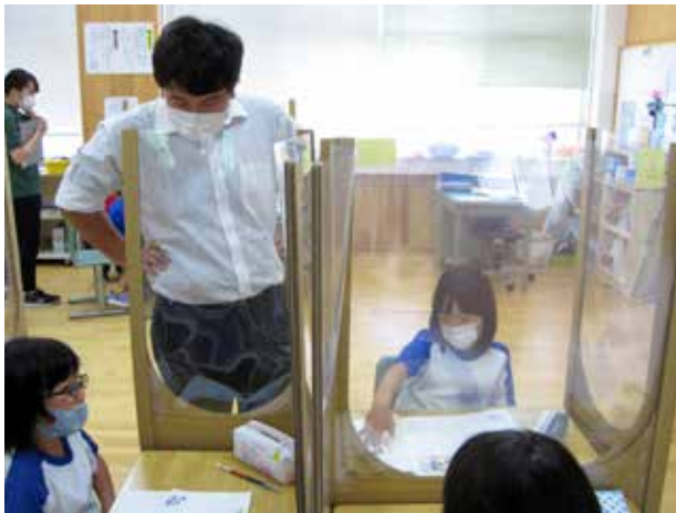
授業力向上の一手(南郷小学校)