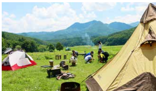
針生区の自然や魅力を発信する拠点に