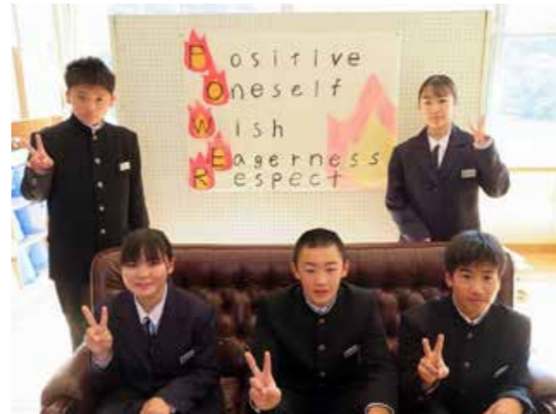
「POWER」を胸に刻む(荒海中学校)

田島高等学校の春の風物詩ともいえる新入生歓迎マラソン大会は、回を重ねること70回。創立110年を迎えた本校で特に歴史ある行事であり、町民の皆さんにとっても、なじみ深い存在ではないでしょうか。当日は、沿道で田部原保育所の園児の皆さんから送られる温かい応援を背に、男子生徒が11.1 km、女子生徒が7.5 kmのコースを力走しました。