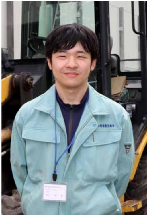
環境衛生課 東部環境係

南会津町の魅力—一番に思い浮 かぶものは豊かな自然。貴重な湿 原やそこに生き抜く動植物など、 自然環境をどうやって守りぬいて いくべきか、視線はすでに未来へ 向けられています。 また、急速な人口減少が進む中 で、環境衛生組合の職員として、 時代に沿ったごみの処分方法も 検討しなければなりません。 将来を担う世代に過度の負担が かからないよう持続可能な体制を 構築したいと熱意を語ってくれま した。