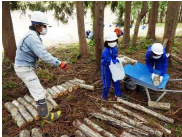
原木運びから植菌はスタート(館岩小学校)