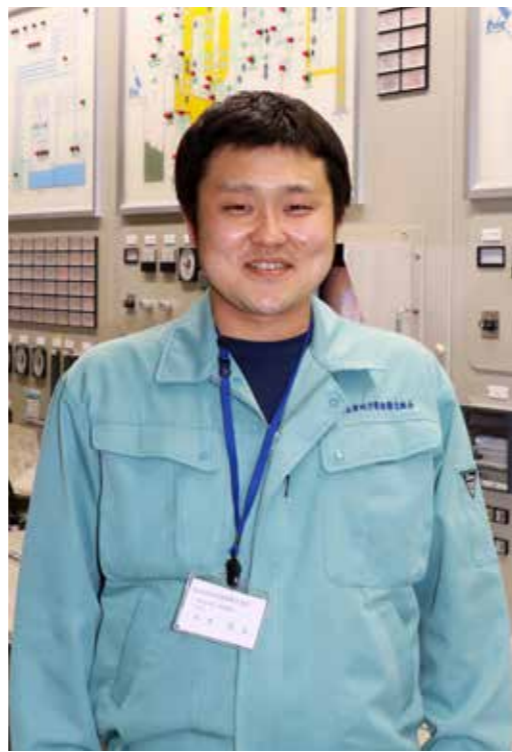
環境衛生課 東部環境係