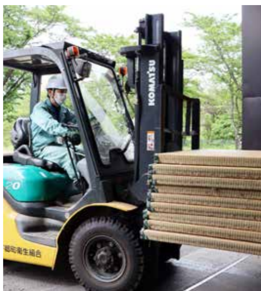
写真② ごみの自己搬入を受け入れる上で、 限られたスペースは有効に活用。粗大 ごみの整理も大切な作業の一つ