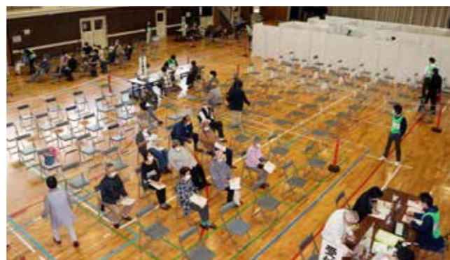
集団接種会場（田島体育館）