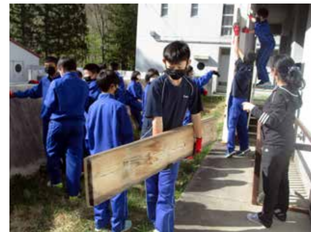
ひた向きに作業をこなす(館岩中学校)

4月を迎え、学校整備活動や学校行事の準備のために、生徒会からボランティアを募集したところ、学年を問わず多くの生徒たちが協力してくれました。本校のボランティア活動で素晴らしい点は、第一に参加生徒数が多いこと、次に活動をしている生徒たちの表情が輝いていること。今回も笑顔あふれるボランティア活動が展開されました。