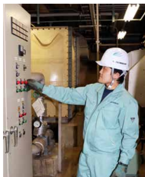
写真④ 自己搬入のごみを受け入れるほかに、施設管理にも従事。各機器に定期的なメンテナンスを施す