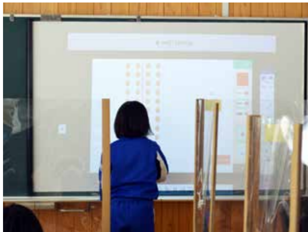
ICTを活用して問題を解く(南郷小学校)