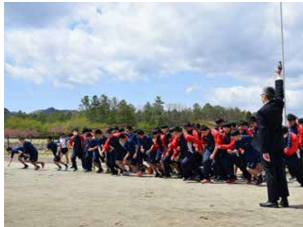
校長の号砲でスタート(田島高等学校)

4月末から5月上旬にかけて、各運動部が県高等学校体育大会会津地区大会に参加しました。新体制でも伸び伸びと力を発揮した選手たち。バレー部が地区準優勝の成績を残したほか、野球部・卓球部・陸上競技部・剣道部が県大会出場を決めました。野球部の春季県大会出場は、創部以来初めてのこと。結果の詳細は、ホームページでも発信しています。