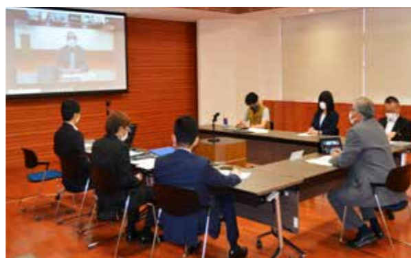
オンライン形式で開催された懇談会