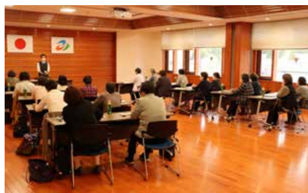
研修会当日は推進員 20人が参加