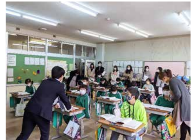
児童を温かく見守る体制を(田島第二小学校)

「運動会のために校庭の草をむしろう」「昨日はお掃除がなかったから、廊下の掃除をしよう」松沢小学校では、児童たちが毎朝主体的にボランティア活動を行っています。一人一人が内容や場所を考えて、美化活動を行うおかげで、校庭には草も石もほとんどありません。教師に言われるのではなく「学校のために考えて実行する」ボランティア精神が育まれています。