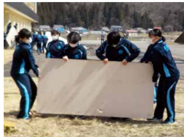
「奉仕の心」輝く(南会津中学校)