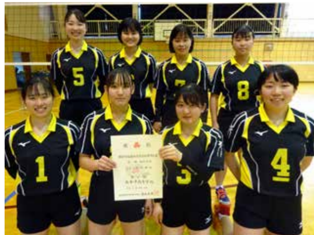
練習の成果を存分に発揮(南会津高等学校)