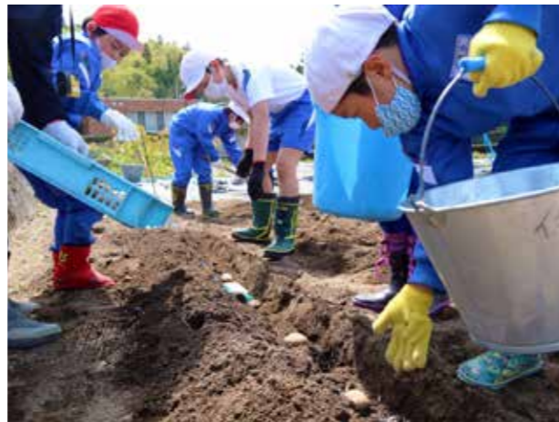
土に触れる喜びを知る(伊南小学校)

3年生の算数科では、ICT(情報通信技術)を活用し、「九九を見直そう」の学習に取り組んでいます。児童たちは、2年生で学習した九九の計算に基づき、「12×4」の答えをどうすれば導き出せるのか、考えを深めました。電子黒板のスクリーンに、専用のペンで自分の考えを記入。発表を通じて、クラスメイトと答えの導き方を共有することができました。