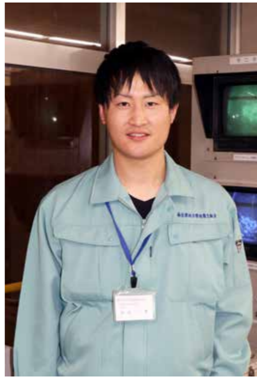
環境衛生課 東部環境係