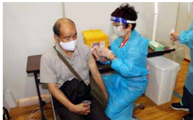
ワクチン接種の様子（集団接種）

70代男性は「接種後の副反応を心配したが、無事接種を終えることができた。痛みもほとんどなかった」と安堵した様子。2回目の接種は、例外を除き、3週間後に同じ会場・同じ時間で受けていただきます。お間違えのないようお越しください。