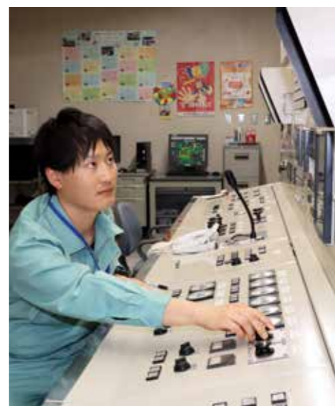
写真⑤ 可燃ごみを燃やす焼却炉が稼働する間 は、有毒物質の数値などのチェックが欠か せない

し、全戸配布している「ごみの分 別辞典」には、正しいごみの出し 方が網羅されています。物置や引 き出しの奥深くにしまうのではな く、すぐに取り出せる場所に置き ましょう。 町役場本庁舎や各総合支所窓口 でも配布していますので、ぜひご 活用ください。