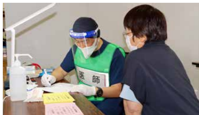
医師による予診（集団接種）