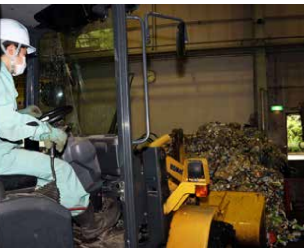
写真① ローダーを器用に操作し、粗大ごみ 供給コンベアへ。粗大ごみは、順次 破砕機へ運ばれ、選別・回収がしやす いよう細かく粉碎される