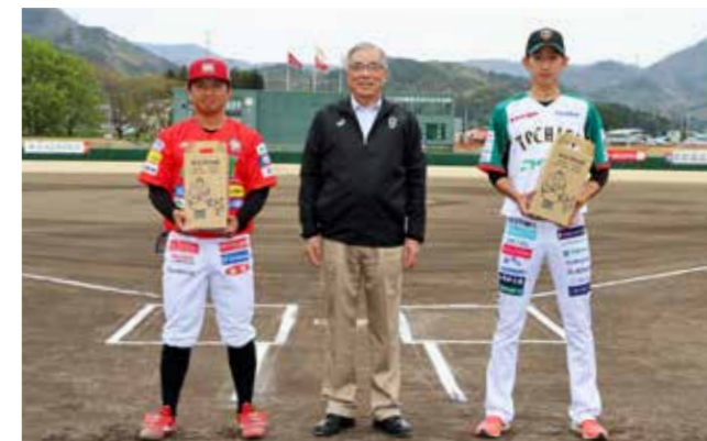
試合開始前に大宅町長から両チームへ特産品を贈呈

残念な結果とはなりましたが、試合後に福島レッドホープスの選手による野球教室を開催。プロの選手から直接指導を受ける貴重な機会を前に、参加した子どもたちの目は輝いていました。