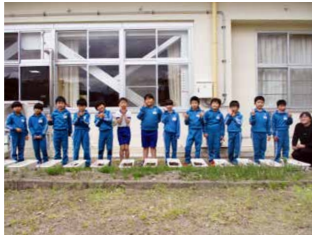
発芽に期待を膨らませる(荒海小学校)

館岩小学校では、児童が森林と人々の生活や環境との関わりについて理解を深めることを目的とした「森林環境学習」を行いました。今回の学習では、南会津森林組合館岩支所の皆さんを講師に迎え、シイタケやナメコなどの種菌を原木一本一本に植菌。今後も、館岩地域の豊かな自然環境を活用して、森林環境学習に取り組んでいきます。