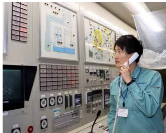
写真④ クレーン操作室や粗大ごみ処理施設を 管理する中央制御室。異常を知らせる ブザーやランプが点灯した場合は、即座 に現場と内線をつなぐ

ルールが守られず収集できない ごみには「違反ごみシール」を貼り 付けます。シールが貼られた場合 は、必ず自己責任で回収し、処理