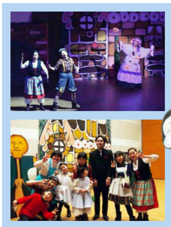
(写真④2枚) 平成30年公演時の様子 演目「ヘンゼルとグレーテル」