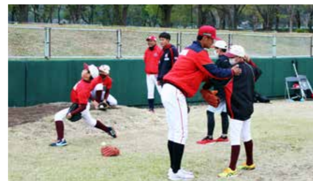
試合後に行われた野球教室