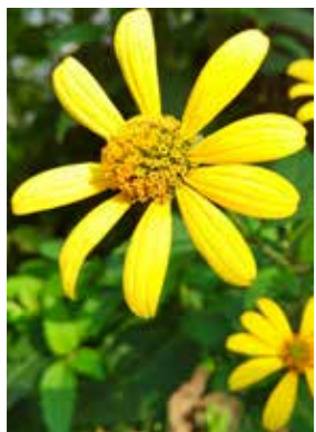
オオハンゴンソウ