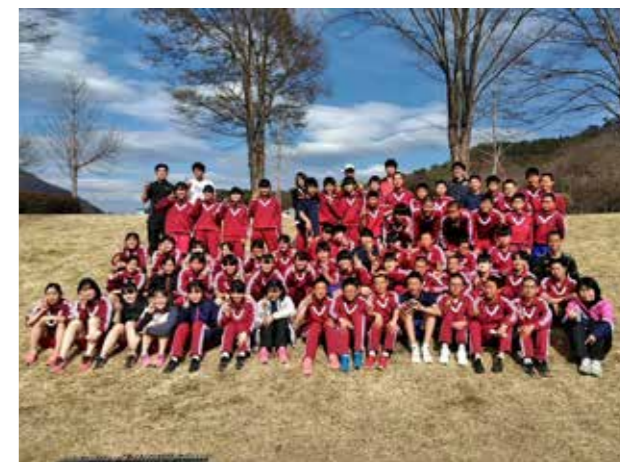
伝統ある赤ジャージが躍動(田島中学校)

荒海中学校では毎年、生徒会活動に目標を持って取り組むためのスローガンを掲げています。今年度の生徒会スローガンをPositive(積極的)、Oneself(自分自身で)、Wish(願い)、Eagerness(熱心)、Respect(尊重)と掲げました。当スローガンを基に、生徒会執行部が中心となり、積極的に行動・発言ができる日本一の学校を目指します。