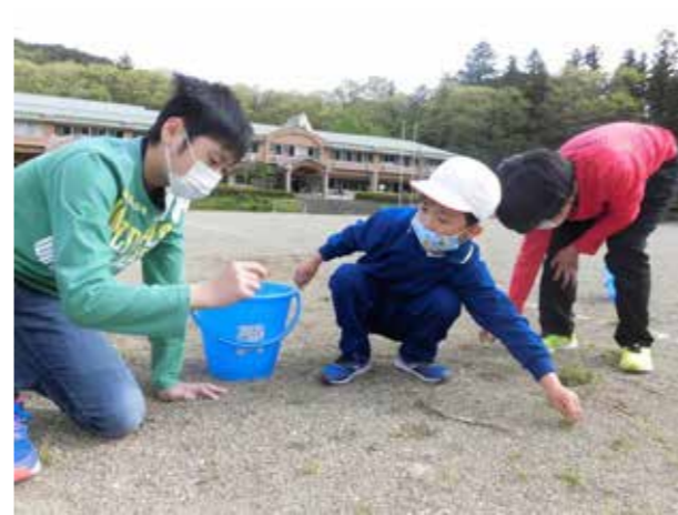
ひのき 松っ子のボランティア精神(松沢小学校)

伊南小学校では、南会津町の「さまざまな人・もの・こと」を体験する「ふるさと学習」に取り組んでいます。今回の学習では、学校畑にジャガイモの種芋を、プランターに花苗を植えました。班分けは、1年生から6年生までの縦割りを採用。上級生が下級生に植え方を教えたり、作業の分担をしたりと、協働しながら楽しく学習ができました。秋の収穫が楽しみです。