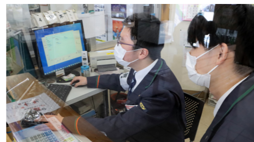
写真⑤ 今年度入社したばかりの後輩社員に窓口業務を指導