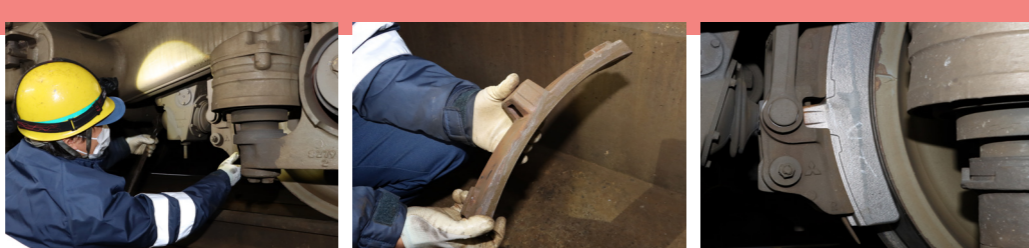
写真③ 3枚 ブレーキ装置の摩耗した部品を交換 (作業手順: 左から)

表舞台と舞台裏、それぞれのスタッフが汗をかくことで、成り立つ会津鉄道。今号では「表と裏」両方の視点から、鉄道を支える「若き力」をご紹介します。