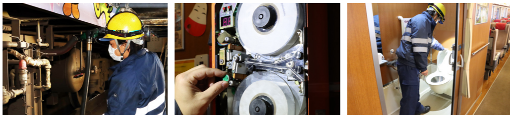
写真④ 3枚 車両整備の様子 (左から給油・ワンマン整理券発券機・トイレ)