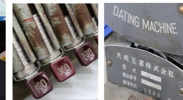
写真③ 2枚 旧国鉄時代から使用されている器具も現役で活躍中