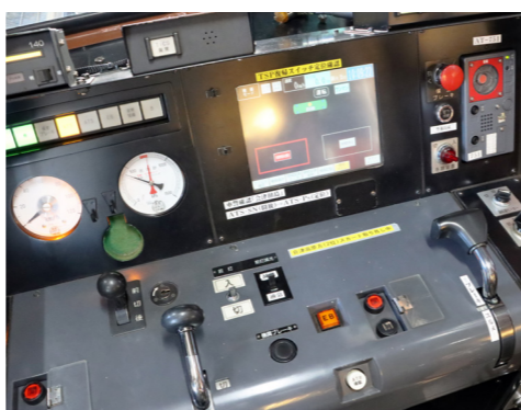
写真⑤ 運転席でシステム機器の動作を確認するとともに、発せられる「音」もチェック