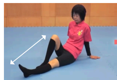
1 膝の曲げ伸ばし運動 関節が固まらないよう、何度も動かしましょう。