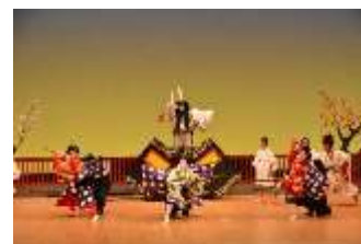
子ども歌舞伎公演