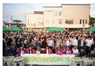
地酒で乾杯！プロジェクト 参加者集合