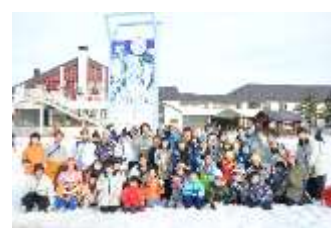
都市交流 (町内スキー場にて)