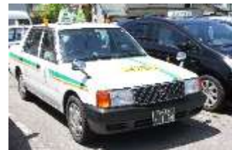
デマンドタクシー3