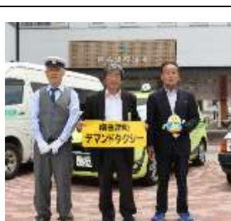
デマンドタクシー運転手