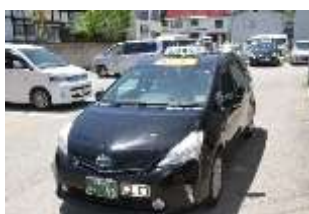
デマンドタクシー2