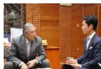
町長へ提言書を提出する 南会津町ワカモノ会議代表