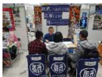
定住対策プロジェクト ～移住希望者相談受付～