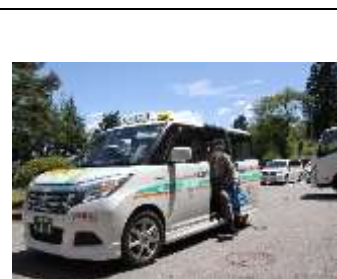
デマンドタクシー1