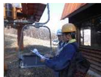
スキー場リフトの整備