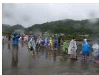
漁村生活を体験する 南会津町の小学生