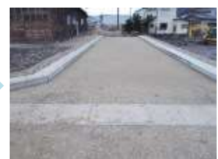
区画整理された土地