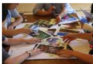
南会津町ワカモノ会議 町の魅力再考中