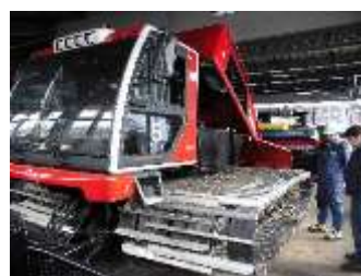
スキー場圧雪車の整備