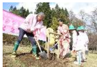
ヤマザクラいっぱいの 景観づくり