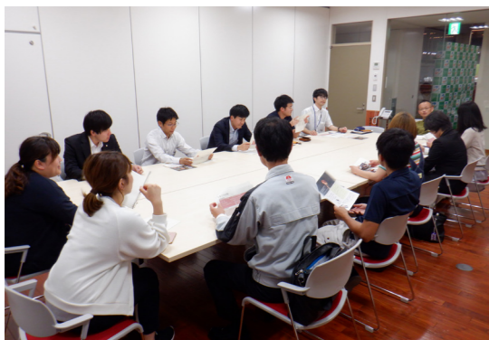
南会津ワカモノ会議の4年間の取り組みを通じて今回の提言をまとめ上げました

リノベーションとは、既存の建物に改修を行い、性能を向上させたり、付加価値を与えたりすること。