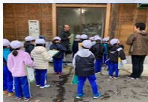
子どもたちを対象とした見学会