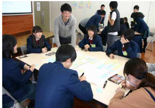
「10年後の南会津町へ生かすまちづくり案」をテーマにワークショップを行いました

サーモン回帰とは、サケが海で成長したのち、産卵のために生まれた川へ帰ってくる習性から連想した造語です。