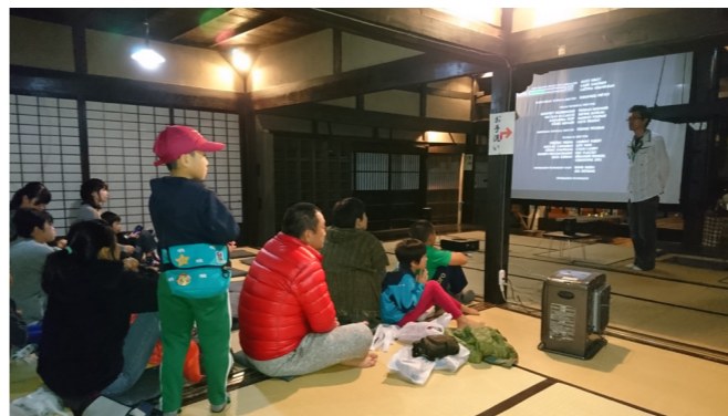
平成29年10月13日（金）第1回目のノー残業デーに合わせ年齢を問わず楽しめる映画の上映会を開催しました