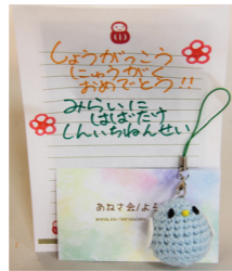
思いのこもった 手作りマスコット

南郷トマト農家や子育て世代の女性を中心となり活動している「あねさ会」。 4月2日、会のメンバーが館岩・伊南・南郷の各小学校を訪れ、手作りのマスコットを手渡しました。今年度小学校に入學した子どもたちへのお祝いと、未来に向けて元気に過ごしてほしいとの思いが込められています。 マスコットは、各家庭で眠っていた毛糸を集めてリサイクルしたもので、かわいい姿に生まれ変わりました。