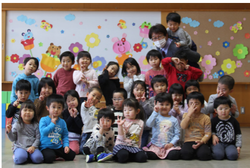
元気いっぱいの南郷保育所の子どもたち

4月初めに、南郷保育所にお邪魔しました。子どもたちは元気いっぱい笑顔で迎えてくれました。この笑顔を守るために、もう少しの間がんばりましょう。