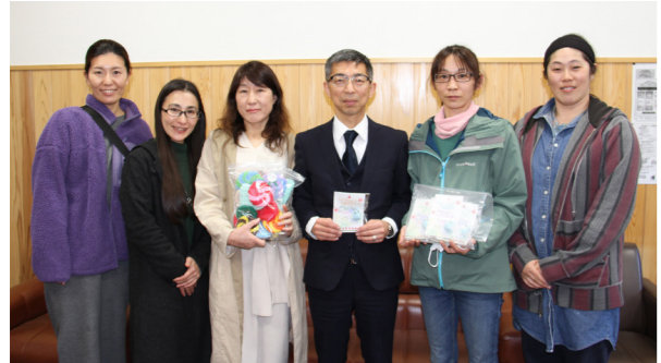
マスコットを手渡す「あねさ会」の皆さん（南郷小学校）