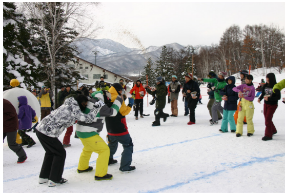
たかつえスキー場でのイベントには栃木・茨城・千葉など県外から多くの方に参加いただきました

町最大の誘客資源であるスキー場を活用したプロモーション活動の強化は、町にとっても誘客面で大きなメリットがあるため、積極的な活用を願いたい。