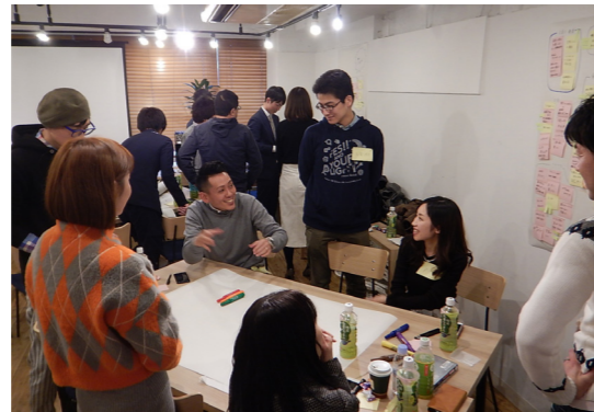
「ワカモノ会議 in Tokyo 2019」では高校生との意見交換会で示された提言をさらに深掘りしました