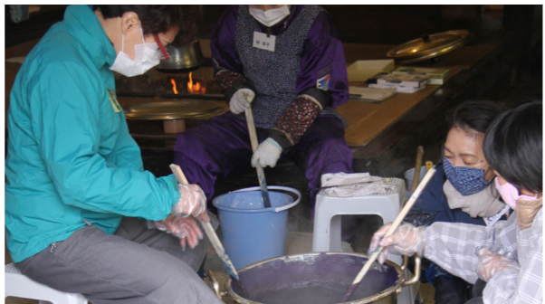
「藍建て」に挑戦する参加者の皆さん

4月11日、奥会津博物館で藍染講座の開講式が行われました。第1回目の講座には町民約30人が参加し、「藍建て」の技法を学びました。 「藍建て」とは、水に溶けにくい藍の色素をアルカリ溶液で還元し、染色できる状態にする技法です。新たに配属された地域おこし協力隊員2人も参加し、藍染めの原点となる技術を学びました。 今後は化学染料を使用しない「藍建て」技法など、年間15回の講座が予定されており、藍染め文化を受け継ぐ人材の育成に取り組めます。