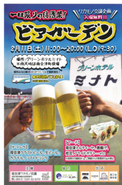
一日限りの復活を遂げたビアガーデンのチラシ

参加者個人や各団体から大きな反響があったイベントであり、引き続き南会津ワカモノ会議が中心となり事業を実施したい。多くの関係団体を巻き込みながら、持続可能な運営体制を目指しているため、町の継続した支援を願いたい。