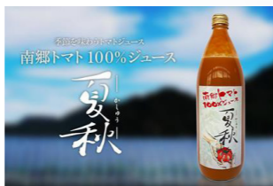
南郷トマト 100%ジュース夏秋

また、地元はもちろんのこと、会津若松市内の飲食店やホテル、都内飲食店などで、一次加工品としてトマトソースの提供も行っています。