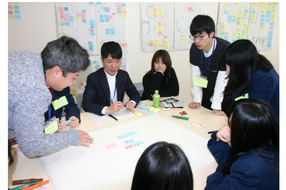
平成31年2月2日(土)に開催した田島高校生との意見交換会には15名の生徒が参加