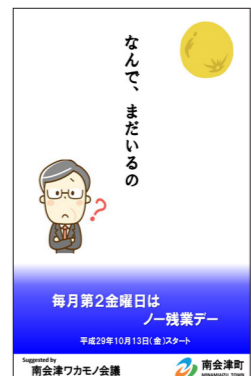
多くの企業から賛同を得たノー残業デーの周知ポスター

若者が集まる機会を創出するため、町内の企業が「一斉に「ノー残業デー」を実施できる基盤を整備できないか。毎月第2金曜日を「町内一斉ノー残業デー」として条例化することで、いつもより早い退社が促され、趣味の時間や友人と過ごす時間が増えることが期待される。