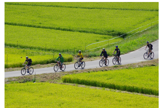
ワカモノ会議メンバー同士で地域の魅力を再発見する旅を企画