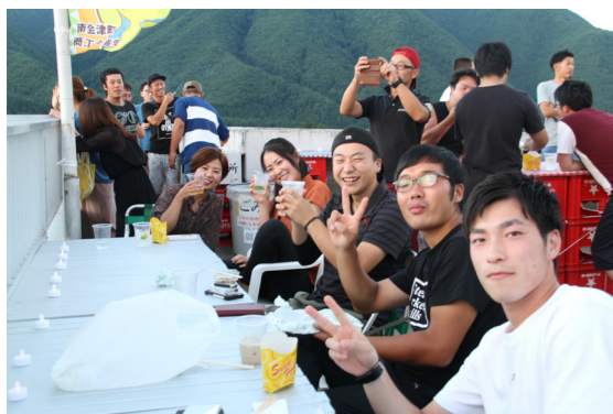
ただ一緒に盛り上がるだけではなく町の将来について意見を交わす様子が見られたことが印象的でした