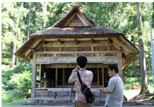
伝統的建築物の建築技術に触れ茅葺屋根の美しさを再認識

体験コンテンツの造成にあたっては、地元のディープな魅力を発見できるモデルコースを設定し、それぞれの魅力を紹介できるガイド付きメニューの造成が必要ではないか。