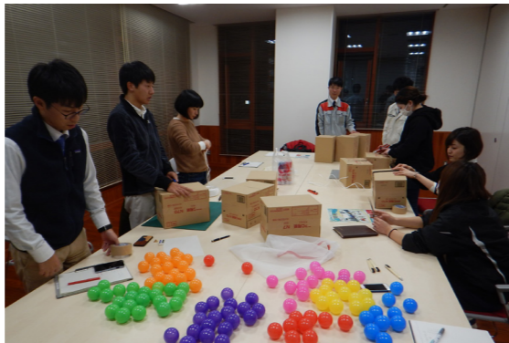
企画したイベントを成功させるためメンバー同士で協議や準備を重ねました