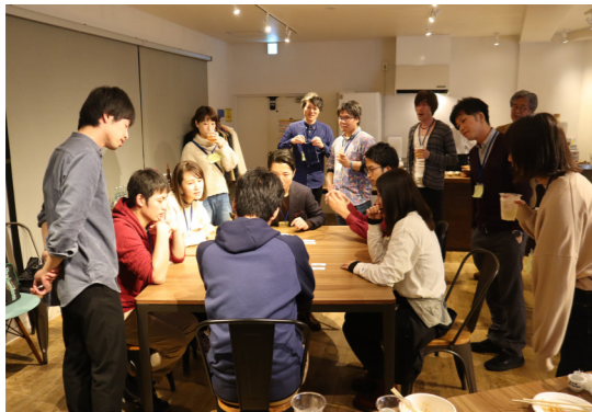
「ワカモノ会議 in Tokyo 2020」では移住・定住の実体験を絡めた意見交換を行いました