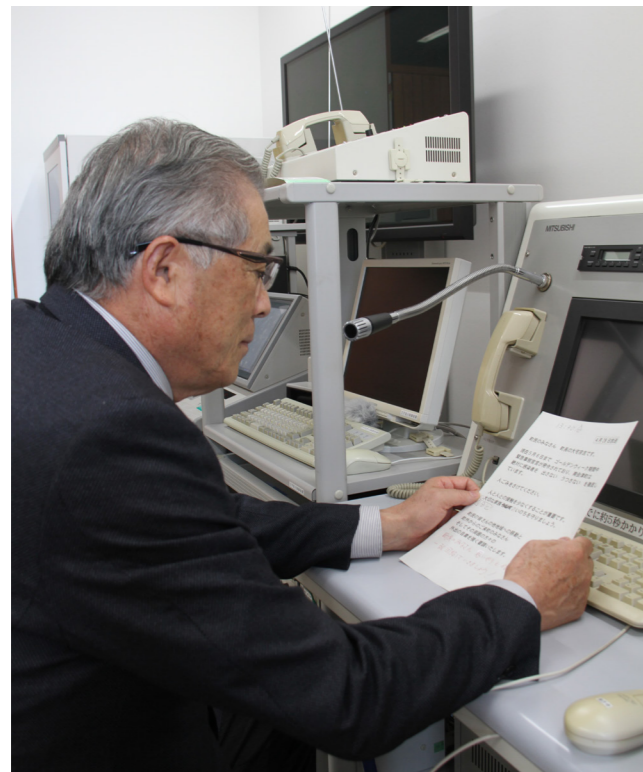
防災無線で町民に呼びかける大宅町長

新型コロナウイルス感染症を防ぐために、人と人との接触を減らす必要があります。自分と大切な家族の“いのち”を守りましょう。