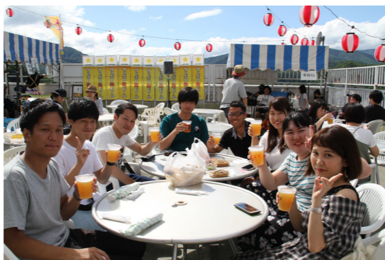
平成30年8月11日（土）に開催したビアガーデンには240人もの参加者が訪れました