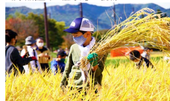
稲刈りのコツをつかんだ子どもたちは鎌を上手に使いこなしていました

10月18日、公民館講座「親子で挑戦」の第5回学習会が開催されました。 6月に開催された第1回学習会では、泥だらけになりながら田植えに挑戦。約4カ月が過ぎ、すくすくと成長した稲は、たわわに実を付け、見事な黄金色に。 参加された皆さんは、まぶしいほどの日光と、清々しい風を全身に浴びながら、稲刈りに挑戦しました。 中腰での作業で大汗をかきながらも、上手に稲を刈り取っていく子どもたち。また、それを見守る保護者の皆さんも満面の笑み。親子の絆が深まる大切な時間を過ごすことができました。