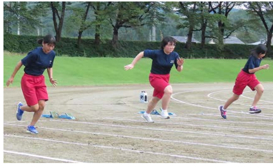
ソーシャルディスタンスを保ちながら記録更新に挑む

例年開催している「南会津町びわのかげ陸上競技大会」は、新型コロナウイルス感染症の感染拡大防止の観点から、開催が困難であると判断し、大会規模を縮小した上で、「びわのかげ短距離記録会」を代替開催しました。 9月27日、競技科目を1000mと2000mの2種目に絞り開催された短距離記録会に集う小・中学生の子どもたち。 参加者それぞれが、自分が持つ短距離記録を更新するために、あるいは自分の記録がどれほどか確認するために、健脚を競い合い、最後の最後まで全力で駆け抜けていました。