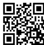
メールでの提案は コチラから

〒960-0186 福島市杉妻町2-1-6 福島県庁県民広聴室 Tel 024(521)7013 F 024(521)7934