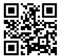
QRコード (ショウエーHP)