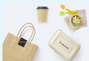
テイクアウト用資材の購入