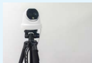
サーマルカメラの導入