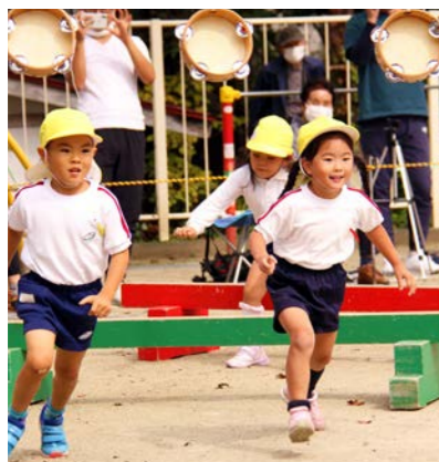
暁の星幼稚園（運動会の障害物競争）