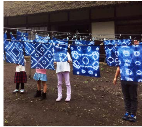
色鮮やかな絞り染めが完成しました

9月27日、奥会津博物館で地域おこし協力隊の主催による「藍染めイベント」を開催しました。