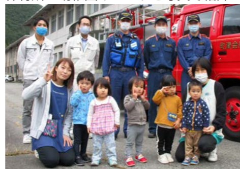
館岩幼稚園（総合避難訓練）