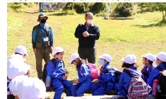
湯田横町区長から弁天山の説明を受ける子どもたち