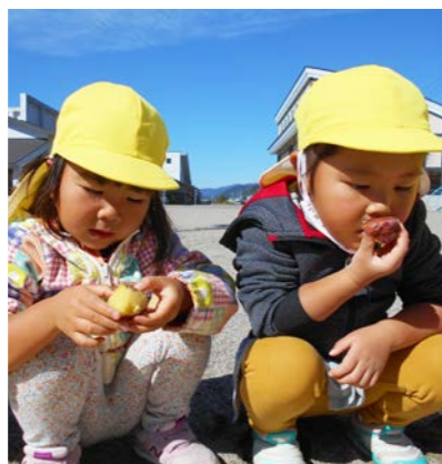
南郷保育所（やきいも会）