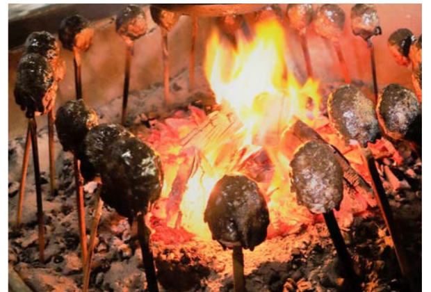
エゴマが香るしんごろうは、イベントに欠かせません