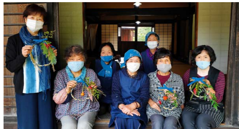
新たな体験プログラムとして「しめ縄リースづくり」の定着を目指します

は竹馬や竹とんぼといった「昔の外遊び」体験などを提供しています。藍染めを施した藁と布を使用した「しめ縄リース」は、本イベントの開催に向けて、私たちが考案したものです。古今地区「ろばたの会」の皆さんを講師に迎え、藁を手でよって作った「しめ縄リース」に、花や木の実に自由に飾りつける参加者の皆さん。世界に一つだけのオリジナルリースが誕生しました。