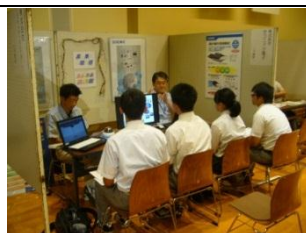
雇用・企業誘致対策事業