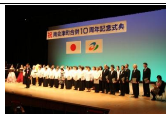
合併10周年記念事業