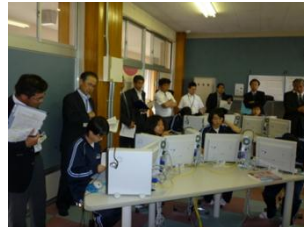
学習サポート事業