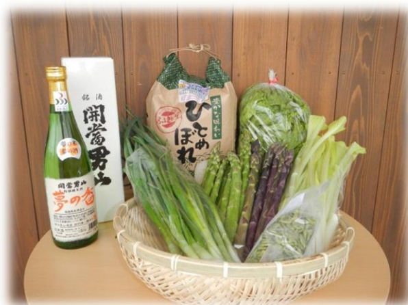
特産品詰め合わせ(イメージ写真) ※季節により内容が異なります。

さらに、“南会津町の特産品”コース又は南会津町産の米“「雪の米」”コースのいずれかを選択いただき、お贈りいたします。