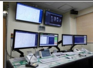
消防救急デジタル無線整備事業