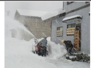
高齢者生活支援事業