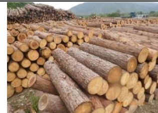
森のエネルギー創出事業