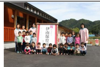
伊南保育所建設事業