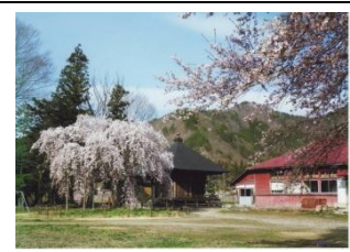
景観づくり推進事業 (景観重要建造物・樹木)