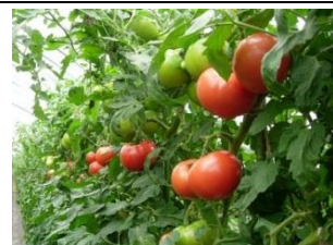
元気な産地づくり等整備事業