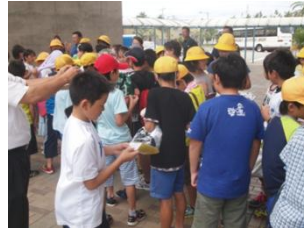
小学生農山漁村交流事業