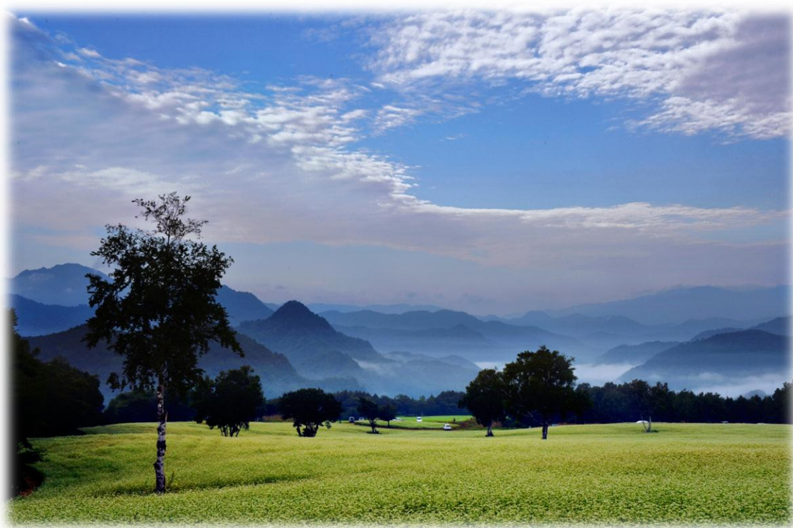
たかつえのそば畑