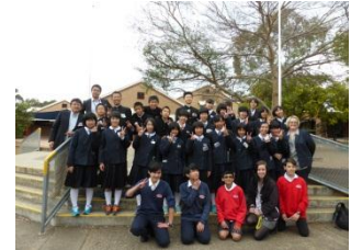
中学生海外交流事業