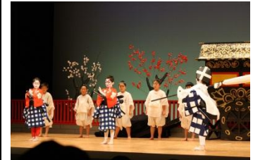
田島祇園祭屋台歌舞伎保存事業