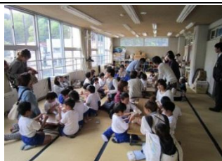
放課後児童対策事業