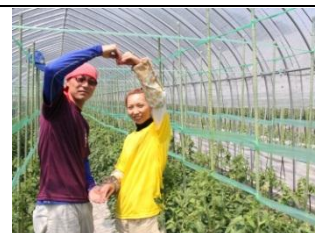
新規就農者支援事業