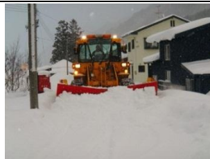
除雪機械整備事業