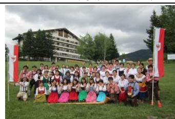
元気のでのる地域づくり支援事業 (会津高原地区活性化事業)