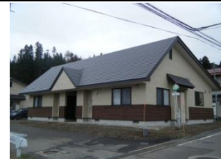
町営住宅建替事業