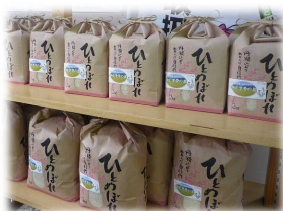
30,000 円以上寄付いただいた方で、「雪の米(30 kg分)」を希望された方は、一括発送か分割発送(1ヶ月毎3回)をお選びいただけます。

平成28年7月から、インターネットを活用した“クレジット決済”により「ふるさと納税」ができるようになります。