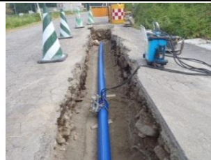
上・下水道整備事業