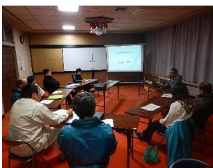
地域ビジョン策定事業