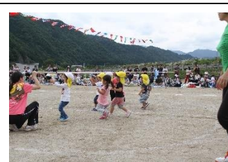
5歳児保育料無料化事業 (保育所運動会)