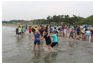
小学生農山漁村交流事業