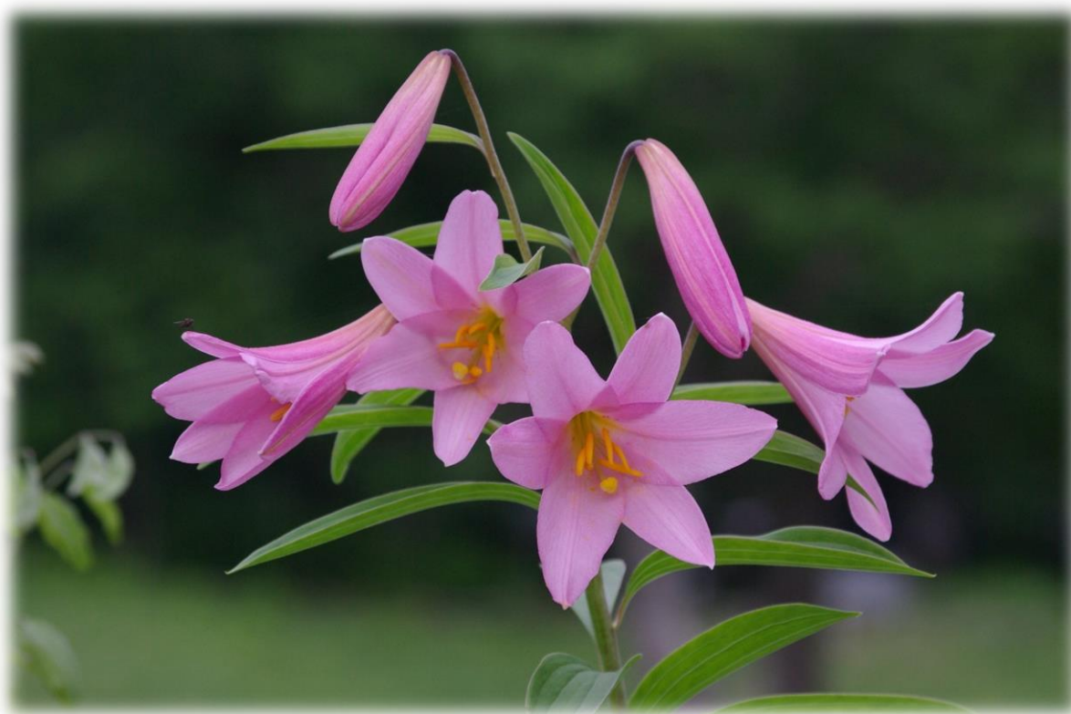
ひめさゆり（高清水自然公園）