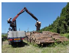
森のエネルギー創出事業