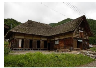
前沢曲家集落保存対策事業