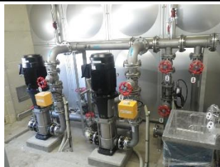
上・下水道整備事業