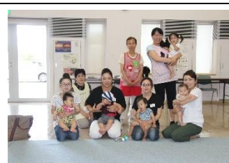
子育て環境づくり事業