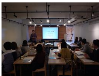
南会津ワカモノ会議