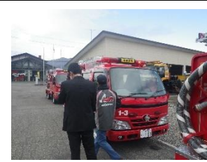
消防設備整備事業