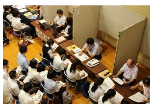
雇用・企業誘致対策事業