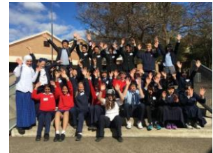
中学生海外交流事業