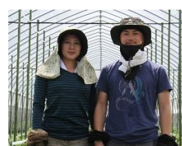
新規就農者支援事業