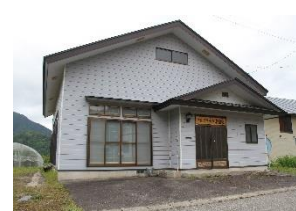
伊南スポーツツーリズム推進事業