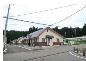
町営住宅建替事業