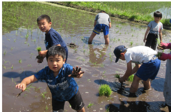
慣れない作業でも 子どもたちは元気いっぱいです