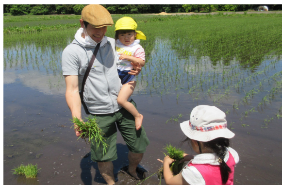
楽しい田植えを通じて 親子の会話も弾みます

晴天に恵まれた6月7日に、公民館講座「親子で挑戦」が開催されました。第1回学習会には、12組34名の親子が参加され、田植えを体験しました。子どもたちは、素足のまま田んぼに入り、泥の感触を楽しみながら、田植えに挑戦していました。親子間の交流はもちろん、新しい友だちとの交流も深まったようです。10月には稲刈りにも挑戦する予定で、植えたばかりにもかかわらず、稲の生長が待ち遠しい様子がかがえました。初めての経験に戸惑いながらも、目が輝いている子どもたちが印象的でした。