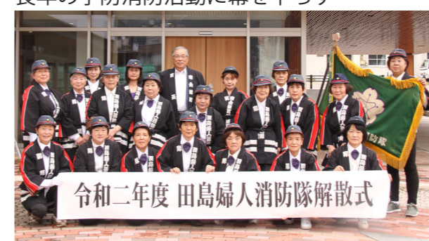
田島婦人消防隊の皆さん