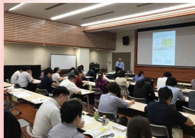
初回セミナーの様子

なお、初回セミナーに参加されなかった方でも、修了セミナーに参加できますので、希望される方は問い合わせ先へお申し込みください。